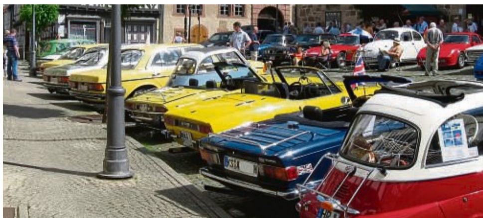
Blickfang: Automobile Schmuckstücke aus Zeiten des Wirtschaftswunders wird es am Pfingstwochenende in Spangenberg zu sehen geben.

Liebhaber klassischer Automobile und Zweiräder treffen sich an Pfingsten in der historischen Altstadt von Spangenberg zu einem markenoffenen Oldtimertreffen. Egal ob Kleinwagen oder Straßenkreuzer, Moped, Roller, Motorrad oder Personenkraftwagen der Ober- und Luxusklasse, sie sind alle bei den Liebenbach Classics willkommen. Die Stadt Spangenberg entführt ihre Gäste über das Pfingstwochenende auf eine Reise in die Wirtschaftswunderjahre.