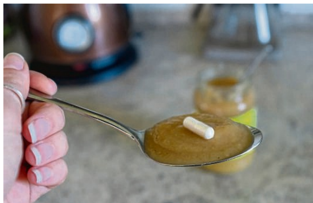
Hat jemand Schwierigkeiten beim Schlucken von Tabletten, kann ein Löffel Apfelmus helfen.

Apotheken bieten außerdem sogenannte Medikationsanalysen an. Vereinfacht gesagt heißt das: Ein Apotheker oder eine Apothekerin überprüft, ob all die Präparate, die man einnimmt, zusammenpassen oder ob Wechselwirkungen drohen. Die Kosten dafür tragen seit vergangenem Sommer die gesetzlichen Krankenkassen. Voraussetzung: Der oder die Versicherte nimmt regelmäßig mindestens fünf ärztlich verordnete Medikamen-