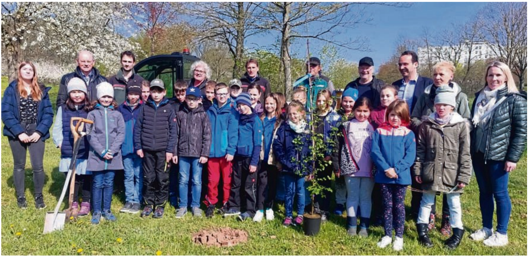
Drittklssler der Altenburgschule Bad Zwesten haben unter Anleitung eine Moorbirke, den Baum des Jahres 2023, im Bad Zwestener Kurpark gepflanzt.

Seit 30 Jahren beteiligt sich die Gemeinde an der Aktion „Baum des Jahres“. 1993 hat die Schutzgemeinschaft