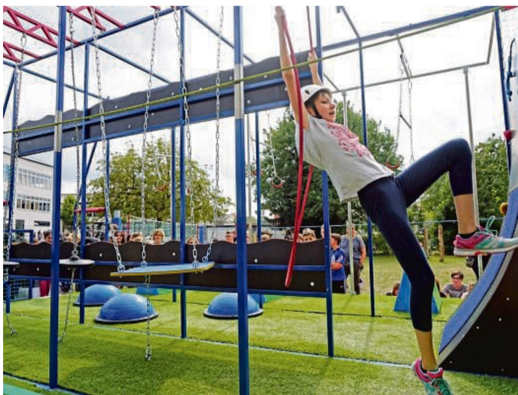
Er bietet viel Platz zum Hangeln und Klettern: So ähnlich wie der Parcours auf dem Foto könnte auch die Ninja-Warrior-Anlage in Jesberg aussehen.

Das Büro Stadt und Natur aus Kassel plant zusammen mit der Gemeinde die Anschaffung, die vom Kellerwaldverein mit Leader-Zuschüssen bedacht wird. Die Firma 3D-Sportanlagen aus Rosenheim hat ein Angebot gemacht, in dem sie Jesberger Vorgaben aus ihrer Erfah-