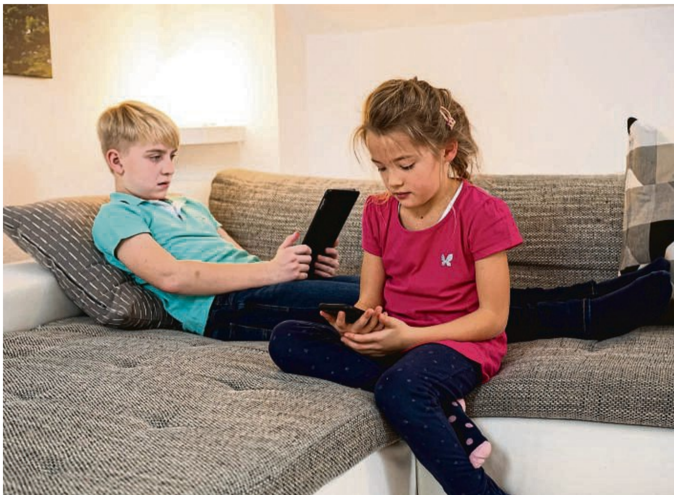
Zu viel Zeit am Bildschirm kann die Gehirnentwicklung von Kindern beeinflussen, zum Beispiel, wenn es um den Wortschatz geht.

Die Folge: Im statistischen Mittel brauche man etwa 9,5 Minuten, um sich wieder in die alte Aufgabe einzudenken. „Das heißt, man verliert einfach viel Zeit, um wieder mit höchster Effektivität arbeiten zu können“, sagt Korte, der auch ein Buch zum Thema geschrieben hat („Frisch im Kopf: Wie wir uns