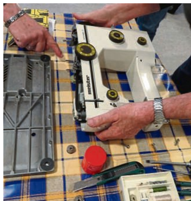
Reparieren statt wegwerfen: Im Alheimer Reparatur Café erhält etwa diese defekte Nähmaschine ein zweites Leben.