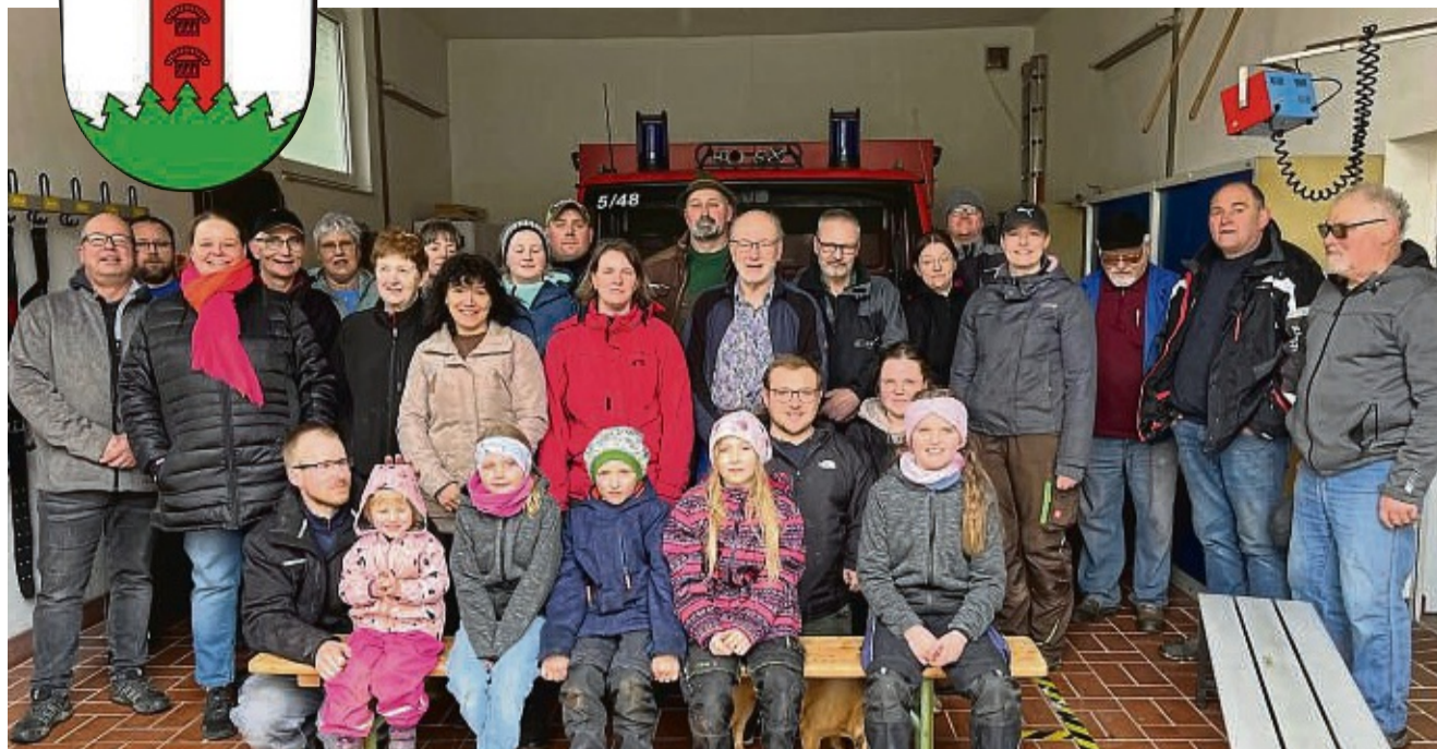
Fleißige Helfer: Die Teilnehmenden des diesjährigen Licheröder Frühjahrespuzzes beim Ausklang der Aktion im Feuerwehrgerätehaus.