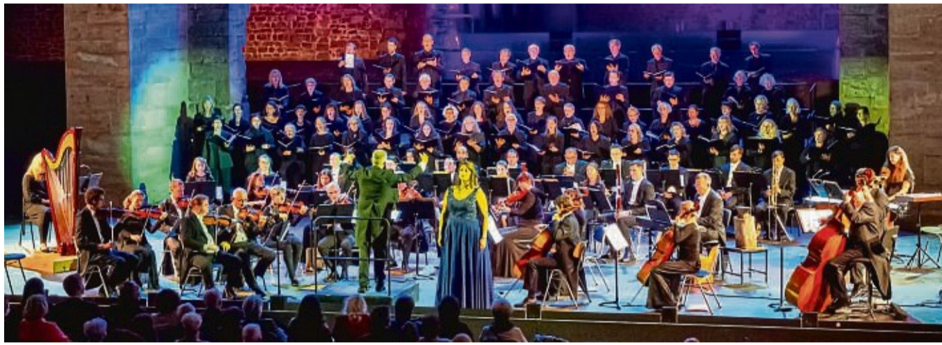
Die Operngala 2022: „Von Magiern und Mythen“ in der Stiftsruine.