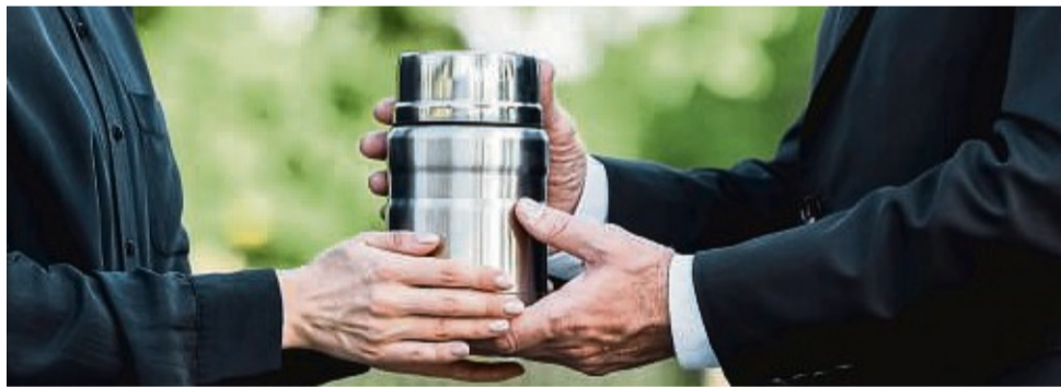
Die Feuerbestattung mit anschließender Beisetzung in einer Urne löst zunehmend die klassische Erdbestattung ab.

Es steigt die Nachfrage nach neuen Formen des Abschieds