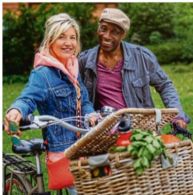
Für Gesundheit und Klima in die Pedale treten: Am 29. Mai startet das STADTRADELN in Alheim.