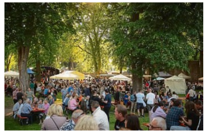
Gemütlich: Über 20 Stände bieten im Bad Hersfelder Stiftsbezirk Winzerweine sowie Speisen an.