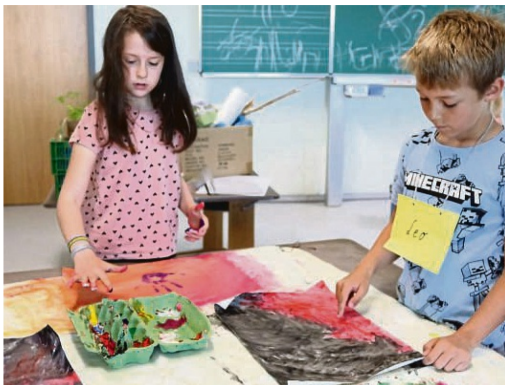
Wie malt man Gefühle? Diese beiden Schüler versuchen, ihr Innerstes auf Papier zu bringen.