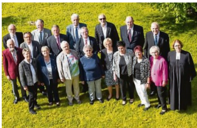
Die Wiedersehensfreude war groß bei der diamantenen Konfirmation am Pfingstsonntag in Sontra.

Donnerstag, 29. Juni 18 Uhr Maiandacht in Sontra 18.30 Uhr Hl. Messe in Sontra