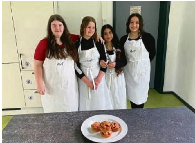
„Projektprüfung“: Hauptschulklasse nahm an Probeprojektprüfung teil - der Adam-von-Trott-Schule in Sontra, hier Schülerinnen der Klasse 8.

In diesem Jahr arbeiteten die Schülerinnen und Schüler zum einen zu den Biologiethemen „Krokodil und Alligator“ und „Honig“. Es wurden aber auch Musikthemen, wie „Rammstein“ oder „Punkrock“ gewählt. Andere Gruppen arbeiteten prak-