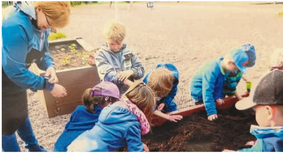
„Wer will fleißige Gärtner sehen?“, der muss in die Kita Ulfen gehen. Mit Eifer wurde das Hochbeet bepflanzt

Im vergangenen Jahr hatte die Landbäckerei und Edeka Liese aus Ulfen die Kita bei der Edeka Obst- und Gemüsegarten-Aktion „Aus Liebe zum Nachwuchs/ Gemüsebeete für Kids“ beworben. Die ist ein Projekt der Stiftung Edeka. Von Edeka hatte die Kita bereits im letzten Jahr ein Hochbeet gestiftet bekommen und in diesem Jahr auch eine Bepflanzung. Im Mai war es soweit. Morgens kam das Edeka-Team. Liese hatte alles für die Bepflanzung des Hochbeetes vorbereitet - es wurde gemeinsam Erde und verschie-