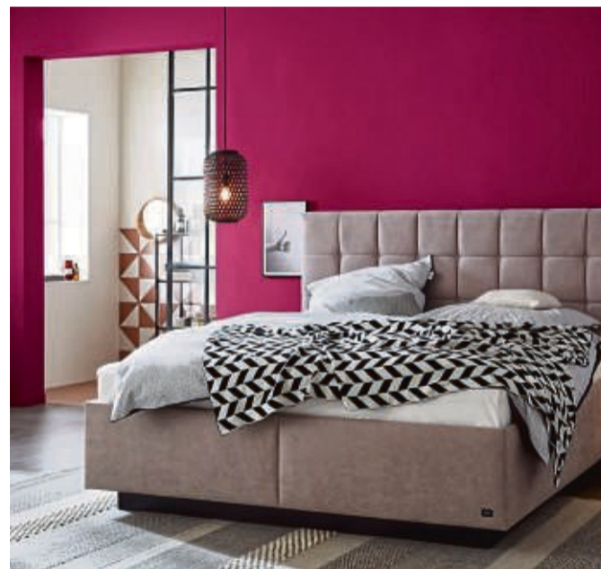
Wandfarben prägen entscheidend die Atmosphäre des Zuhauses und bringen gleichzeitig den persönlichen Stil der Bewohner zum Ausdruck. Kräftige, eher dunkle Farben vermitteln im Schlafraum eine entspannende und behagliche Stimmung.