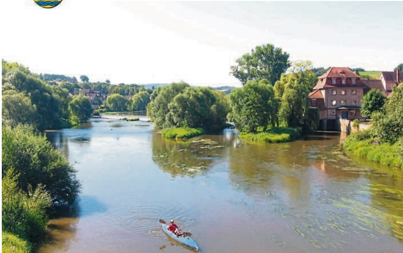
Mit dem Kajak am Wehr: Wochenend- und Tagestouren starten in Guxhagen.