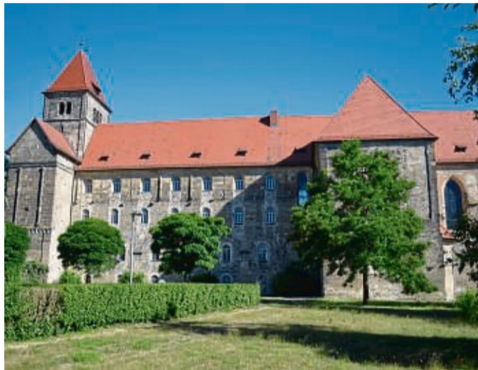
Die Klosterkirche Breitenau bietet den Wanderern Möglichkeit zur Einkehr.

Eine Mönchsfigur erinnert an den Benediktinerorden, der 400 Jahre hier lebte, bevor das Kloster im Zuge der Reformation aufgelöst wurde. Die Gedenkstätte Breitenau erinnert an die Inhaftie-