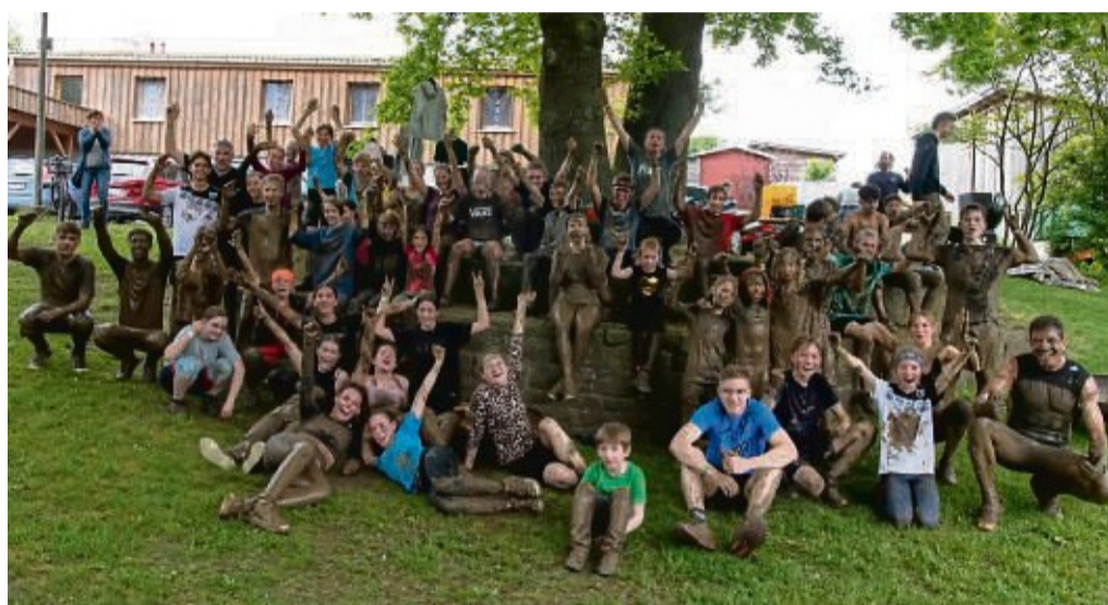
Dreckig, aber glücklich und stolz auf ihre Leistung: Teilnehmer des Sponsorenlaufs beim Verein „Anorak21“ in Falkenberg.

Falkenberg – Am Sponsorenlauf in Falkenberg von „Anorak21“, dem Verein für kreative Jugendarbeit auf dem Lande, haben 53 Menschen teilgenommen. Der jüngste Läufer war acht Jahre alt, der älteste über 50 Jahre. Alle gemeinsam haben rund 3000 Euro erlaufen. Das Geld fließt zum einen in die Jugendarbeit von Anorak21 und zum anderen an Kinder und Jugendliche der Gemeinde Zabolotzi in der Ukraine, wohin die Falkenberger Feuerwehr schon Anfang des Jahres ein altes Tragkraftspritzenfahrzeug Wasser (TSF-W) gespendet hatte.