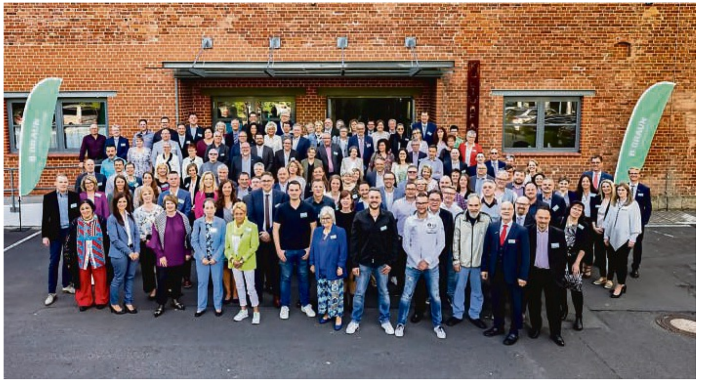
3645 Jahre: Ein Gruppenfoto aller B. Braun-Jubilare vor der Melsunger Kulturfabrik.