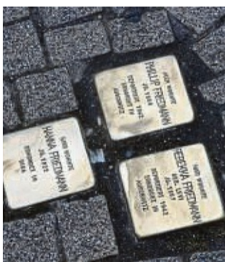
Vor dem Gebäude Neustadt 32 in Spangenberg zeugen Stolpersteine davon, wer hier einst sein Zuhause hatte.