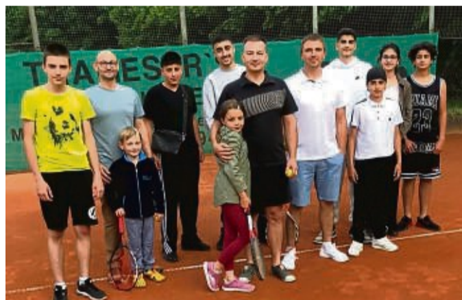
Der Tuspo Borken bietet ab Ende Juni wieder ein Tennistraining für Kinder- und Jugendliche.

Tennis ist ein beliebter Sport, der einzeln und in der Mannschaft ausgeübt werden kann. Leisten könne sich das heutzutage fast jeder, teilt der Verein mit. So beträgt der Jahresbeitrag für Kinder im Tuspo 60 Euro und der Zusatzbeitrag für Tennis 20 Euro jährlich. Es wird mehrere Trainingsgruppen geben: 6 bis 9 Jahre, 10 bis 13 Jahre und 14 bis 70 Jahre. Wer min-