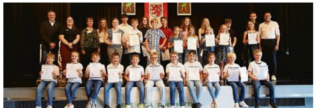
Die Gewinner des Jugendmusikwettbewerbs, den die Stadt Borken gemeinsam mit der Musikschule Schwalm-Eder ausrichtete.