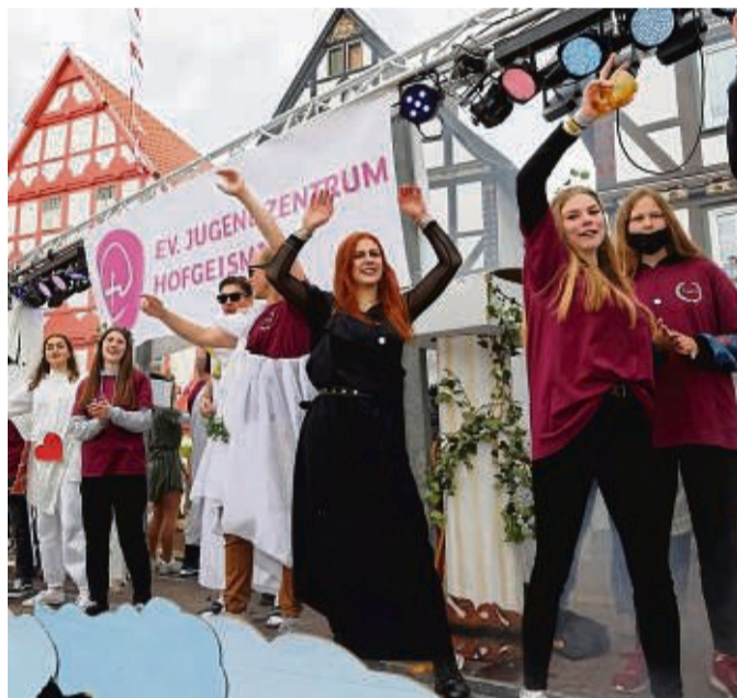
Motivwagen, Fußgruppen und viel Musik: Der Höhepunkt wird auch in diesem Jahr wieder der Festzug durch Hofgeismar werden.