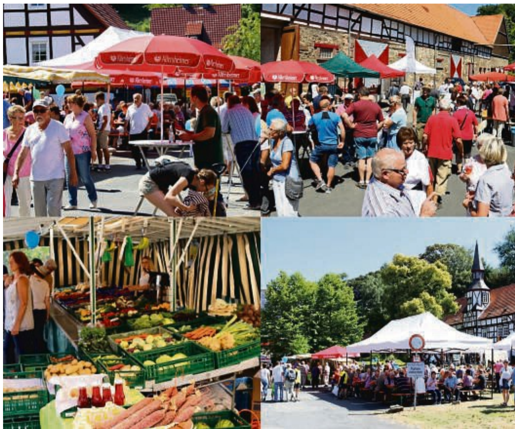
Der Trendelburger Sonntagsmarkt findet in diesem Jahr am 9. Juli statt.

Das Zentrum des Marktes bildet ein Platz für das gemütliche Beisammensein – umrahmt von den Marktständen. Frische Brötchen, Marmelade, Honig, Eier, Obst, Gemüse, Fleisch- und Wurstspezialitäten - und natürlich dürfen Käse sowie warme Leckereien, wie frisch zubereitete Pfannengerichte nicht fehlen. Wein, Sekt, frische