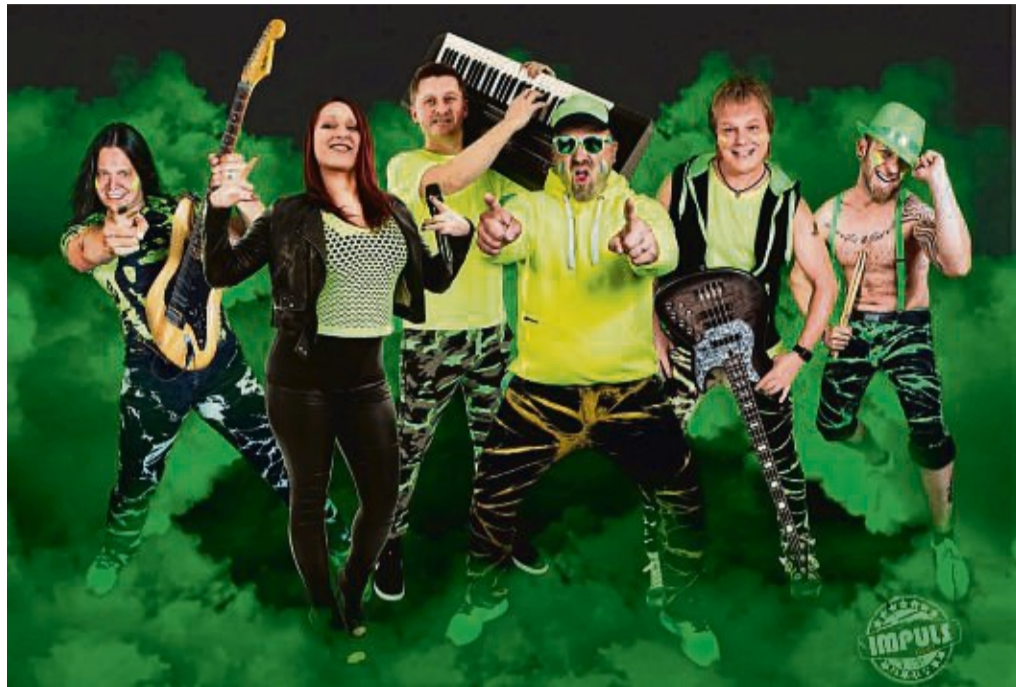
Zur Eröffnung am Freitag, 2. Juni, spielt ab 20 Uhr die aus Norddeutschland stammende Band Impuls.

Zur Eröffnung am Freitag, 2. Juni, spielt ab 20 Uhr die aus Norddeutschland stammende Band Impuls (impuls-live.de). Bis 2 Uhr in der Nacht wird hier mit Musik zum Tanzen, Mitsingen und Mitfeiern für gute Stimmung gesorgt.