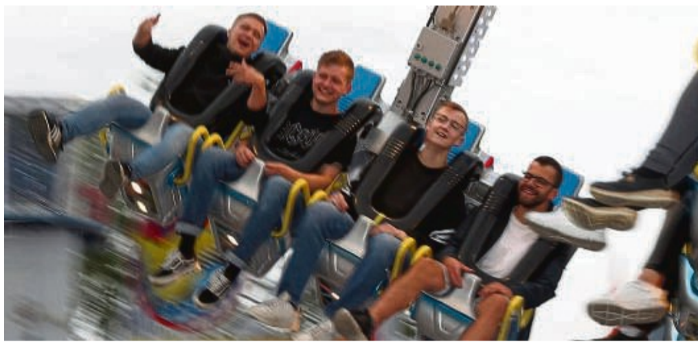
Ein paar Runden drehen: Sieben Fahrgeschäfte sorgen für Nervenkitzel.

Das gab es lange nicht mehr: In diesem Jahr soll wieder ein Riesenrad (zum Hofgeismarer Viehmarkt kommen, diesmal das „Liberty Wheel“ mit 38 Meter Höhe und 25 000 Leuchten. Weitere Attraktion neben Breakdance, Autoscooter und Musik-Express ist ein 40 Meter hoher Kettenflieger, bei dem es nicht nur im Kreis, sondern auch rasant nach unten geht. Insgesamt gibt es sieben Fahrgeschäfte, zwei Laufgeschäfte, etwa 15 Imbisse, Ausschänke und Eis- und Süßigkeitenstände sowie den traditionellen Pott- und Krammarkt.