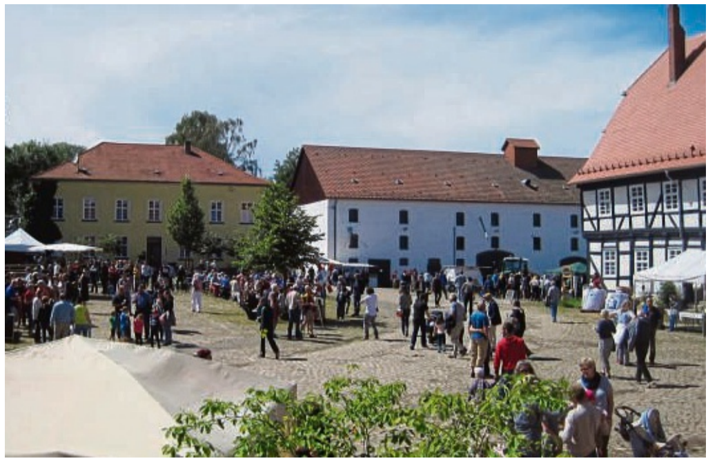
25-jähriges Bestehen: Mit dem neunten Hoffest samt buntem Programm feiert die Domäne Frankenhäusen ihren Geburtstag.

Domäne Frankenhäusen feiert 25-jähriges Jubiläum