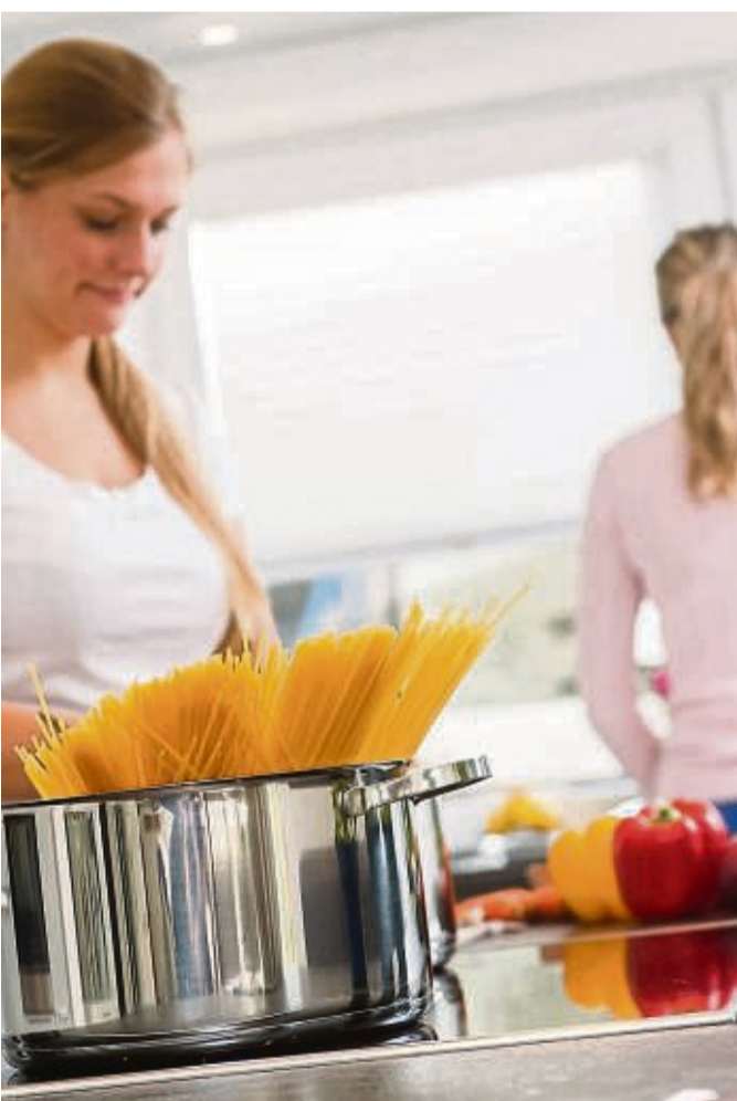
Nudelwasser sollte man nach dem Kochen nicht achtlos wegschütten: Die enthaltene Stärke macht es zu einem wertvollen Kochhelfer.

Und taugt das Kochwasser auch zum Blumengießen? Bei Nudelwasser lässt man das laut Daniela Krehl lieber. Es besteht Gefahr, dass die Stärke im Blumentopf zu