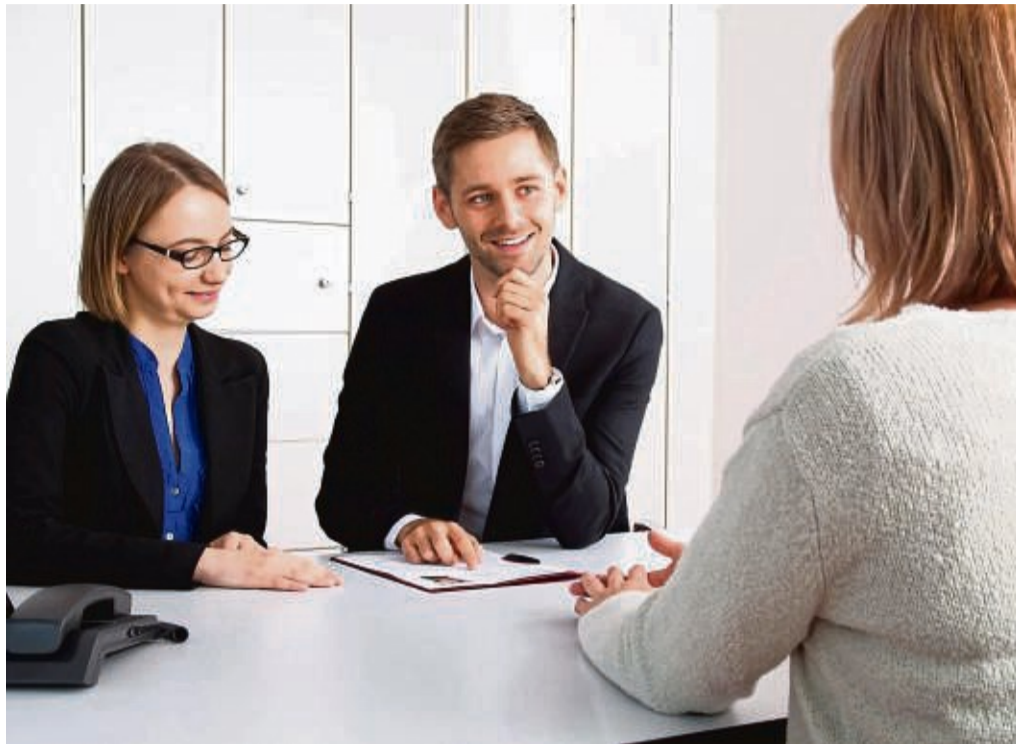
Wer in Bewerbungsgesprächen oft unsicher ist, kann in Rollensimulationen ein souveräneres Auftreten trainieren.

Am Anfang steht beim Coaching dann meist der Blick auf die Bewerbungsunterlagen. Eine Coachin oder ein Coach hilft, die Unterlagen so zu gestalten, dass sie auf die Anforderungen der jeweiligen Stelle abgestimmt sind und die eigenen Stärken und Erfahrungen gut zur Geltung bringen. „Damit steigt die Chance, dass der Personalverantwortliche den Bewerber oder die Bewerberin zu einem Gespräch einlädt“, erklärt die Hamburger Kar-