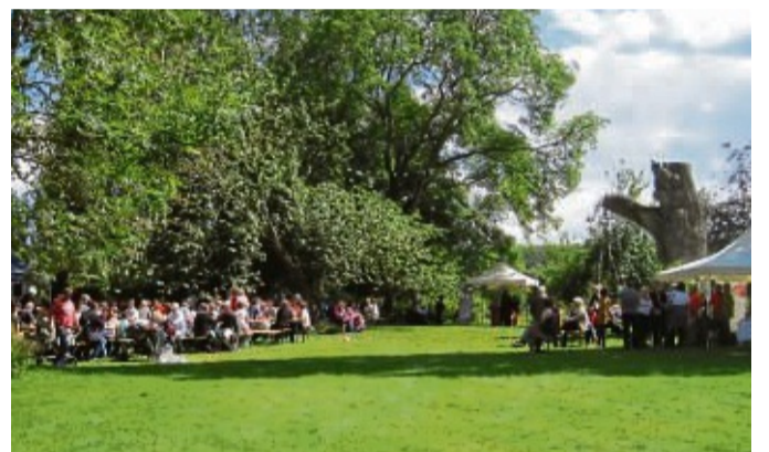
Einladend: Auf dem weitläufigen Gelände gibt es viele Angebote zum Mitmachen und zum gemütlichen Verweilen.

Darüber hinaus wird das Jungle Orchestra mit Jazz und Hot Dance Music unterhalten