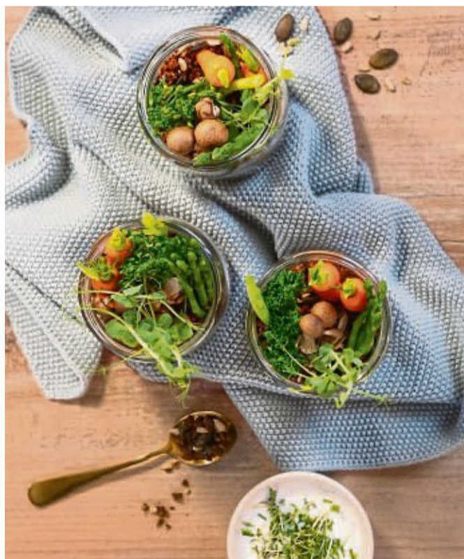
Leckere Spezialitäten frisch vom Hof: Regionales Gemüse ist ein wichtiger Bestandteil einer ausgewogenen Ernährung.

Rezepttipp für saisonale Gemüsespezialitäten