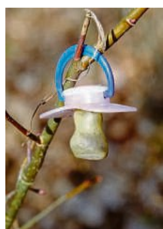
Das Kinderfest am Schnullerbaum findet am 25. Juni von 12 bis 16 Uhr statt.

Vorort gibt es das Spielmobil der Aktion Jugend, Kinderschminken, eine Hüpfburg, Tatütata die Feuerwehr ist da, einen Kinder- und Jugendflohmarkt, und vieles mehr. Außerdem gibt es für alle Kinder, die ihren Schnuller an den Schnullerbaum hängen, eine Urkunde und ein Geschenk. Weitere Infos gibt es auf: buergerverein-heli.de