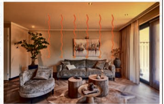
unabhängig heizen mit Infrarot Heizung unter der Decke

Fast jeder sucht Alternativen beim Heizen. Der schnelle Umbau oder eine Erneuerung der Heizungsanlage scheitert oft an der Verfügbarkeit neuer, energiesparender Anlagen und an langfristig ausgebuchten Handwerkern. Das Lagerfeuer im Wohnzimmer ist bekanntlich keine Option, scheidet also auch aus. Was lässt sich alternativ und unabhängig zu Gas- oder Ölheizungen einbauen? Wie wäre es mit einer Infrarotheizung? Infrarot sorgt für behagliche Wärme. Wie bei Sonnenstrahlen spürt die Haut diese Wärme sofort. Herrlich! Auch für Hausstauballergiker. Infrarotheizungen können elegant unter Spanndecken „versteckt“ werden. Plameco bietet Dir eine neue, glatte Decke