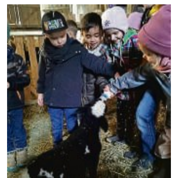
Tiernachwuchs: Die ASB-Kitakinder aus Lutterberg durften beim Bauernhofbesuch in Lippoldshausen einem Lamm die Flasche geben.

Lippoldshausen – Wächst Joghurt am Strauch oder woher kommt es? Das war die Frage, der die Kinder der ASB-Kindertagesstätte Lutterberg zusammen mit den pädagogischen Fachkräften kürzlich nachgegangen sind. Dafür machten sie einen Ausflug auf einen Bauernhof in Lippoldshausen. Davon berichtet Antje Carina Schumache, ASB-Kreisverband Göttingen-Land.