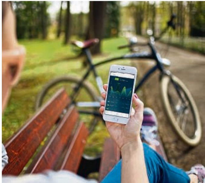
Beim Stadtradeln geht es darum, mit Spaß, Teamgeist und Gemeinschaftserlebnissen möglichst viele Radkilometer beruflich und privat zurückzulegen.

Nach dem Login können dann im Menü unter „Mein Team“ selbst die Unterteams gebildet werden. Bei Fragen können sich alle Interessierten an Sarah Lutz unter sarah.lutz@eschwege-rathaus.de oder 0 56 51/30 43 49 wenden.