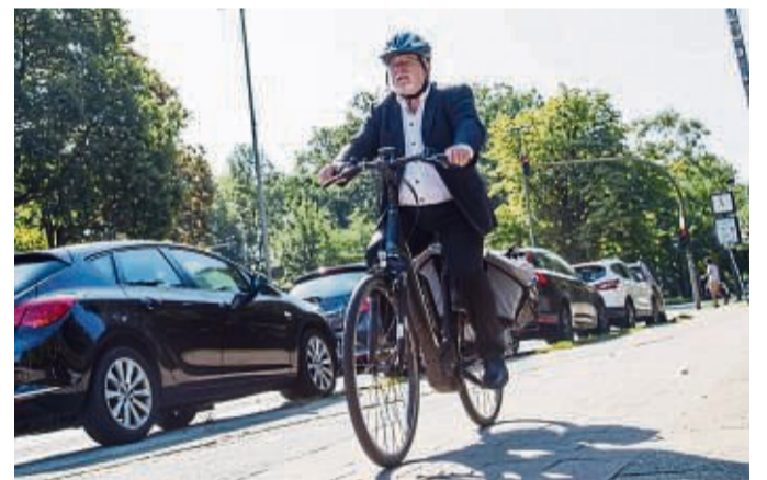
Vorteil einer E-Bike-Tour: Fahrer überfordern ihre Körper und ihre Gelenke nicht - und können trotzdem Ausdauer und Muskeln trainieren.

Übrigens: Shrups geben nicht nur Getränken ein besonderes Aroma. Auch für Saltdressings, Tortenguss oder Cremedesserts können sie verwendet werden. tmm