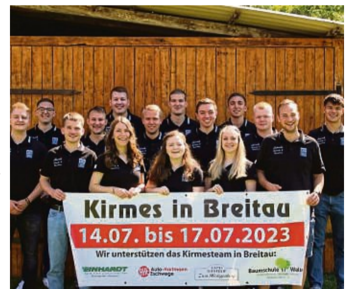
Das Kirmesteam lädt ein: Zeltkirmes in Breitau vom 14. bis 17. Juli 2023

Hätte, könnte, sollte - einfach machen! Jede Spende zählt! Informationen rund um das Thema Blutspende erhalten Interessierte online unter www.drk-sontra.de .