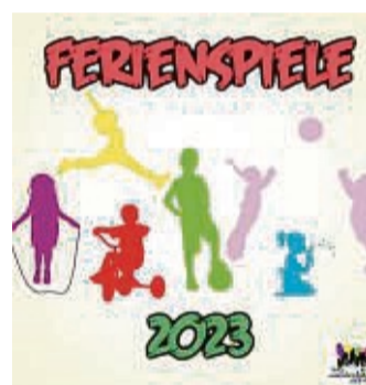
Ferienspiele 2023 in Sontra

Sontra – Die Awo-Jugendförderung der Stadt Sontra freut sich, in Zusammenarbeit mit der Sozialarbeit an Gesamtschulen im Werra Meißner Kreis und den beiden ortsansässigen Schulen, den Eltern auch in diesem Jahr wieder eine zuverlässige Betreuung in der Zeit von 8 bis 16 Uhr für Kinder im Alter von sechs bis zwölf Jahren anbieten zu können.