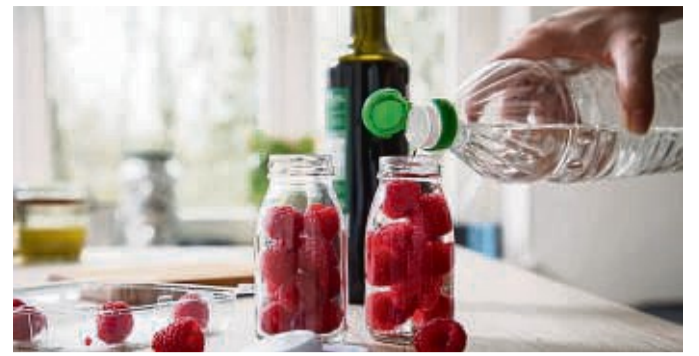
Apfelessig, Zucker, Himbeeren: Das sind die Zutaten eines klassischen Shrubs. Aber daran müssen Sie sich nicht halten.