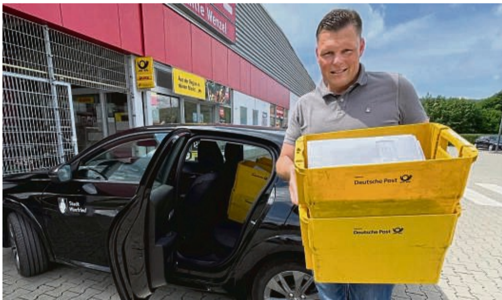
In acht Postkisten wurden die 650 nationalen und fast 40 internationalen Briefe zur Post gebracht.

Gebhard weiß: „Jeder Ehemalige ist ein Botschafter der