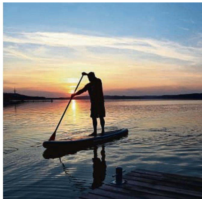
Wer eine Stand-Up-Paddling-Tour macht, sollte eine Uhr mitnehmen und sich rechtzeitig vor dem Sonnenuntergang auf den Rückweg machen.

Das Paddel sollte leicht sein, auf dem Wasser schwimmen können und etwa 15 bis 30 Zentimeter größer als der Nutzer sein. Viele Paddel sind in der Länge ver-