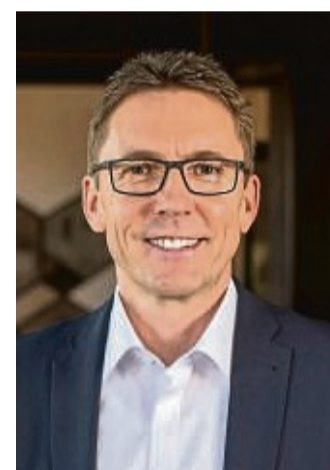
Marcel Pritsch Bürgermeister

„Um die ehrenamtliche Arbeit auf städtischen Flächen zu unterstützen, haben die beiden Vereine am See je fünf Jahresparkscheine erhalten, die sie an die Mitglieder verteilen können. „Ich verstehe gut, dass der Wegfall von Vergünstigungen nun auf Unmut stößt, doch es ist schade, dass man diesen Gesprächspfad nun verlässt“, teilt Bürgermeister Marcel Pritsch mit.