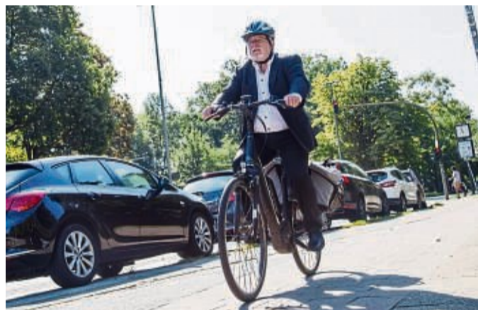
Vorteil einer E-Bike-Tour: Fahrer überfordern ihre Körper und ihre Gelenke nicht – und können trotzdem Ausdauer und Muskeln trainieren.

Übrigens: Shrubs geben nicht nur Getränken ein besonderes Aroma. Auch für Salatdressings, Tortenguss oder Cremedesserts können sie verwendet werden. tmn