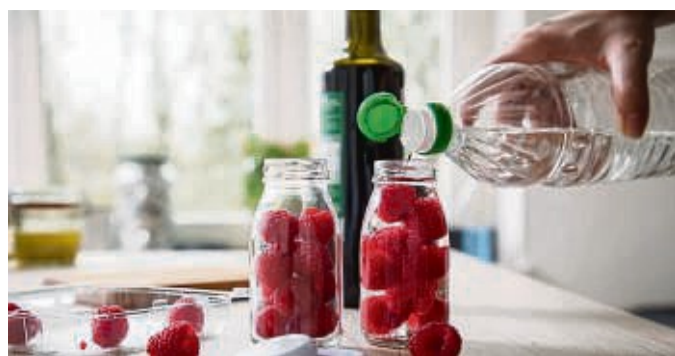
Apfelessig, Zucker, Himbeeren: Das sind die Zutaten eines klassischen Shrubs. Aber daran müssen Sie sich nicht halten.