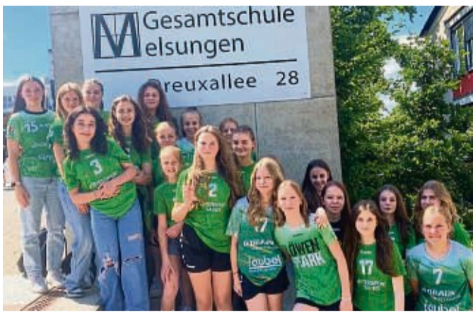
Von der SG 09 Kirchhof: Handball-Mädchen werben für ihren Sport und Verein.

Raiffeisenbank Borken unterstützt Vereinsarbeit mit Spende