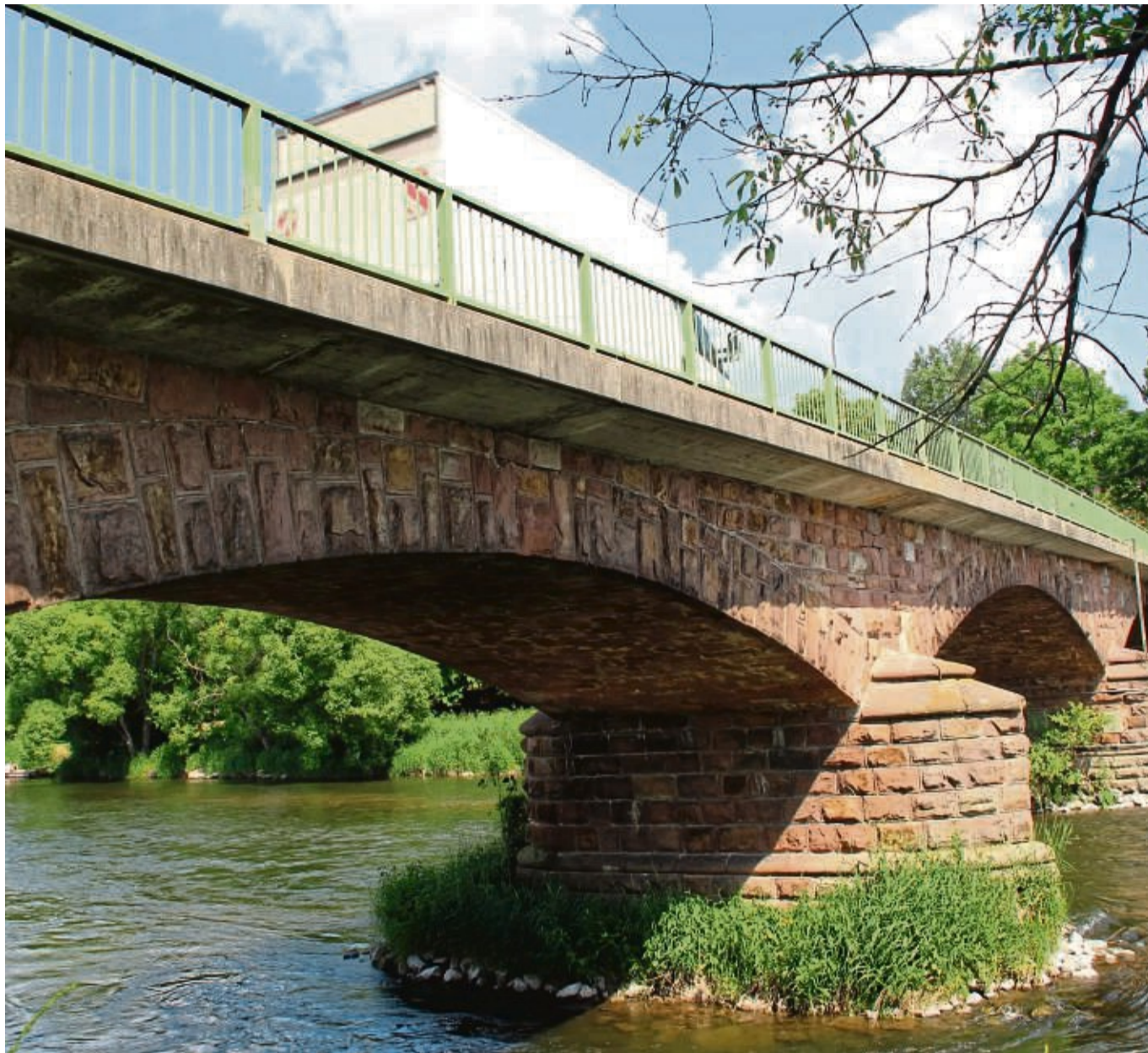
Historisches Bauwerk: In drei Bögen überspannt die Sandsteinbrücke in Brunslar die Eder. Das Bauwerk stammt aus dem Jahr 1890. Hessen Mobil hatte im April Probebohrungen vorgenommen. Die sogenannten Erkundungsbohrungen dienen, wie es offiziell hieß, „der Feststellung der Materialeigenschaften der Natursteingewölbebrücken“.

Dazu gibt es auf Anfrage keine offizielle Äußerung von Hessen Mobil. Hingewiesen wird lediglich auf die Neuberechnung. Lingemann: „Wenn wir genau wissen,