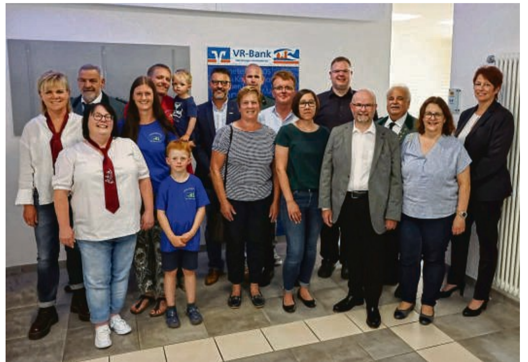
Für sie gab es Geld von der Raiffeisenbank Borken: Unser Foto zeigt Vertreter der prämierten Vereine und die Juroren.

Malsfeld sowie an dem Engelsburg Gymnasium in Kassel und der Jacob-Grimm-Schule in Rotenburg. Mitten drin war das Maskottchen Löwe Leo, der die Schulen besuchte. Bei der SG 09 Kirchhof boomt der Handball derzeit. Bei Grün-Weiß werden aktuell mehr als 150 Mädchen in allen Jahrgangsstufen ausgebildet, um künftig den Sprung in das Zweitligateam oder das Juniorteam in Hessens Oberliga zu schaffen, heißt es weiter.