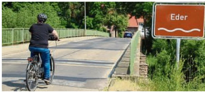
Die Ederbrücke in Brunslar hat nur einen Gehweg auf der flussabwärts gelegenen Seite. Die Brücke ist auf maximal 18 Tonnen Belastung zugelassen. Radler müssen die Fahrbahn benutzen.

was an dem Bauwerk gemacht werden muss, werden wir auf die Stadt Felsberg zu gehen, um weitere Schritte abzustimmen.“ „Dazu kann ich nichts sa-