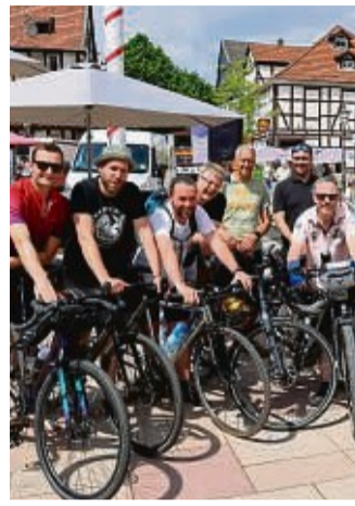
Strampelten drei Wochen durch die Region: Mehr als 100 Hofgeismarer machten beim Stadtradeln dieses Jahr mit.

Aufgeteilt in 13 Teams waren die Hofgeismarer Stadtradel-Freitagmittag schon 22 487 Kilometer gefahren. „Das bedeutet, dass wir 3,6 Tonnen CO 2 eingespart haben“,