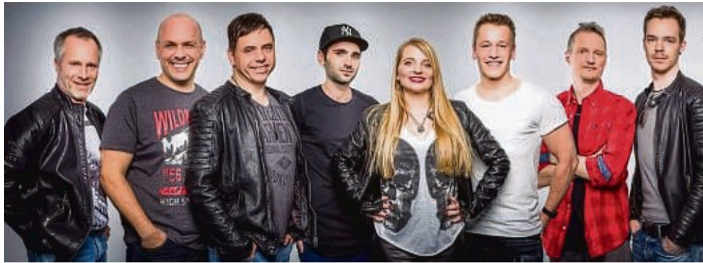
Power-Show Band mit mitreißendem Programm: „Eine Band namens Wanda“.