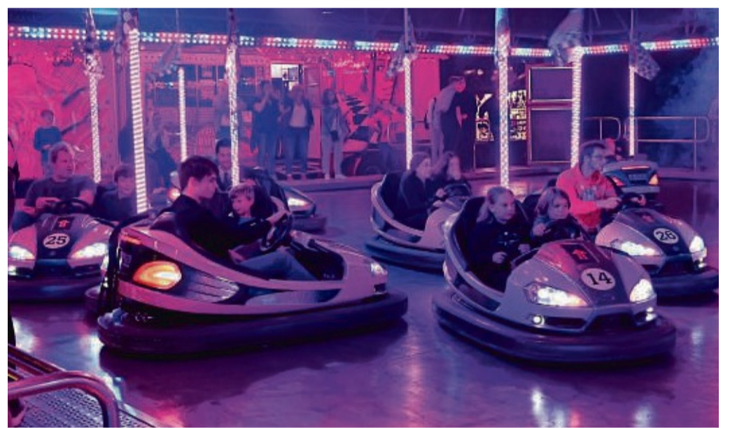
Ein Klassiker: Auch ohne Führerschein macht es einen unglaublichen Spaß, im Autoskooter seine Runden zu drehen.

Diese Mischung an attraktiven Fahrgeschäften und Ständen verspricht erneut einen