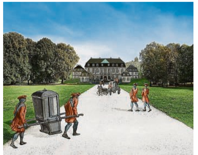
Impression aus dem Gucki: Blick auf Betriebsamkeit im Park und vor dem Schloss zur Zeit des Rokoko.