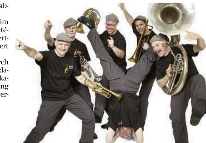
Vor allem der Spaß am Spiel machen die Auftritte von Brass for Fun unvergesslich.