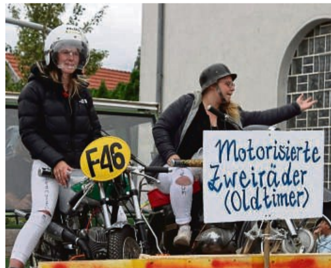
Sehenswert: Die Teilnehmer am großen Festumzug sind mit sichtlichem Spaß bei der Sache.