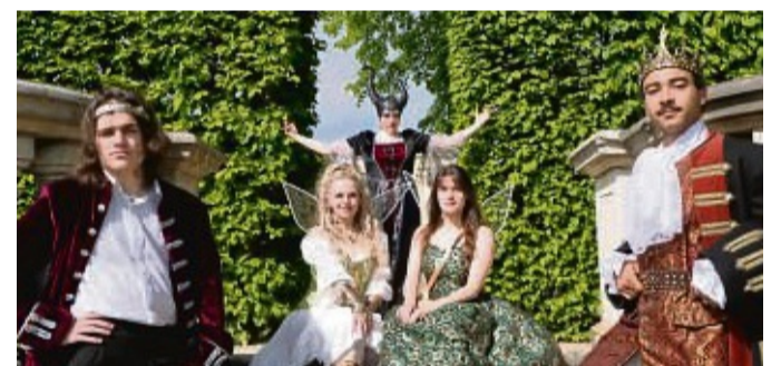
Theater: Grimmige Geschichte mit dem Herkules Theater.