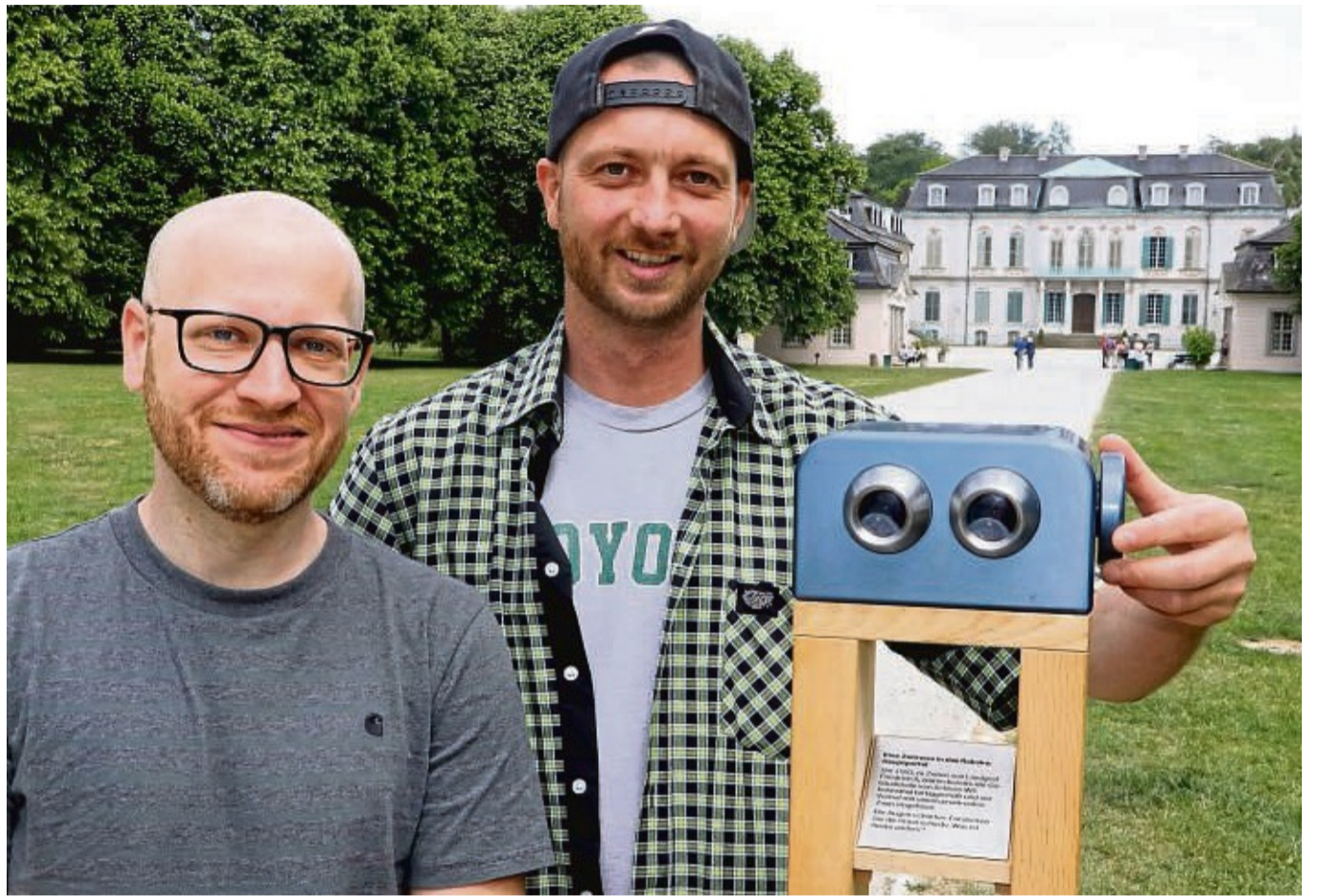
Gleich am Eingang erwartet die Besucher des Schlossparks von Wilhelmsthal der erste Guckkasten, entwickelt von Pierre Landgrebe und Julian Knappe (Kasseler Kreativagentur xcite).