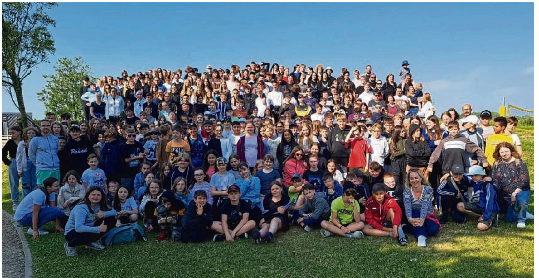
Von Münden nach Neuharlingersiel: 340 Personen waren anlässlich des 65-jährigen Schuljubiläums der Drei-Flüsse-Realschule an die Nordsee gereist.