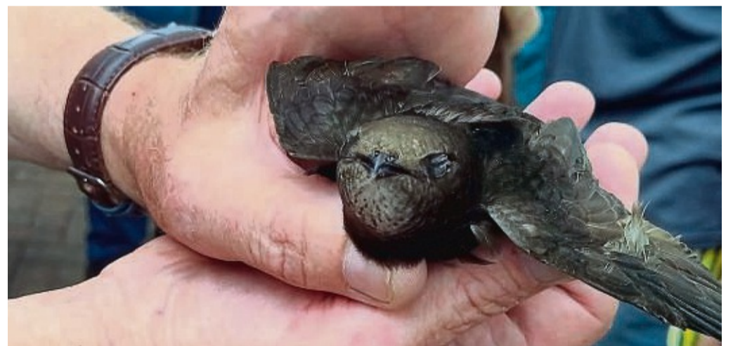
Erschöpft von der Rettungsaktion musste sich der Mauersegler erst einmal erholen.