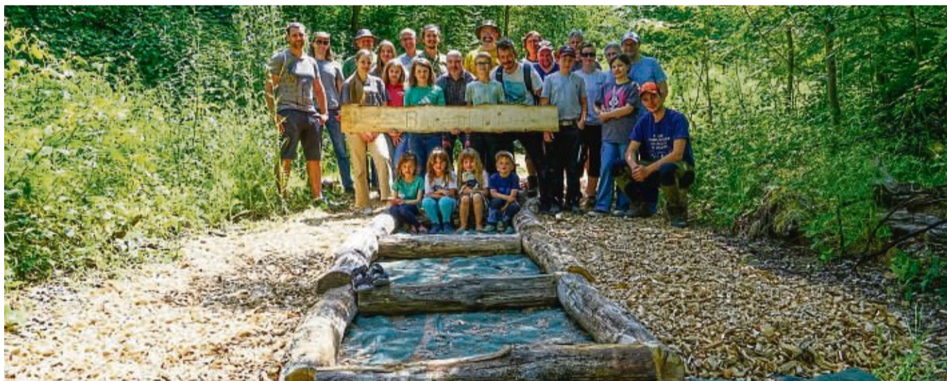
„Abenteuer Wald“: Am Wochenende ist auf dem Gelände des Waldpädagogikzentrums Göttingen am Steinberghaus ein Barfußpfad begonnen worden. Mit tatkräftiger Unterstützung der Vätergruppe Kassel.