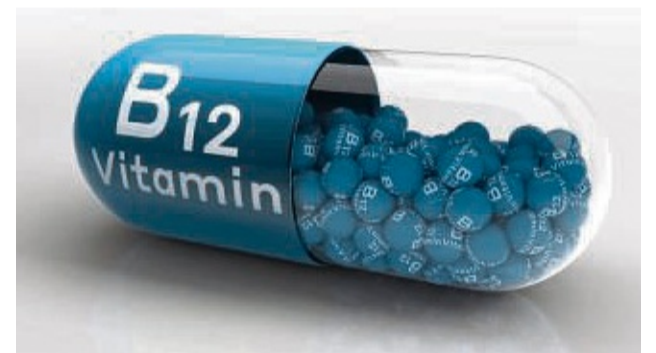
Durch einen B12-Mangel können auch neurologische Probleme entstehen.