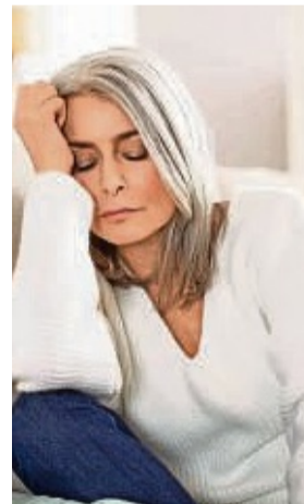
Vitamin-B12-Mangel kann dazu führen, dass man sich ständig schlapp fühlt.