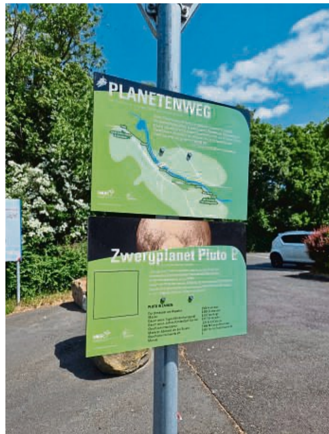
Der Planetenweg endet mit dem Zwergplaneten Pluto am Parkplatz der „großen JGS“.

schaftsführer der MER. „Wir möchten uns bei der damaligen Klasse F5b für ihre beeindruckende Arbeit bedanken. Sie haben den Weg für diese interstellare Reise auf Erden bereitet.“