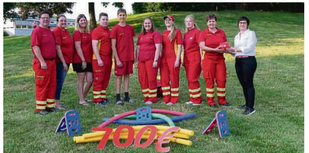
Spendenübergabe bei der Saisonöffnung der DLRG Wildeck.