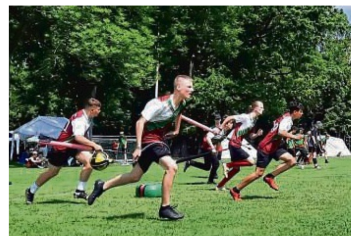
Das Jugendteam „Jugg Warrior“ fuhr bei den Deutschen Meisterschaften in Jena die Vizemeisterschaft ein.