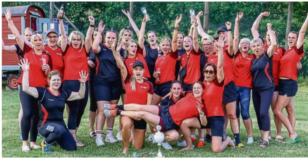
So sehen Serien-Kreismeister aus: Die Rockensüßer Brennballhörnchen sicherten sich erneut den Titel.

Die Titelverteidiger von der ersten Mannschaft der Brennballhörnchen eilten bereits in der Hinrunde davon und blieben das Turnier über ungeschlagen. Bereits vor dem finalen Rückrundenspiel war ihnen der Titel nicht mehr zu nehmen. Der neue vom Landkreis gestiftete Kreismeisterpokal darf damit gleich im Cornberger Ortsteil bleiben – überreicht wurde er dem Team, das sich selbst mit ei-