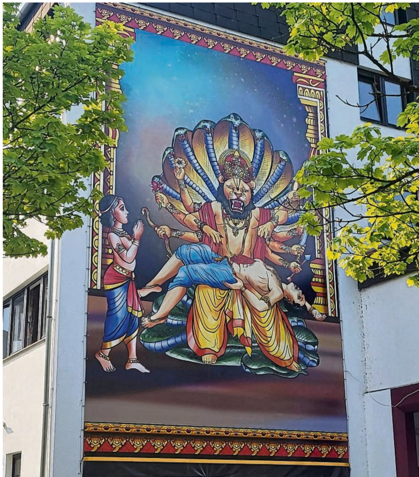
Zerstörung eines Dämons: In Kirchheim gibt es Unmut über ein neues Bild der Bhakti-Ashram-Gemeinde.

„Wir sollten nicht beurteilen und herabgewürdigt werden, nur weil wir das abrahamitische Religionsmodell nicht