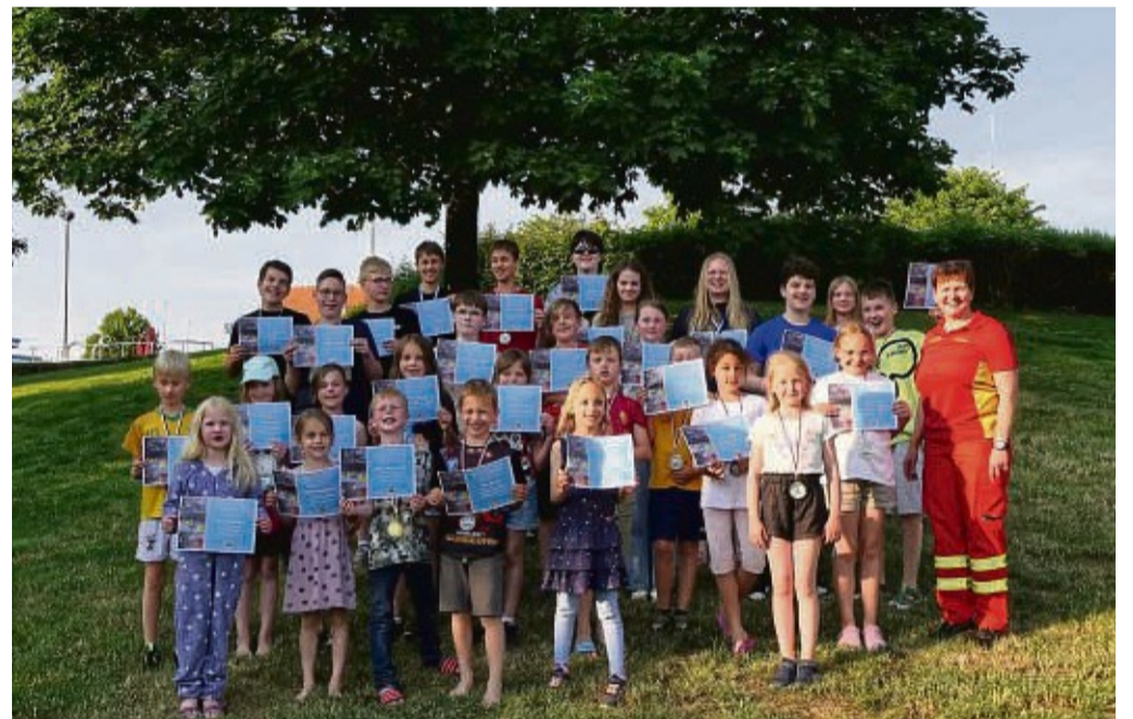
Siegerehrung des Wettschwimmens der Kinder und Jugendlichen.

Obersuhl – Im Rahmen der Eröffnung der Freibadsaison in Wildeck hat die DLRG-Ortsgruppe Wildeck die Urkunden und Medaillen vom Vereinsschwimmen 2023 an die Kinder und Jugendlichen ver-