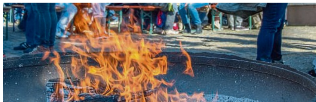
Beim nächsten Kartoffelbraten in Goddelsheim steht der Dialekt im Mittelpunkt des Programms. Aber auch Lukullisches rund um die Erdknolle wird es wie gehabt wieder geben.