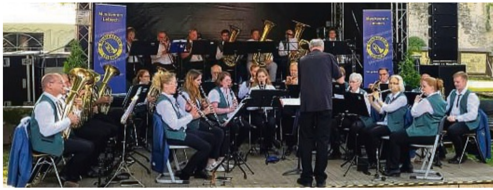
Der Musikverein Lelbach beim Auftritt beim diesjährigen Altstadt- und Kulturfest im Hof der Musikschule.