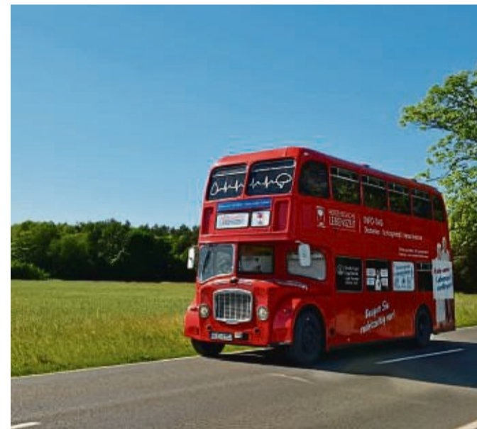
Experten stehen am original Londoner Doppeldeckerbus in Bad Wildungen für Fragen rund ums Thema Diabetes und Herz-Kreislauf-Erkrankungen zur Verfügung.

Bad Wildungen. Gesundheitsrisiken kennen, Symptome deuten, schnell reagieren - Aufklärung kann Leben retten. Die Asklepios Kliniken Bad Wildungen engagieren sich aktiv für die Kampagne „Herzessache Lebenszeit“. Am Donnerstag, 20. Juli 2023, von 10.30 bis 16 Uhr stehen Ihnen Experten am original Londoner Doppeldeckerbus vor der Stadtklinik in Bad Wildungen für Fragen rund um die Themen Diabetes, Schlaganfall und Herz-Kreislauf-Erkrankungen zur Verfügung.