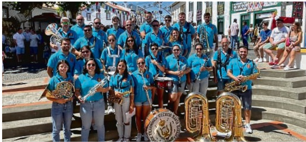
Sind zum ersten Mal beim internationalen Jugendmusikfestival dabei: Filarmónica Recreio de Santa Bárbara aus Terceira Island (Azoren).

Von der CRS dabei ist auch der Ukrainische Flüchtlingschor mit einzigartigen, ihrer kulturellen Herkunft gewidmeten Liedern. Ein Vorstellungskonzert im Bürgerhaus gibt es am Montag, 10. Juli, Beginn ist um 19 Uhr. Dort sind alle genannten Gruppen vertreten. Der Eintritt kostet zwölf Euro, für Kinder und