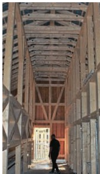
Solide Holzkonstruktion: Blick ins Innere des neuen Wisent- und Wildpferdestalls.

„Wenn der Stall fertig ist, fangen wir an, die Wisente zu trainieren“, erklärte Tobias Rönitz. Die Tiere müssen freiwillig die Zugänge und schließlich den Zwangsstand