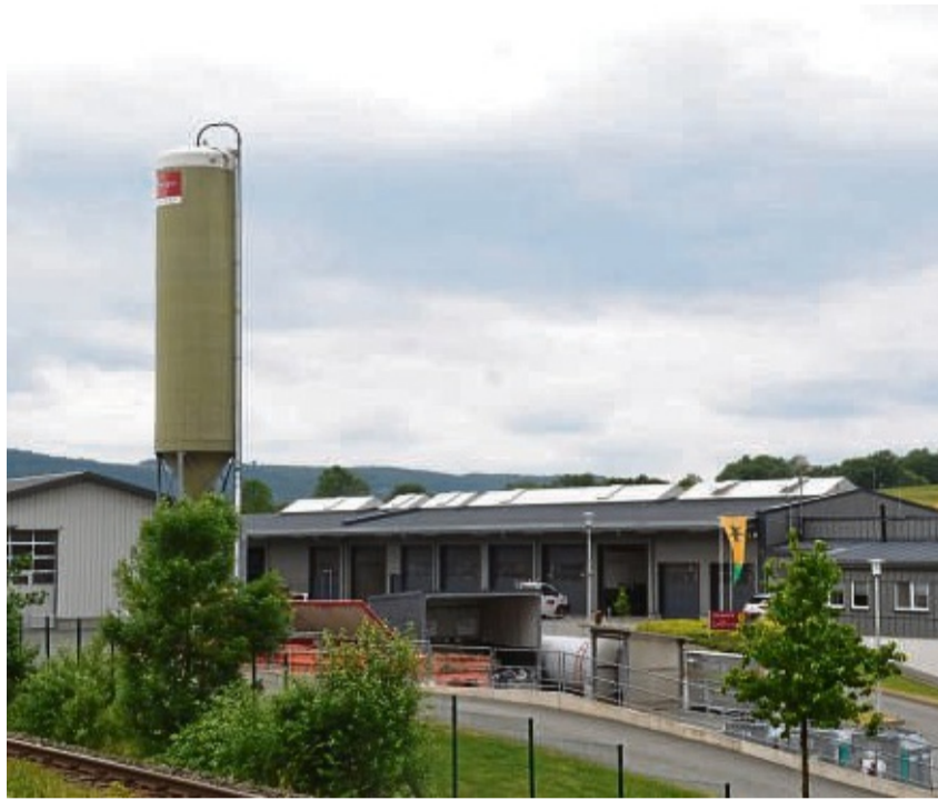
Photovoltaikanlagen sollen auf das Lagunenbad kommen, auch auf dem Usselner Klärwerk werden sie installiert. Für den Bauhof wird die Installation geprüft.

In Zusammenarbeit mit der EWF soll eine interkommunale Wärmeplanung entstehen. Solche Pläne sind nur für Kommunen ab 20 000 Einwohnern verpflichtend,