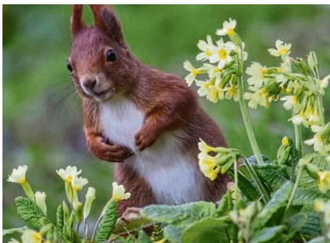
Ein Eichhörnchen sucht Nahrung zwischen Schlüsselblumen, wie die Wiesen-Primel auch genannt wird.

Damit Ihr Blumenbeet zum Insektenbuffet wird, empfiehlt der Hessische Bund für Umwelt und Naturschutz Deutschland (BUND Hessen) Wildstauden für sonnige