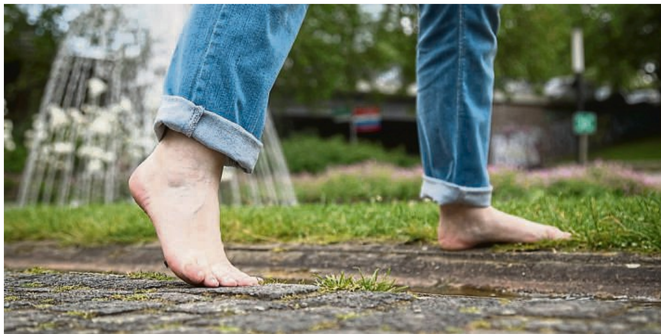
Geht es um Fersenschmerzen, können viele aus eigener Erfahrung mitreden.