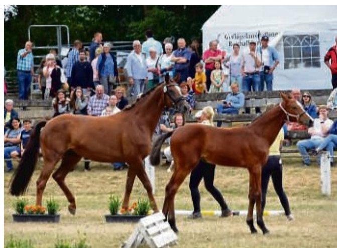
Traditionell: Die große Kreis- und Bezirkstierschau ist immer einen Besuch wert.

11 bis 12 Uhr: Happy Hour an allen Fahrgeschäften ab ca. 15 Uhr: Hubschrauberrundflüge (Start: Freizeitparkgelände) ab 19 Uhr: XXL Abschluss-Party mit DJ Moe im Festzelt 22.30 Uhr: Drohnen-Licht Show