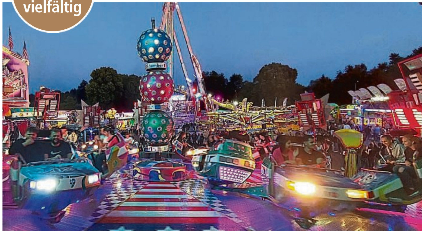
Gute Stimmung garantiert: Auf dem Fritzlärer Pferdemarkt warten Fahrgeschäfte, Live-Musik und Gaumenfreuden auf die zahlreichen Besucher.