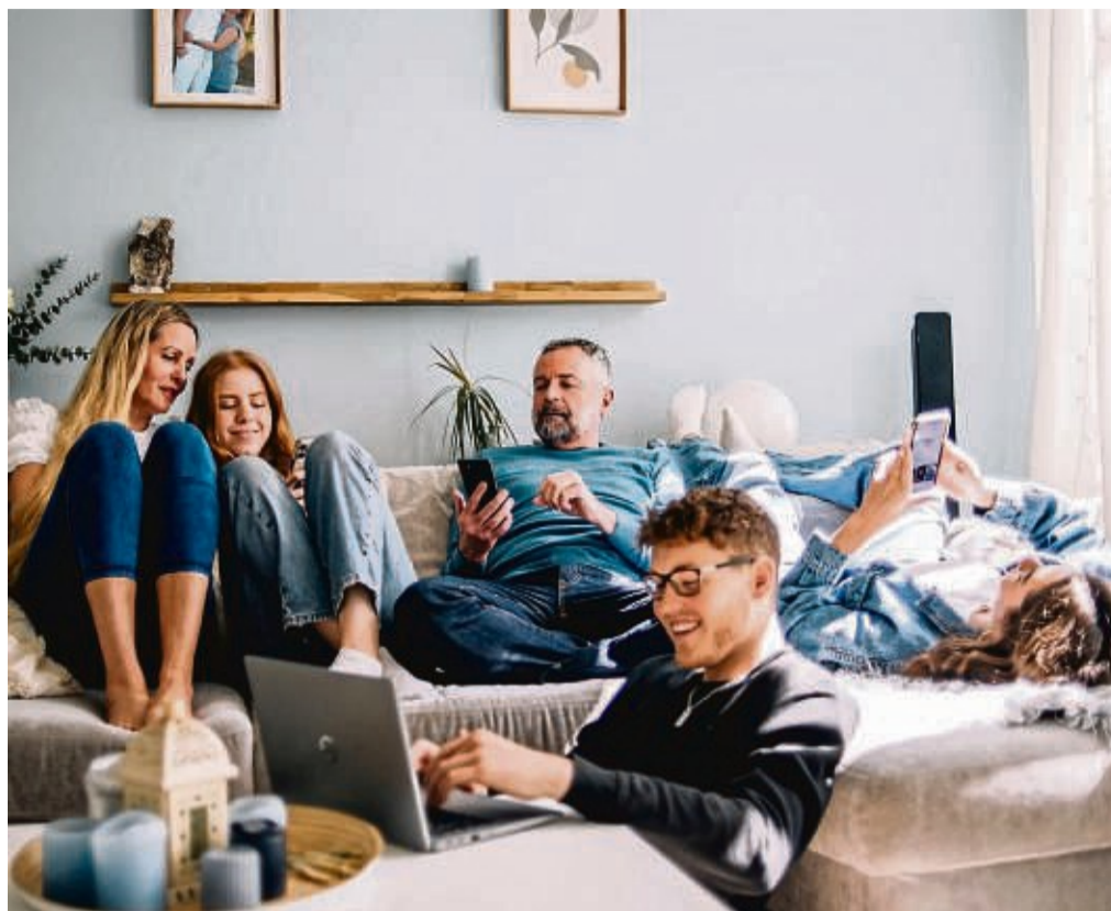
Zusammenwohnen ist schön – und trotzdem nicht immer einfach. Das gilt auch für das gemeinsame Einrichten.

So wirken Vorhänge, Teppiche und natürliche Oberflächen aus Holz wohnlich, ebenso mehrere Lichtquellen im Raum. Die Möbel stehen am besten locker und nicht