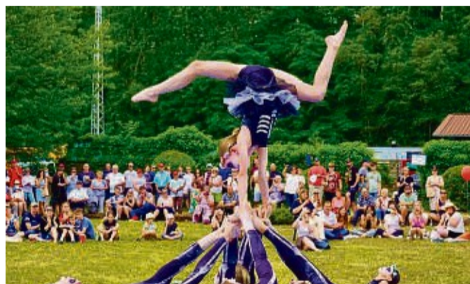
Balanceakt: Die Sportkrobinnen des SVH Kassel.

Im vergangenen Jahr hatte die Gewerkschaft das Sommerfest im Themenpark in Borken zum ersten Mal ausgerichtet, aufgrund des großen Andrangs kam es in diesem Jahr zu einer Neuauflage in Borken.