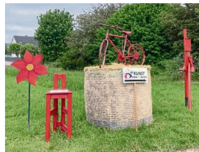
Rot soll es in Trendenburg werden.

Infos und Kontaktdaten auf der homepage trendelburger-kunstinitiative