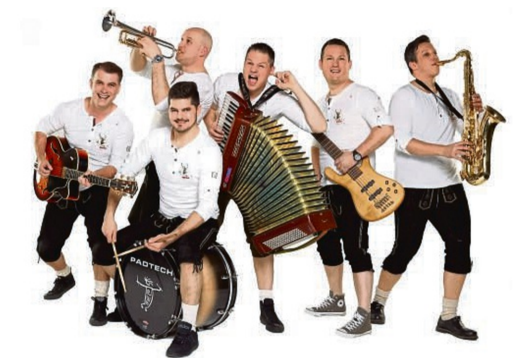
Donau Power: Die Band spielt am Sonntag, 16. Juli, ab 18 Uhr im Festzelt.

Der Kirmes-Montag, 17. Juli, startet am frühen Vormittag um 8.30 Uhr mit dem traditionellen Ständchen-