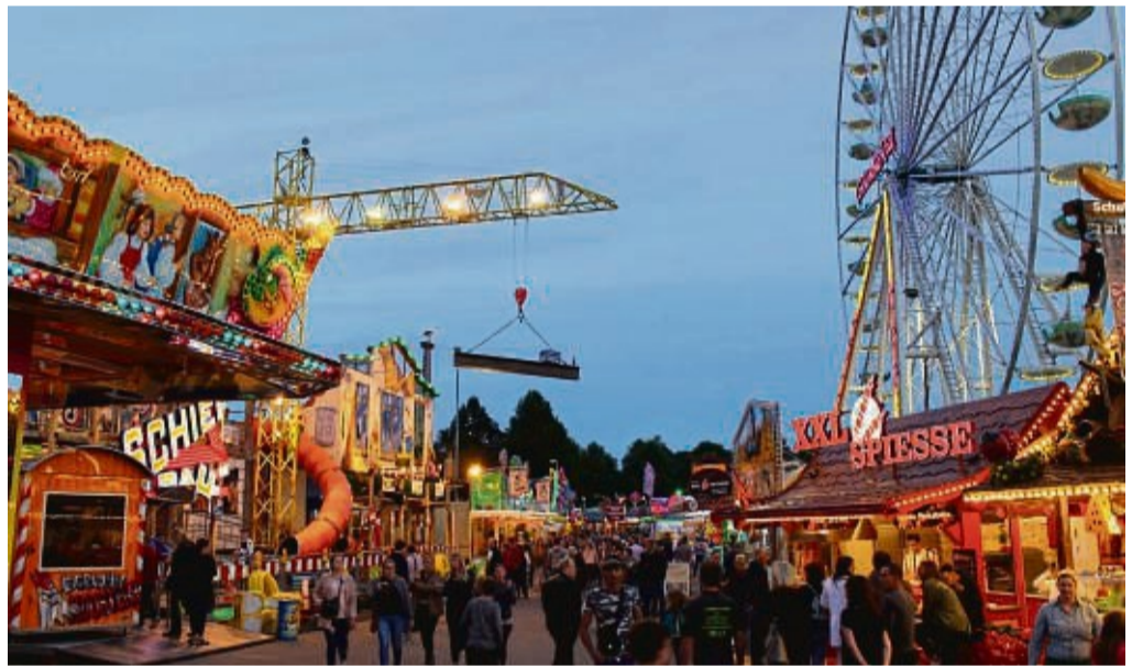
Buntes Treiben auf dem Festplatz: Die Fahrgeschäfte sind eine Attraktion für die ganze Familie – viele versprechen einen tollen Ausblick.

Die Achterbahn „Coco Beach“ von Anton Kaiser wird mit sieben Gondeln mit je vier Sitzplätzen befahren. Die Familienachterbahn ist so beschaffen, dass ganz im karibischen Stil, Papageien, Palmen