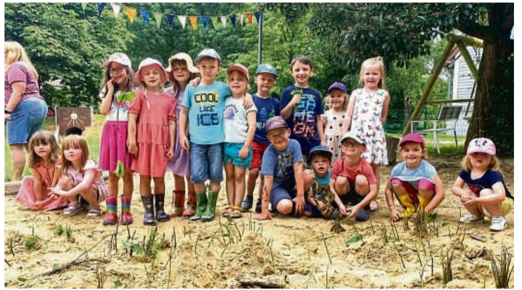
Auch die Sandförmchen sonnen sich auf Mallorca: Die Kinder des Kindergartens „Arche Noah“ bauen Wälder und Vulkane aus Gras in den Sandkästen.

In den kommenden zwei Wochen werden die Spielsachen nach und nach wieder aus dem Urlaub kommen.