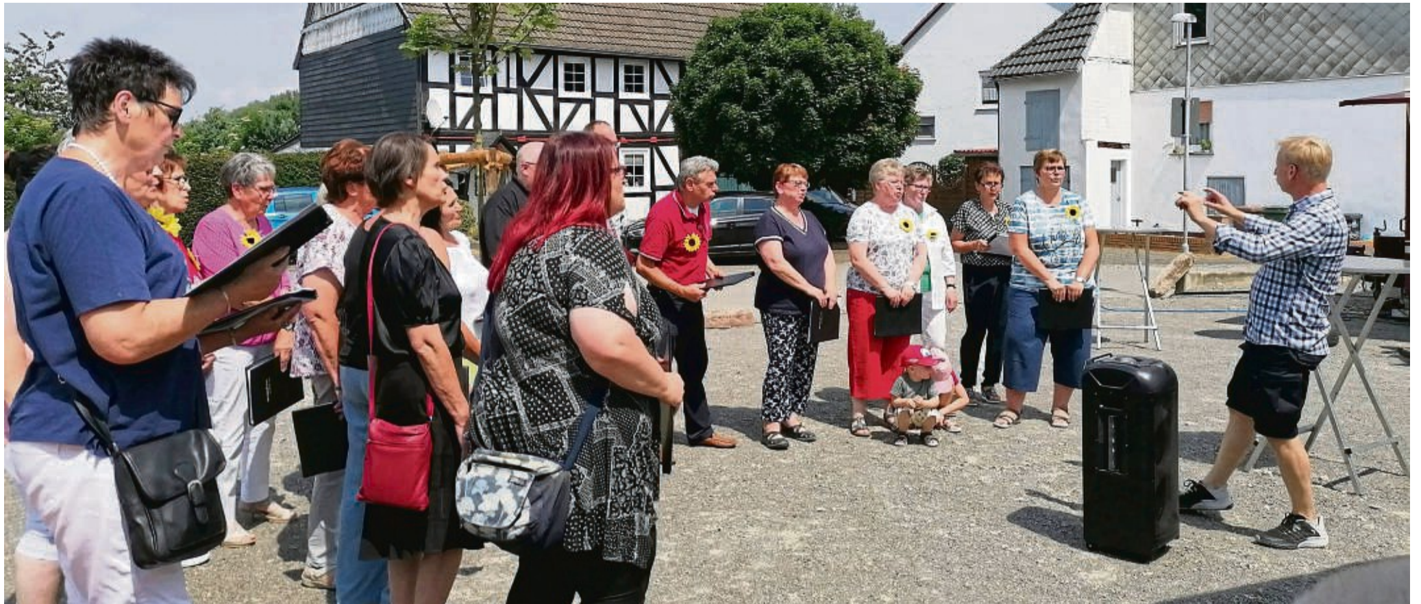
Mit Gesangseinlagen wurde die Neugestaltung des Dorfplatzes in Obermeiser gefeiert.