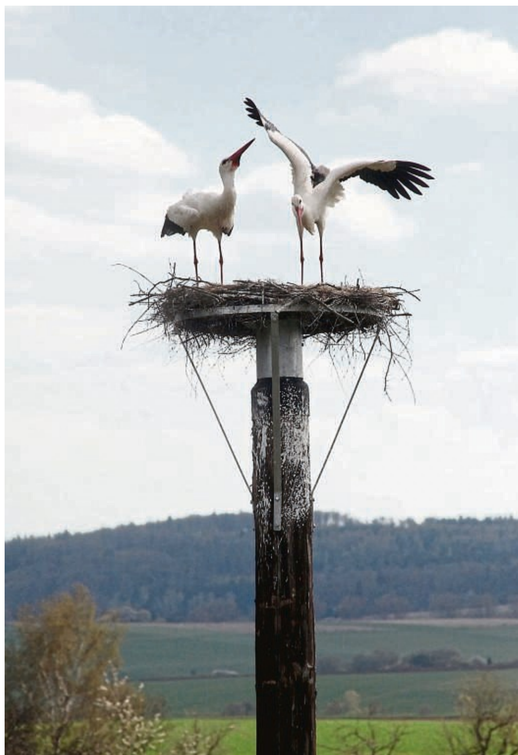
Noch relativ unerfahren: Das junge Storchenpaar ist seit zwei Jahren in Naumburg heimisch. Einen Bruterfolg gab es bislang noch nicht.