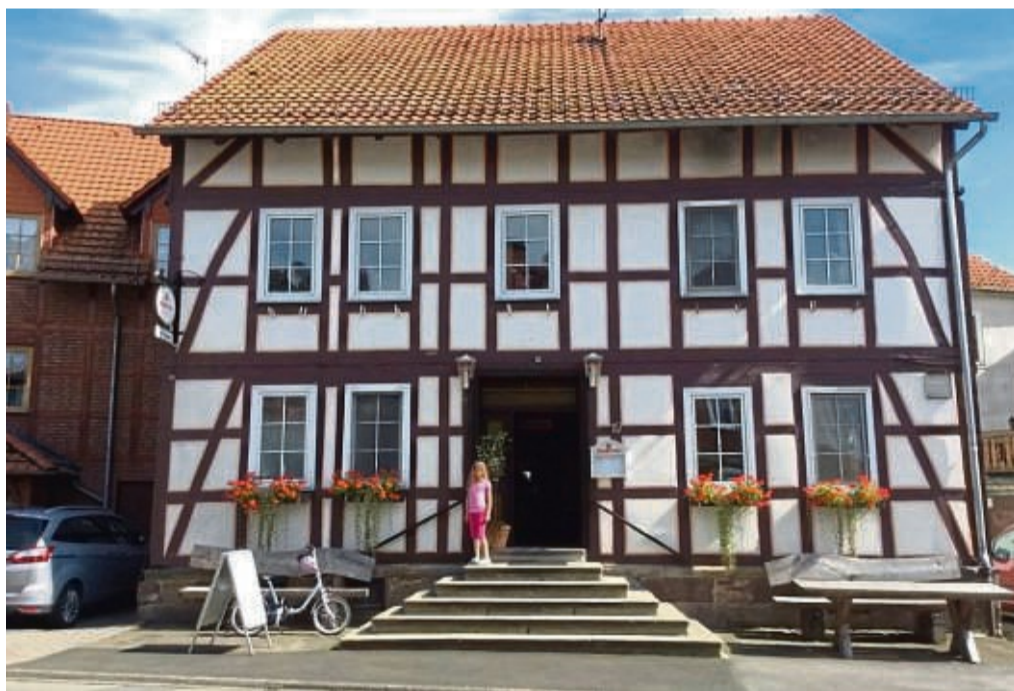
Das Gasthaus Kloppe lädt am 8. und 9. Juli zur Jubiläumsfeier ein.