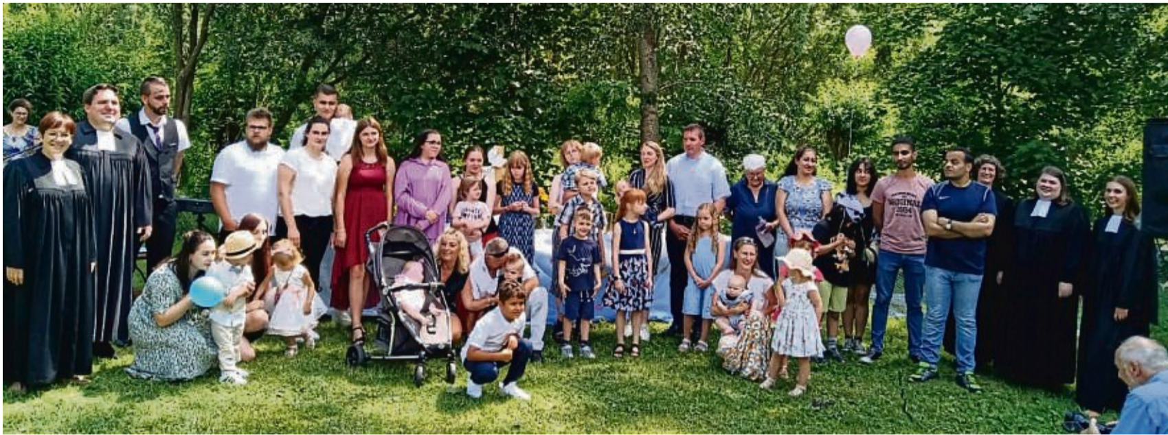
Eine große fröhliche Runde: Die Pfarrerrinnen und der Pfarrer mit ihren Täuflingen beim Tauffest im Grünen.