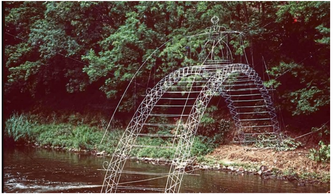
Die „Alte Brücke“: Der international renommierte Konzeptkünstler Ilya Kabakov hat dieses filigrane „Traumgebilde“ einer Brücke 1998, vor 25 Jahren, für Hann. Münden geschaffen. Die Skulptur war Teil der Ausstellung „3 Räume – 3 Flüsse“ zur Expo 2000.