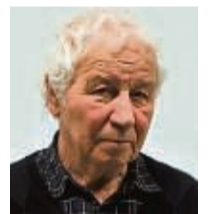
Ilya Kabakov Künstler (im Jahr 2012)

schufen bis zur Expo im Jahr 2000 Kunstwerke an den Ufern von Fulda, Werra und Weser. Zudem gab es eine Begleitausstellung unter dem Titel „Ihr wart ins Wasser eingeschrieben“ im historischen Packhof.