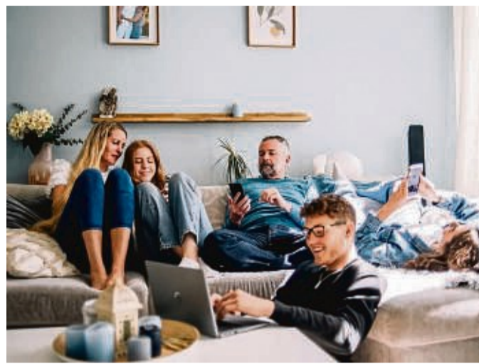
Zusammenwohnen ist schön – und trotzdem nicht immer einfach. Das gilt auch für das gemeinsame Einrichten.

Wenn genügend Platz vorhanden ist, empfiehlt sie, einen Tisch mit Blumen oder Kerzen aufzustellen. „Einladende Düfte von Kerzen können die Atmosphäre eines jeden Raumes verändern und ihm mehr Behaglichkeit ver-