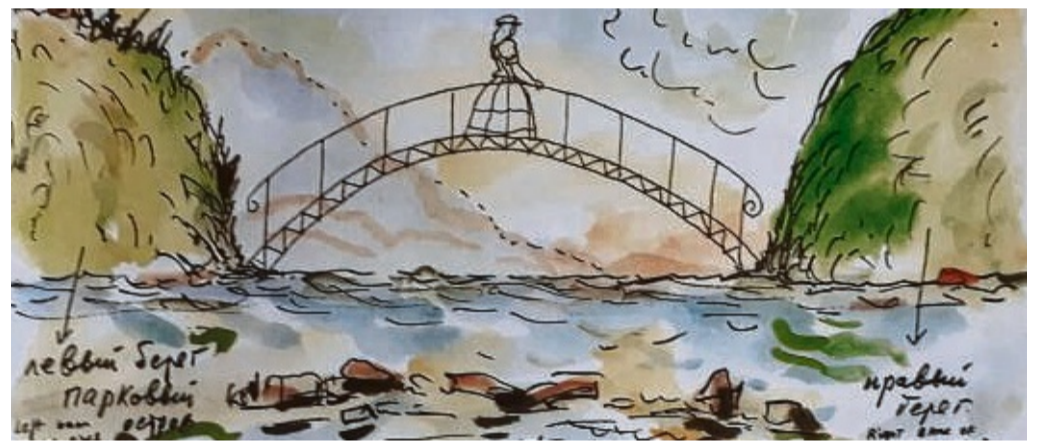
Die Zeichnung zur Installation: Biedermeierlich wie die verschnörkelte Brücke wirkt auch die Frauenfigur.

Die Stadt hatte den belgischen Museumsdirektor und Ausstellungskurator Jan Hoet, der 1992 die documenta in Kassel geleitet hatte, für das Projekt gewinnen können. 18 international tätige Künstler