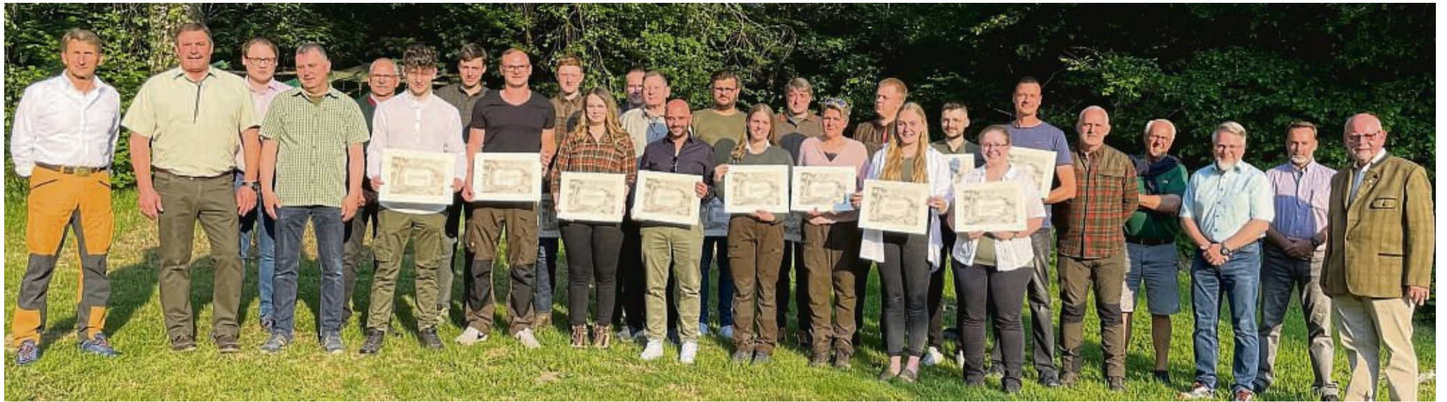
Die 19 Jungjäger, die Ausbilder und der Vorstand sind stolz auf die guten Ergebnisse.