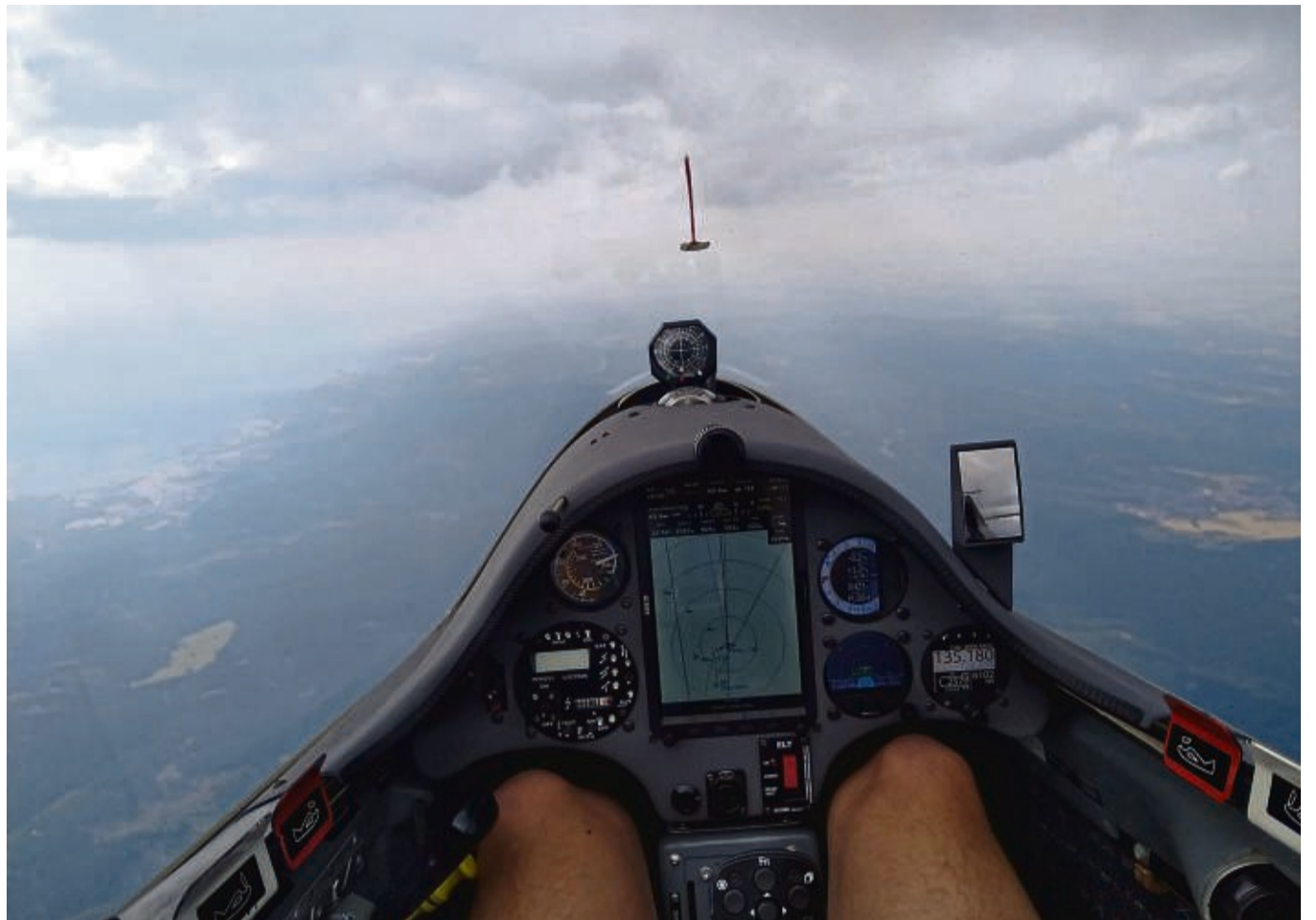
Thermik und Technik müssen für den 1000-Kilometer-Flug stimmen. Zwischendurch kann der Pilot aber auch mal Abschalten.

Gut vorbereitet ist der Pilot und weiß durch lange Übung, wie lange er seine Konzentration aufrechterhalten kann. Wichtig vor allem, dass die Technik funktioniert und zu einhundert Prozent Verlass