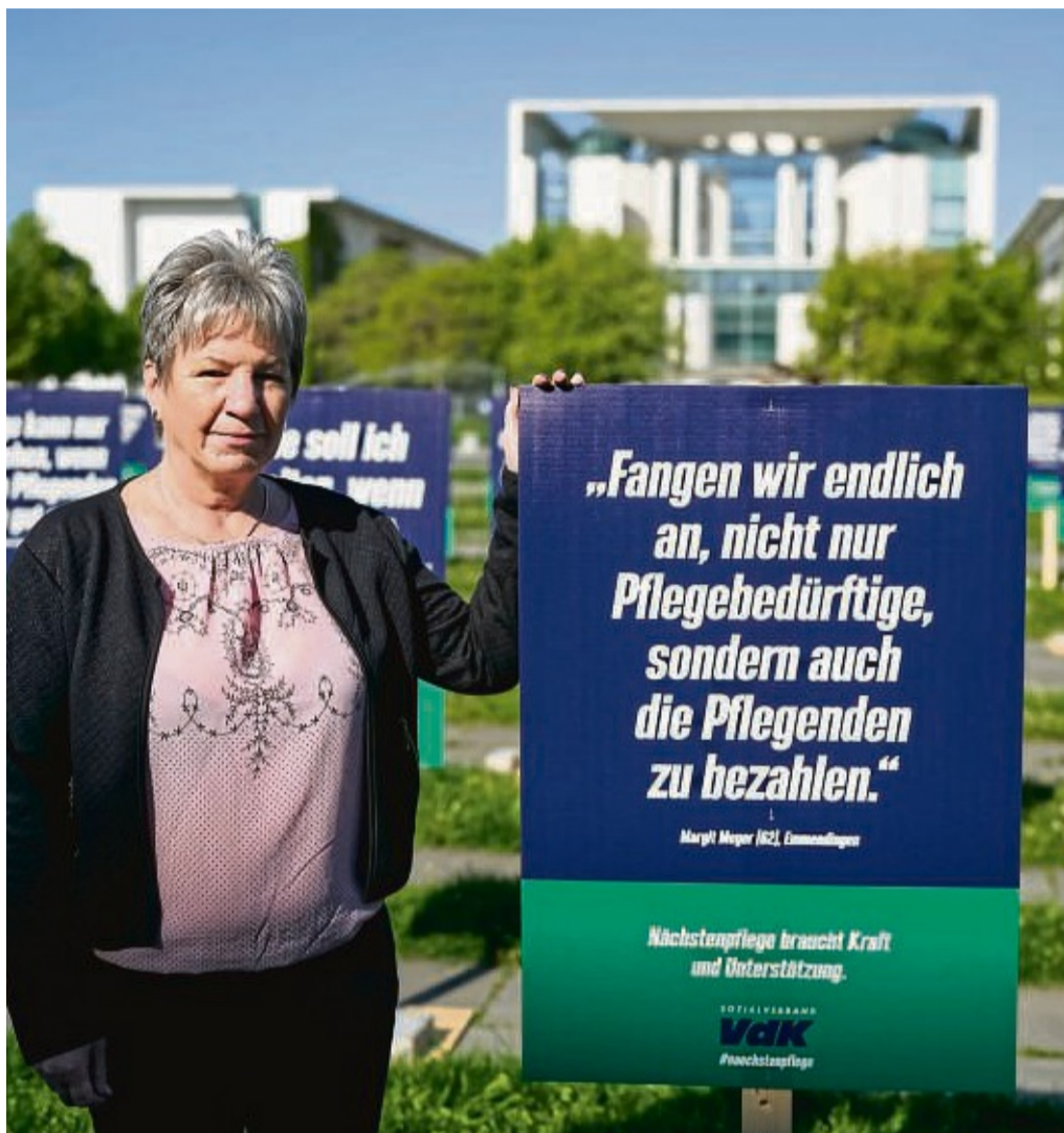
Aktion #nächstenpflege: Der VdK Kreisverband Eschwege nimmt an der bundesweiten Aktion teil, die auf die Situation von pflegende Angehöriger aufmerksam machen soll.

Um auf die große Leistung ebenso wie auf die enorme Belastung von pflegenden Angehörigen aufmerksam zu machen, veranstaltet der Sozialverband VdK seit 2022 eine bundesweite Kampagne mit vielen Aktionen in allen Landesteilen. Schon deren Titel ist ungewöhnlich: Das Wort „Nächstenpflege“ soll die intensive Beziehung zwischen Pflegebedürftigem und Pflegenden verdeutlichen. Den Auftakt zur Kampagne bildete Anfang Mai eine Pressekonzferenz in Berlin, bei der die Ergebnisse einer vom VdK beauftragten Pflegestudie mit 56.000 Teilnehmenden vorgestellt wurden. Aus den Angaben, die die Befragten zu ihrem Pflegealltag gemacht haben, zeichnet sich ein klares Bild ab: Pflegende brauchen mehr und bessere Unterstützung. Wie diese Unterstützung aussehen soll, dazu hat der VdK klare Vorstellungen. „Wir fordern, dass Berufstätige sich für die Pfle-