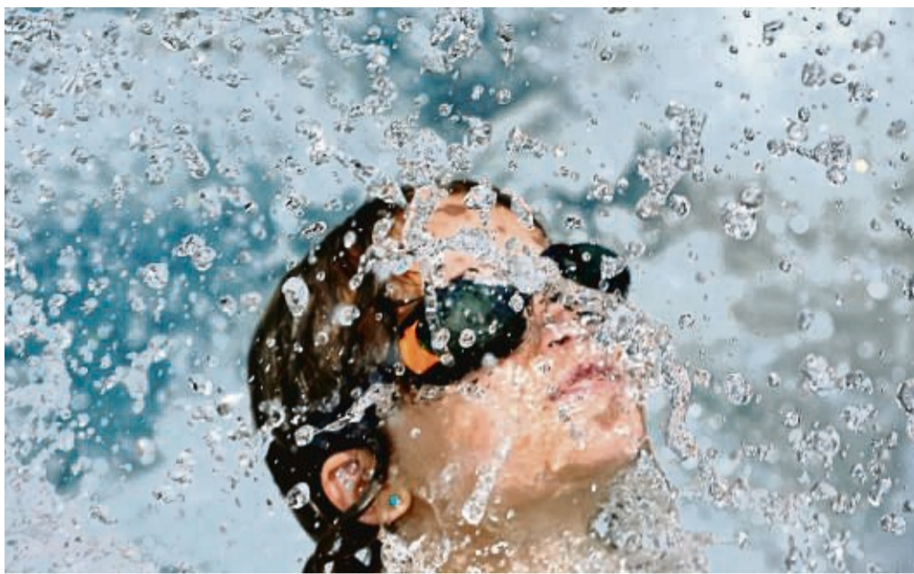
Wie gut kann das Kind schwimmen? Kennt es die Gefahren? Diese Fragen helfen dabei, herauszufinden, ob das Kind fit für seinen ersten Freibadbesuch ohne Eltern ist.