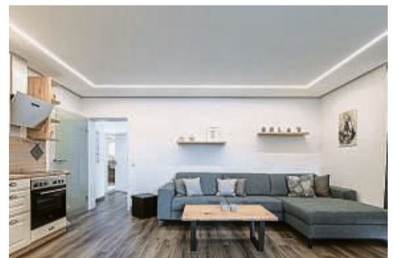
unabhängig heizen mit Infrarot Heizung unter der Decke

Was lässt sich alternativ und unabhängig zu Gas- oder Ölheizun-