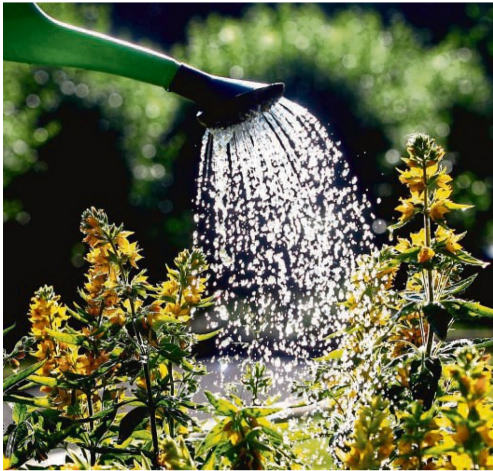
Pflanzen brauchen keine Dusche. Es ist besser für sie, wenn das Gießwasser direkt an die Erde über ihre Wurzeln gegeben wird.

Manche Pflanzen, insbesondere jene im Topf, brau-