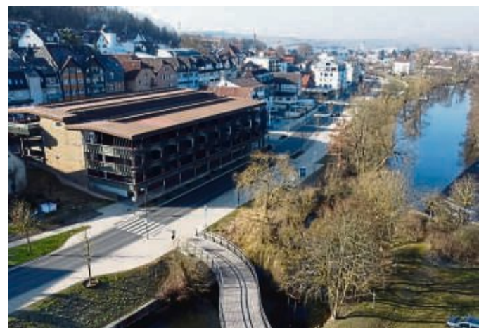
Die Tages des Parkhauses an der Uferstraße in Frankenberg sind gezählt. Die Stadt wird den Bau einreißen lassen um, mehr Platz für die Studierenden und die Technische Hochschule Mittelhessen zu schaffen.

Die Bauzeit für das Großprojekt sei mit rund zwei Jahren geplant, teilte der Landkreis mit, sodass mit einer Fertigstellung des Gebäudes nach jetzigem Planungsstand etwa im Spätsommer 2026 zu rechnen ist. Laut der aktuellen Planung könnte der Hochschulbetrieb am neuen Standort dann im Herbst 2026 starten. Entstehen soll ein dreigeschossiges Gebäude in dem auf zwei Ebenen der Studien- und Verwaltungsbetrieb stattfinden soll. Die dritte Ebene steht dem Betreiber des Gebäudes zur freien Nutzung zur Verfügung. Eine Idee wäre es, hier beispielsweise Mikroappartements für Studierende zu schaffen, heißt es vom Landkreis. jpa