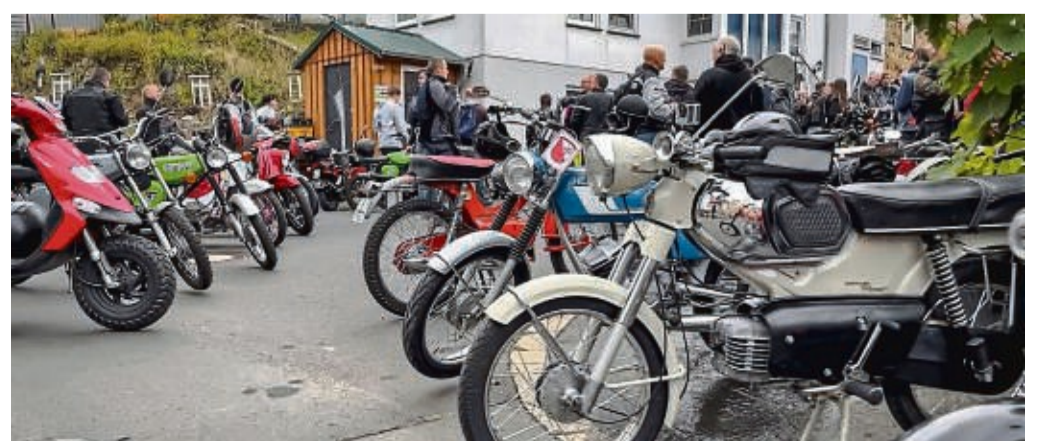
Beim Hochland-Moped-Marathon sind viel ältere Maschinen am Start. Hier ein Bild von der Tour 2022.