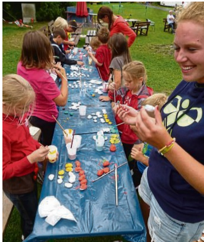
Acht Wochen Ferienspaß: Zahlreiche Aktionen für Kinder laden rund um den Edersee zum Mitmachen ein.

wegs unter www.kunterwegs.de oder im Flyer „Ferienspaß am Edersee“ unter der Adresse www.ederssee.com/prospekt .