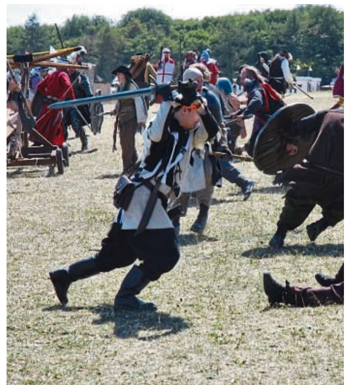
Schlachtszene beim Drachenfest: Die mit harmlosen Gummis- waffen geführten Auseinandersetzungen gehören auch zu dem großen Live-Rollenspiel auf dem Quast in Diemel- stadt.