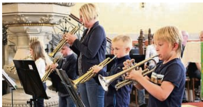
Der Nachwuchs: Vier Kleine und eine Große bilden die jüngste Bläsergruppe des Posaunenchor Balhorn und hatten ihren ersten öffentlichen Auftritt beim Konzert in der Kirche.

Die Zuschauer genossen offensichtlich den Abend und