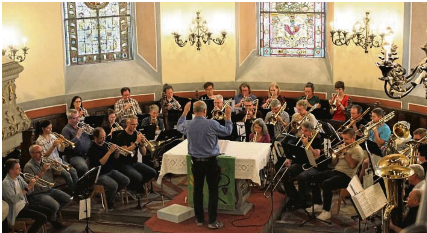
Gemeinsame Sache in der Kirche: Mitglieder aus den Posaunenchor der Selk und der Landeskirche erfreuten das Publikum während des gemeinsamen Konzerts mit Melodien von der Volksmusik bis zum Swing.

Mit 20 verschiedenen Musikstücken von Volksweisen über Oper, Schlager, Popsongs und Swing begeisterte der gemeinsame Posaunenchor das Publikum. So folgten auf die bekannte Filmmelodie zu Pippi Langstrumpf ein Wiener Walzer und der Triumphmarsch aus „Aida“,