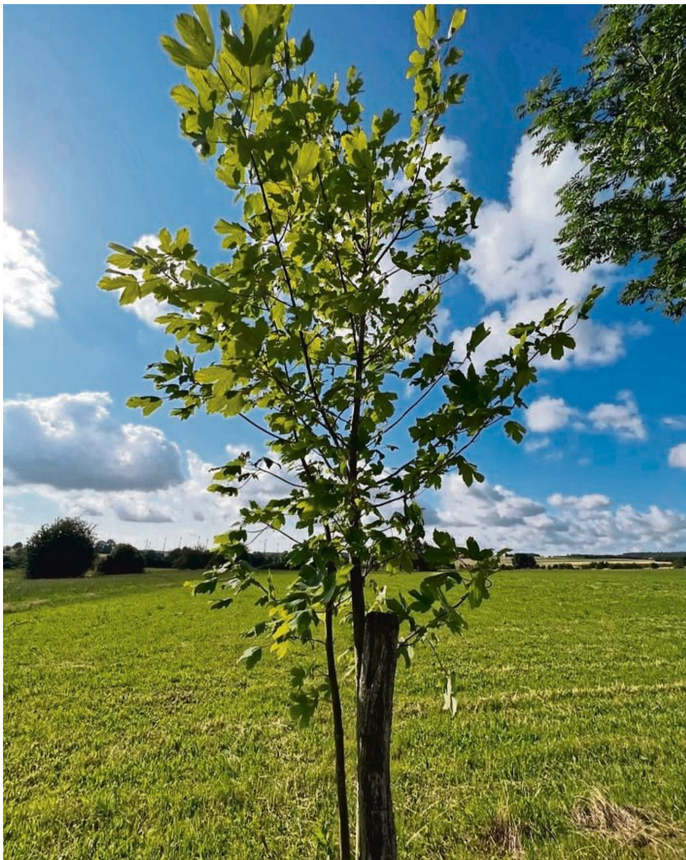
Der Bergahorn, hier bei Wolfhagen, kann für Pferde auf der Weide zur tödlichen Gefahr werden.

Die Krankheit, die sogenannte „atypische Weidemypopathie“ hat folgende Symptome: Zittern und Schwitzen, steifer Gang auch ohne Reitbeanspruchung, kolikartige Schmerzen, Atembeschwerden und eine erhöhte Herzfrequenz. Außerdem verfärbt sich der Urin. Die rotbraune Verfärbung