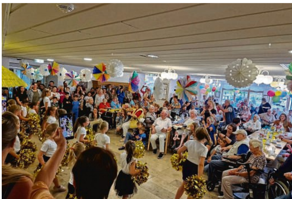
Begeisterten ihr Publikum: Die Cheerleader des VfL Wolfhagen absolvierten beim Sommerfest im Seniorenzentrum Wolfhagen einen mitreißenden Auftritt.