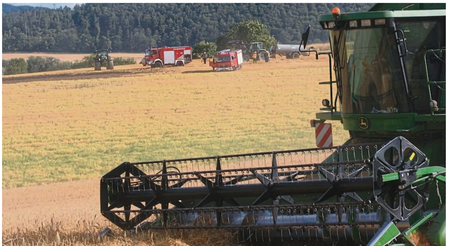
Kaum war die Gefahr durch das Feuer auf dem Stoppelfeld gebannt, nahm der Mährescher bei Reinhardshausen Mittwochabend die Arbeit wieder auf. Die Zeit drängt angesichts notreifen Getreides. Ereignisse wie dieses haben die Feuerwehren im Kreis derzeit beinahe täglich zu bewältigen.

Eine Herausforderung bei Flächenbränden liege beispielsweise darin, durch die passende Taktik sich selbst davor zu bewahren, vom Feu-