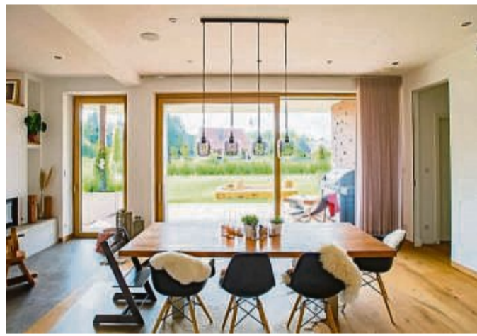
Holzfenster haben Konjunktur - im Neubau wie bei der Sanierung.

Die Herstellung eines Holzrahmens ist deutlich weniger energieintensiv als die Herstellung von (recycelten) Profilen aus anderen Rahmenmaterialien. Werden heimische Hölzer verwendet, sind die Transportwege zu den regionalen Handwerksbetrieben meist kurz. Zur hervorragenden Ökobilanz von Holz-