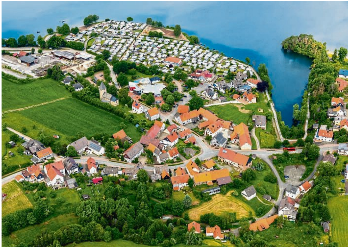
Autofahrer sollen zahlen: Auf den öffentlichen Parkplätzen am Diemelsee sind künftig Gebühren fällig. Auch die Stellplätze am Heringhäuser Haus des Gastes fallen darunter. Die Firma Avantpark stellte ihre Technik vor.