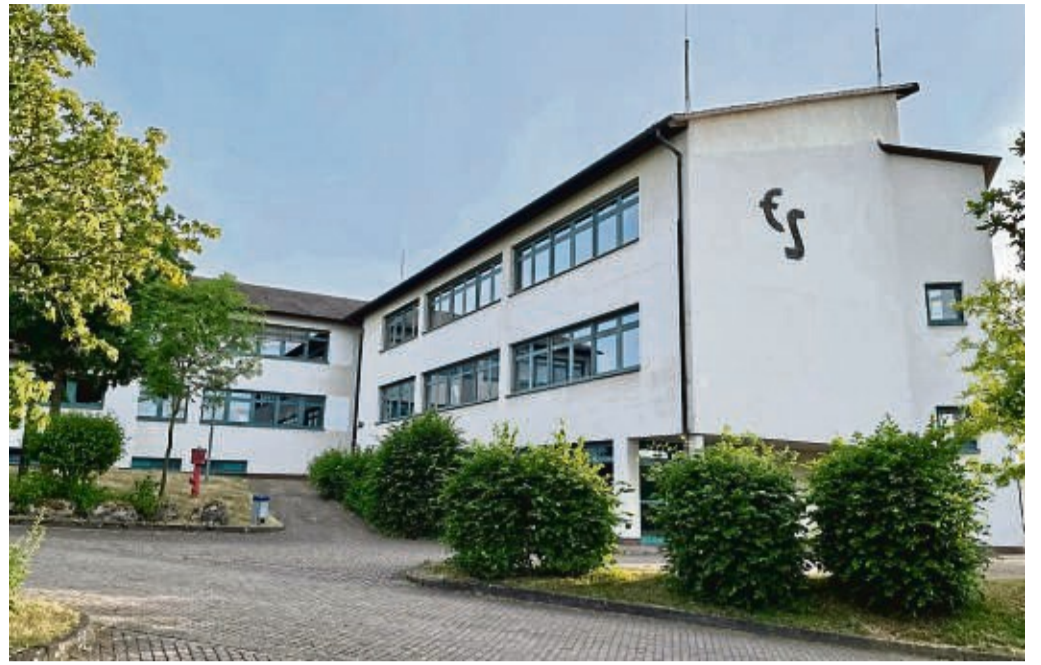
Ense-Schule in Bad Wildungen: Übergangsweise soll dort die Mathias-Bauer-Schule ange-dockt werden bis ein bedarfsgerechter Standort für die Förderschule geschaffen werden. Danach soll die Hans-Viessmann-Schule an der Ense mit einziehen.

„Die Planung des neuen Standortes für die Hans-Viess-