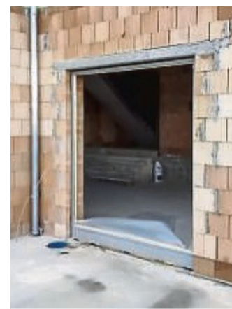
Dank der Montagezarge werden Baustellenschäden vermieden und das Fenster in der trockenen Bauphase eingebaut.