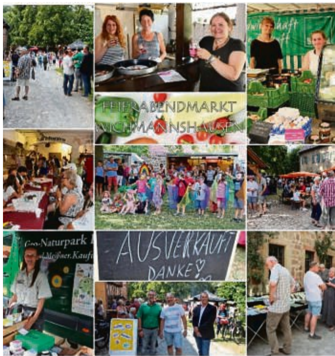
Gute Laune: Bei bestem Wetter fand der Feierabendmarkt großen Anklang.

Auch die köstlichen Kuchen der Walking-Gruppe