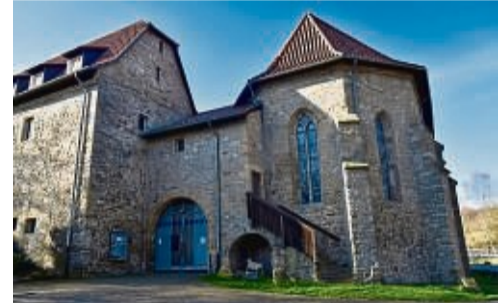
Welt des Musicals: Im Kloster Cornberg findet am 28. Juli ein besonderes Konzert statt.

nalen Bühnen mitgewirkt. Tauchen Sie ein in die Musical Welt der Extraklasse und lassen sich diesen musikalischen Leckerbissen nicht entgehen. Der Eintritt beträgt 25 Euro. Der Vorverkauf hat begonnen. Info und Kartenvorbestellungen unter: www.kulturverein-kloster-cornberg.de , E-Mail: info@kulturverein-kloster-cornberg.de , Tel. 0 56 50/9 21 89 90 (Panitz-Itter) und Musikhaus Döpfer, 36251 Bad Hersfeld, Am Brink 9, Tel. 066 21/2472. red