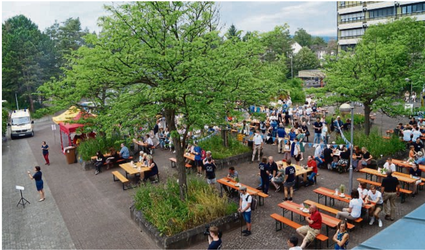
Schulfest mit buntem Markttreiben: Viele Besucher kamen, um sich über ihre Schulzeit auszutauschen und sich über die Entwicklung der Schule zu informieren.