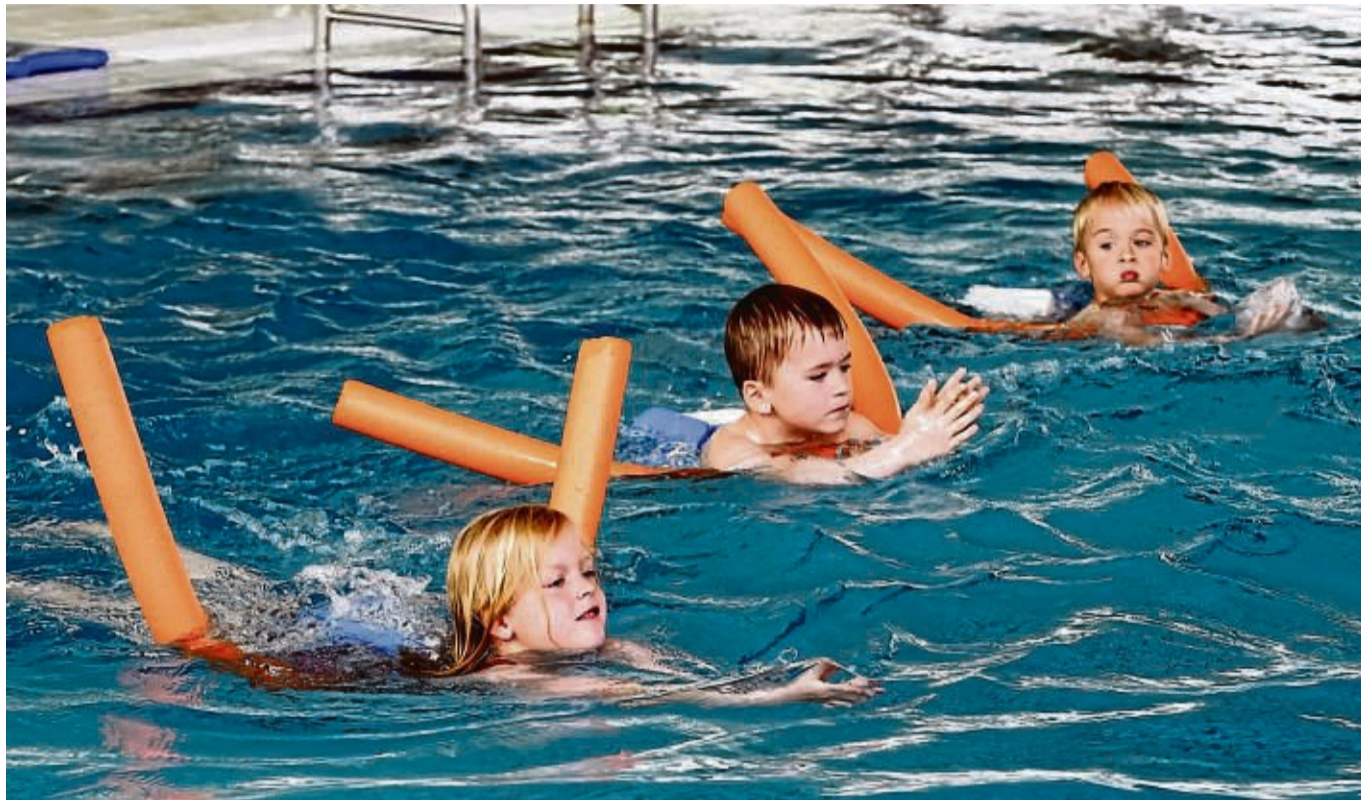
Schwimmen lernen ist das A und O: In den vergangenen Jahren haben zu wenig Kinder schwimmen gelernt.