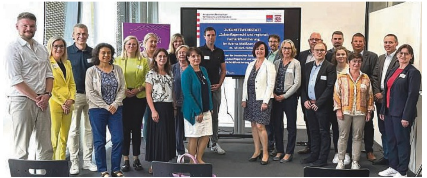
Haben gemeinsam Ideen entwickelt: Vertreter aus Bildung, Wirtschaft und Arbeitsvermittlung diskutierten während eines Workshops im Werra-Meißner-Lab.

Prognosen zeigen, dass schon bis zum Jahr 2028 knapp 3900 Fachkräfte mit Berufsabschluss und rund 600 akademisch Qualifizierte im Kreis fehlen werden und