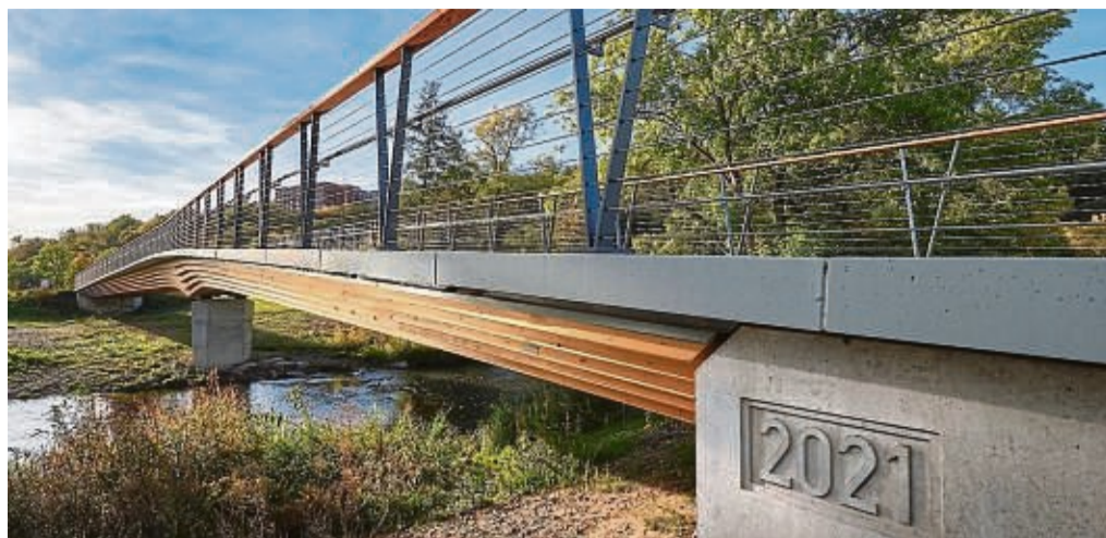
Die klimaneutrale Ederbrücke zwischen großer und kleiner Wehrweide in Frankenberg hat Vorbildcharakter über die Stadtgrenzen hinaus.

Auch im Wettbewerb „Gemeinsam aktiv. Mobil in ländlichen Räumen“ des Bundesinstituts für Bau-, Stadt- und Raumforschung sei die Brücke von einer Fachjury als eins der besten 20 Projekte ausgezeichnet worden. Und