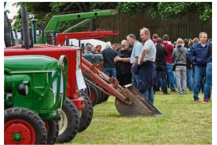
Das Feld-Ittlar-Fest mit dem Oldtimer-Treffen ist immer eine Fahrt oder Wanderung wert – viele historische Fahrzeuge gibt es zu bestaunen.

Am Sonntag, 23. Juli, beginnt das Fest um 10 Uhr mit einem Gottesdienst. Ab 11 Uhr werden abwechslungsreiche Kinderspiele und Aktionen geboten, außerdem gibt es Deftiges vom Grill. Ab 13 Uhr wird Kuchen und Kaffee angeboten, ab 13.30 Uhr