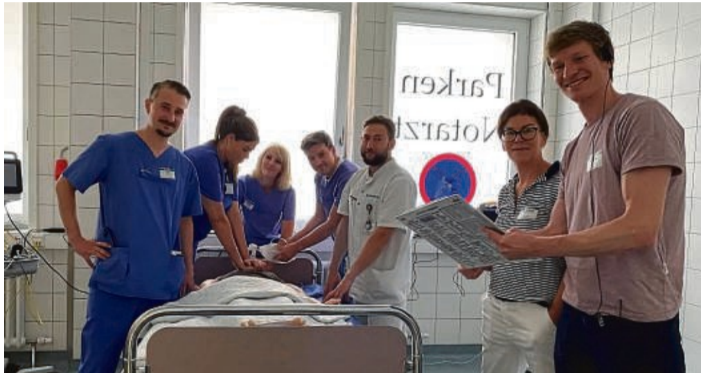
Das Ärzte- und Pflegeteam der Notaufnahme in der Asklepios Stadtklinik probte den Ernstfall.

Ärzte- und Pflegeteam der Zentralen Notaufnahme der Asklepios Stadtklinik trainiert Notfälle