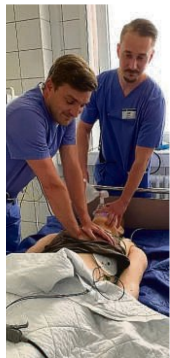
Übungspuppen sorgten für sehr realitätsnahe Notfallszenarien.

Bei den S.A.V.E. Teamtrainings steht die Zusammenarbeit der einzelnen Teams im Fokus. Trainiert wird daher bundesweit in allen Asklepios Notaufnahmen. Durch das intensive Training von Notfallszenarien in einem realen Setting sind die Teams in der Notaufnahme im realen Notfall bestmöglich aufgestellt.