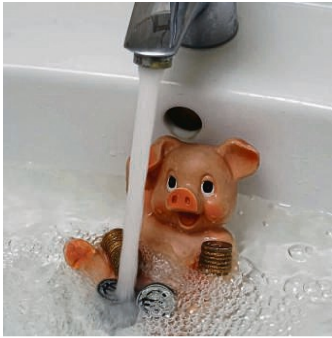
Eine Analyse zeigt, wo in Vöhl in den nächsten Jahren investiert werden muss, um die Wasserversorgung besser zu gewährleisten.