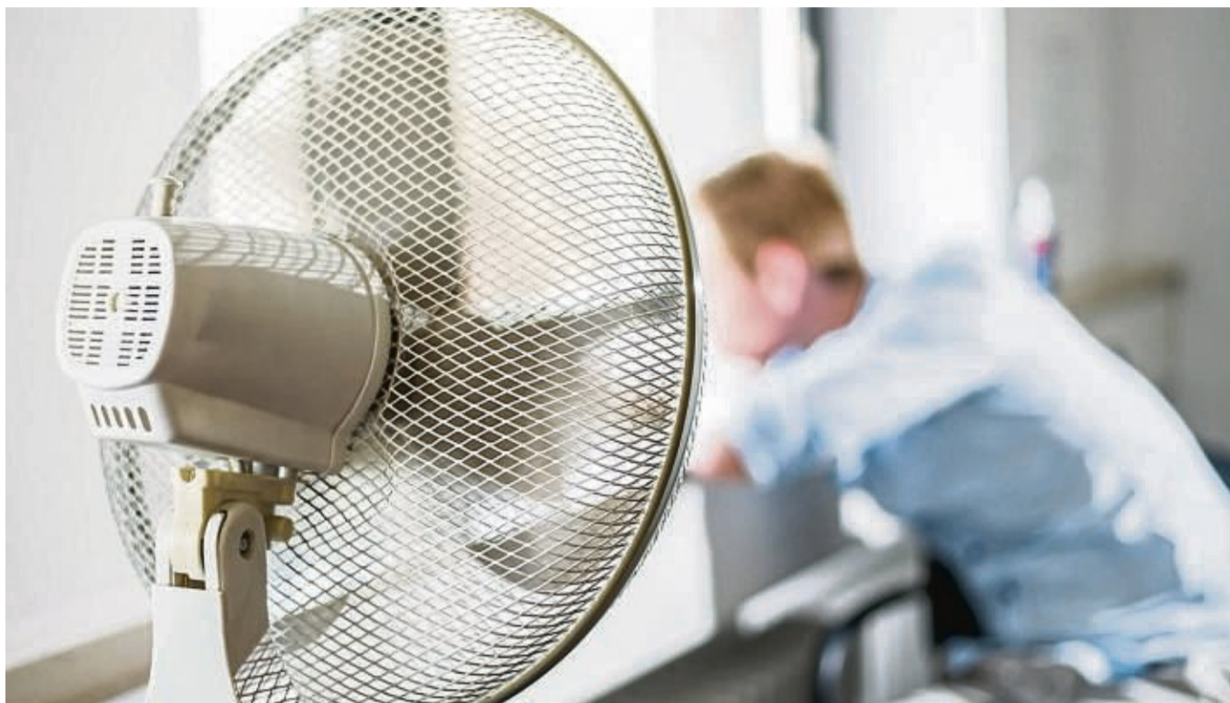
Ein Ventilator sollte mit etwas Abstand zum Körper kühlen können.

Das hängt von verschiedenen Faktoren ab. In der Regel ist es am besten, wenn der Ventilator kühlere Luft in den Raum einbringt. Zum Beispiel in den Morgenstunden, wenn es im Raum etwas heiß