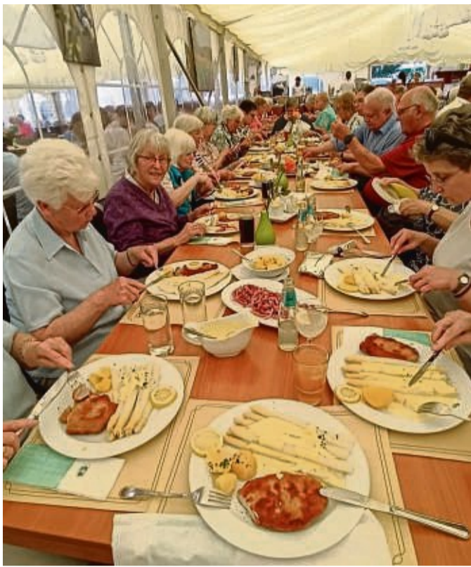
Ein leckeres Spargelgericht ließen sich die Mitglieder und Freunde des VdK Bad Wildungen schmecken.

Reinhardshausen - Der Dokumentarfilm „Die Eiche - Mein Zuhause“ spielt an einer circa 210 Jahre alten und 17 Meter hohen Stieleiche, die im Wald von Sologne (Frankreich) steht. Er begleitet den Baum und seine tierischen Bewohner während eines Kalenderjahres. Die Kameraperspektiven übernehmen im Film die Hauptrolle. Der Wechsel zwischen extremen Makroaufnahmen und Zeitraffer lässt hier besondere Perspektiven zu. Doch der eigentliche Star des Films ist die Tonspur. Geschickt wurden Geräusche verstärkt und der musikalische Soundtrack von Cyrill Aufort hinzugefügt. Beginn der Filmvorführung ist am Dienstag, 25. Juli, 19.30 Uhr, in der Reinhardshäuser Wandelhalle.