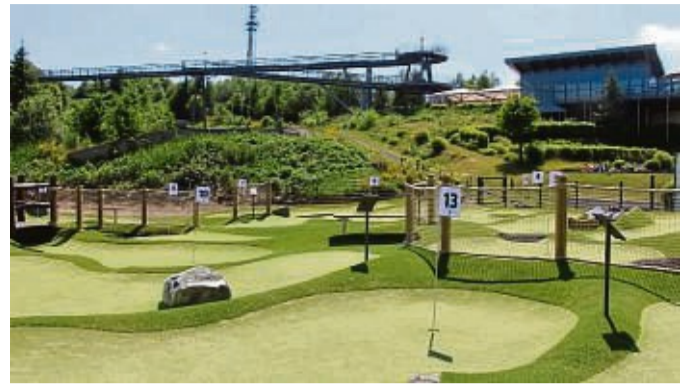
Die brandneue Attraktion „Abenteurgolf“ ergänzt die vielen Möglichkeiten am Erlebnisberg Kappe Winterberg.

Neben der Sommerrodelbahn gibt es weitere aufregende Attraktionen. Der Kletterwald bietet spannende Parcours in unterschiedlichen Schwierigkeitsstufen, um den Mut und die Geschicklichkeit der Besucher herauszufordern. Für diejenigen, die es lieber gemütlicher angehen möchten, gibt es die Panorama Erlebnis Brücke, eine monumentale Aussichtsplattform der besonderen Art. Hier können Familien entweder entspannt über einen gut ausgebauten Planenweg spazieren, oder oberhalb, unterhalb oder neben