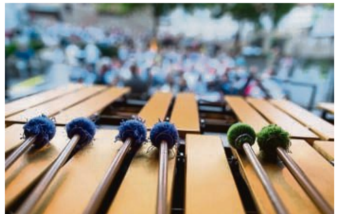
Schlaginstrumente beim Kultursommer: Das Ad Astra Percussion-Ensemble gastiert in Vöhl.

Viele der zum Einsatz kommenden Instrumente sind dem Publikum in ihrer Funktionsweise und ihren klanglichen, technischen und spielerisch-musikalischen Dimensionen unbekannt, obwohl sie zum klassischen Instrumenten-Kanon gehören. Sie versprechen damit nicht nur ein spannendes Hörerlebnis, sondern bieten auch viel zum Schauen und Staunen. Die Musiker erzählen in ih-