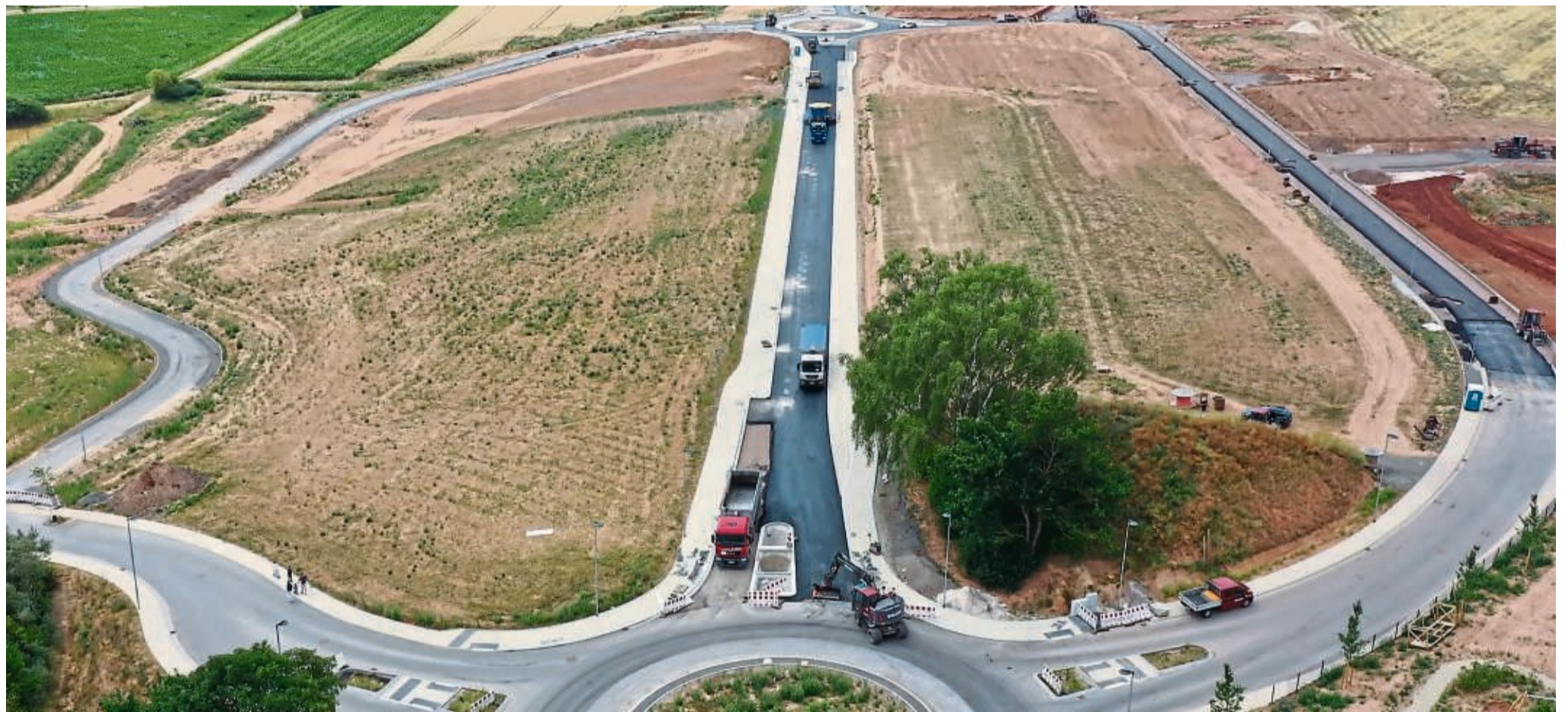
Ober- und unterhalb der Marburger Straße in Frankenberg werden jetzt die ersten Bauplätze verkauft, sodass schon bald gebaut werden kann. Rechts oben im Bildrand die Burgwaldkaserne.