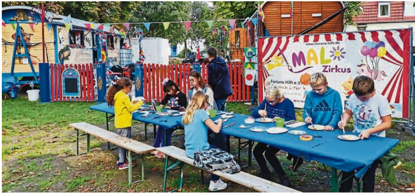
Auch im Malzirkus in Bad Neuenahr-Ahrweiler erhalten Kinder Unterstützung unter dem Leitgedanken „Malen, was man nicht aussprechen kann“.