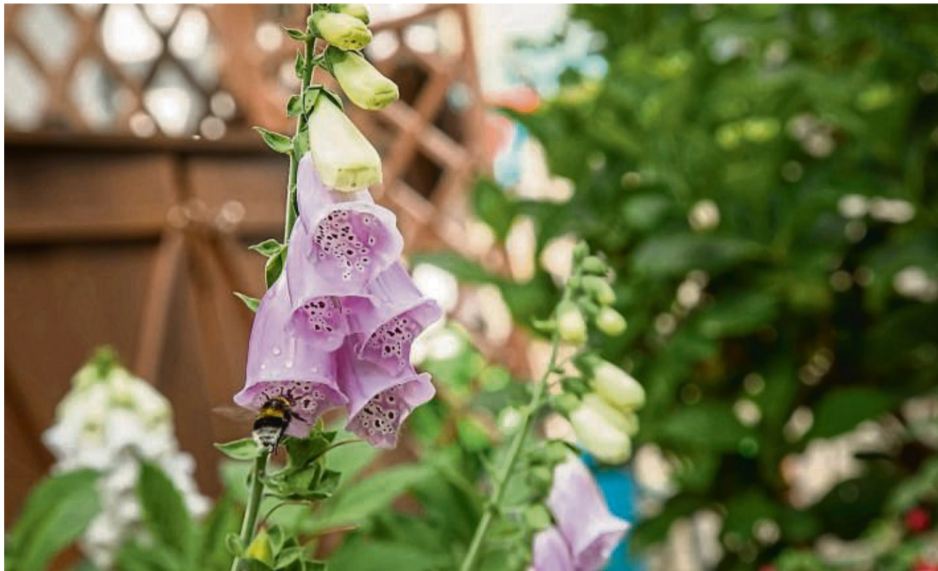
Vom Fingerhut gibt es zweijährige, neuerdings aber auch einjährige Sorten.

„Eine zu zeitige Aussaat bringt aber auch keine Vorteile, weil dann die Pflanzen