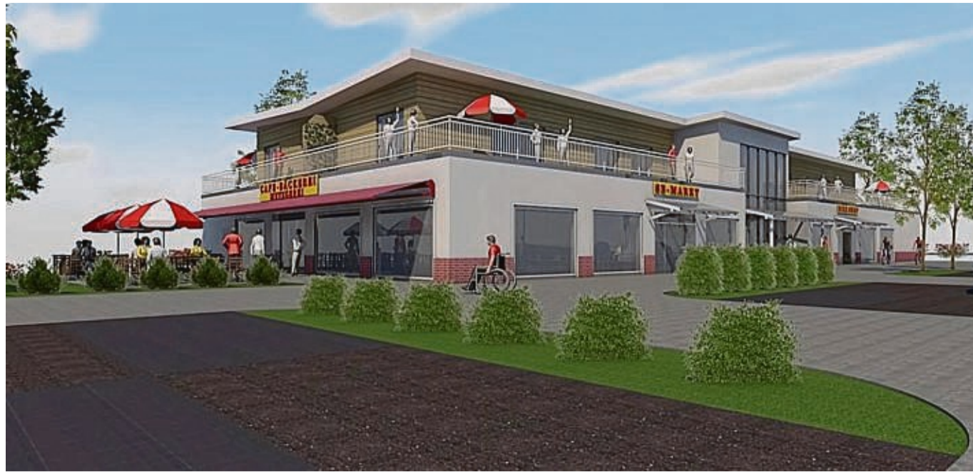
Aus der Traum vom Nahversorger in Heringhausen? Den Investoren sind angesichts der Wirtschaftslage die Betreiber abgesprungen, damit stehen drei geplante Großprojekte am Diemelsee auf der Kippe. ZEICHNUNG: ARBEITSGEMEINSCHAFT FABERWEBER