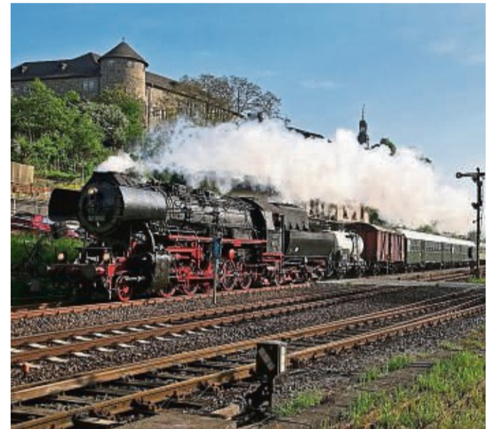
Die Dampflo der Eisenbahnfreunde Treysa.

Die Fahrt im bewirtschafteten Sonderzug beinhaltet jeweils auch die Rückfahrkarte. Um frühzeitige Buchung wird gebeten. Weitere Informationen zur Fahrt sowie Fahrkarten mit Platzreservierungen sind unter www.ef-treysa.de oder per Telefon unter 06698 / 9110 441 erhältlich.