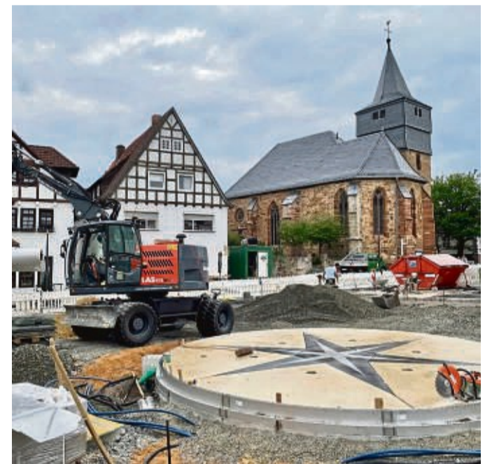
Ein Fontänenfeld mit dem Waldecker Stern ziert den neu gestalteten Marktplatz. Das Wasserspiel wird voraussichtlich im August in Betrieb genommen.

Nach einigen Preisschocks bei städtischen Projekten gibt es an der Waldecker Großbaustelle erfreuliche Nachrichten. „Wir liegen im vorgegebenen Kostenbudget“, erklärt Wetekam. Die reinen Baukosten bezifferte Boos bei der Ortsdurchfahrt auf rund 1,6 Millionen, bei der Gestaltung des Marktplatzes auf 1,2 Millionen Euro. Dazu werden Zuschüsse aus dem Förderprojekt „Lebendige Zentren“, aus GVFG-Mitteln für Gehwege und Nebenanlagen sowie von Hessen Mobil erwartet.