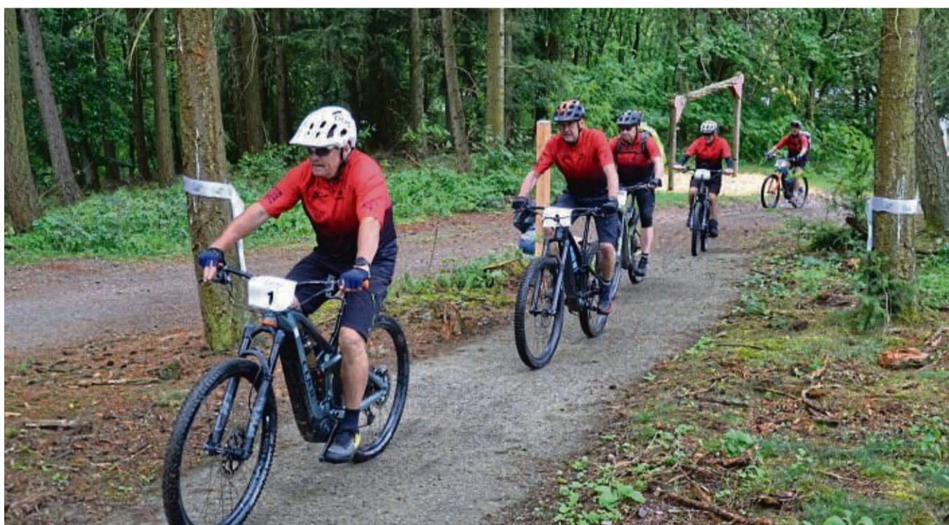
Die „Bergstromer“ zeigten sich nach der ersten Testrunde von den Trails begeistert.