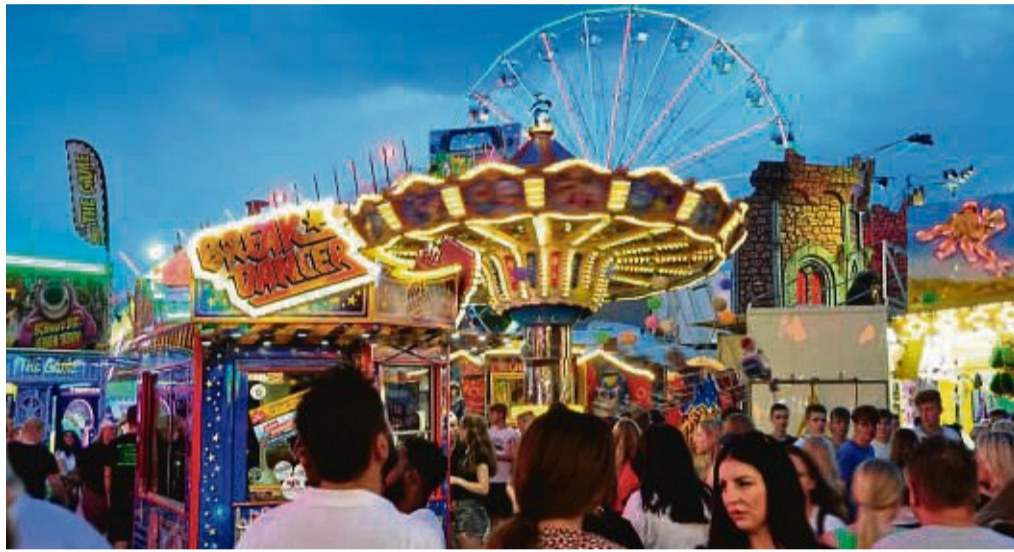
Viel los beim Viehmarkt: Vom 3. bis 6. August geht es rund auf dem Festplatz.

Durch die erforderlichen Sicherheitsmaßnahmen kommt es für die Dauer des Festzuges zu Behinderungen im Straßenverkehr. Die Bürgerinnen und Bürger werden gebeten, ihre geparkten Fahrzeuge frühzeitig von der Festzugsstrecke zu ent-