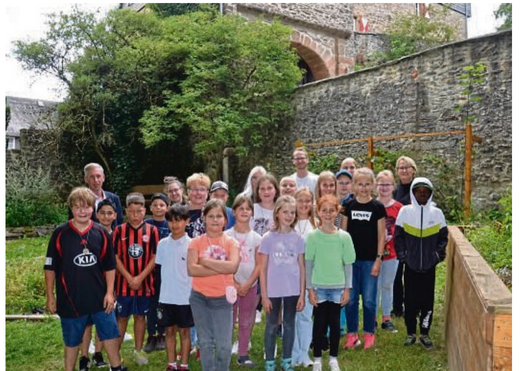
NOCH kindgerechter machen wollen 20 Mädchen und Jungen die Jugendburg Hessenstein in ihrem Sommercamp samt „Zukunftswerkstatt“.