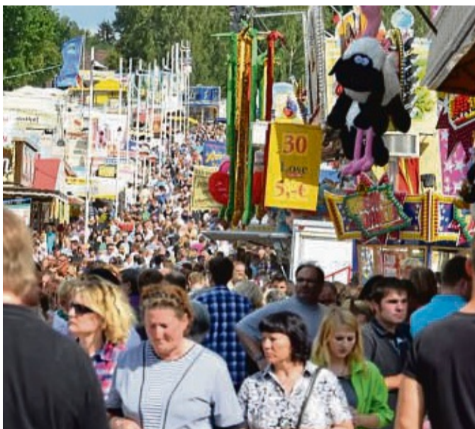
Die Besucher des Kram- und Viehmarktes erwartet bunte Unterhaltung, aber auch viele interessante Informationen.

Das Malbuch enthält 20 Motive zum Ausmalen, vom Karussell bis zum Essensstand. Die Motive haben die Neuntklässler der Christian-Rauch-Schule im Kunstunterricht gezeichnet. Dabei sind insgesamt 80 Motive zusammengewickelt, eine Jury wählte die 20 schönsten aus. Das Malbuch ist in einer Auflage von 1500 Stück erschienen und kostenlos abgegeben.