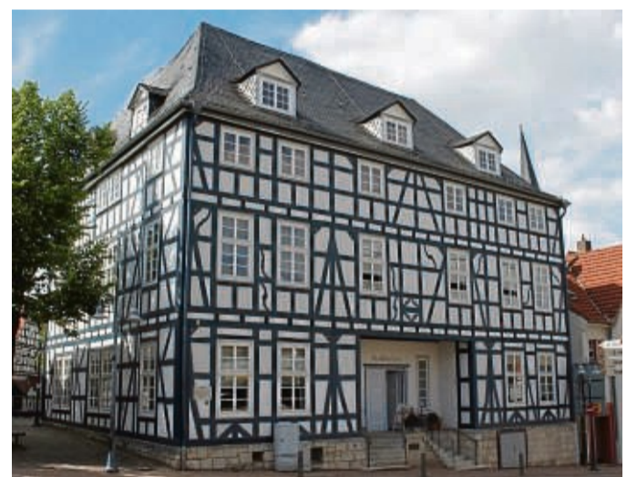
In diesem Fachwerkhaus in der Korbacher Altstadt ist die Stadtbücherei ansässig.

Korbach – Die Stadtbücherei Korbach begeht im September ihr 125-jährigen Bestehen. Aus diesem Anlass wird ein Jubiläumswettbewerb unter dem Motto „Meine Stadtbücherei“ veranstaltet. Menschen aller Altersgruppen sind eingeladen, ihre Kreativität unter Beweis zu stellen. Der Wettbewerb besteht aus zwei Kategorien: Beim Schreibwettbewerb können