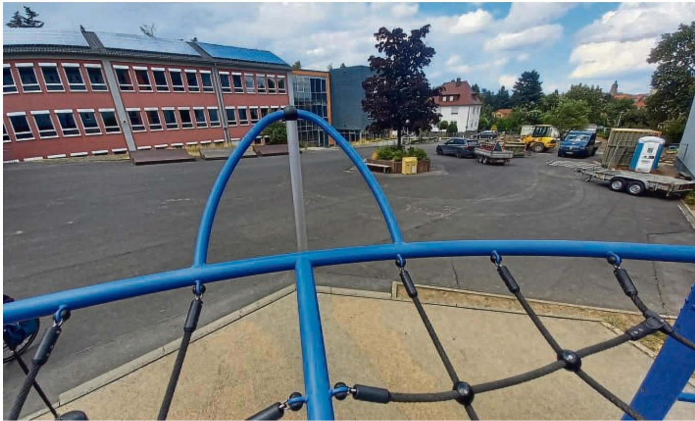
Am Wildunger Gustav-Stresemann-Gymnasium wird bereits der Schulhof umgebaut und umgestaltet, auch um angesichts des Klimawandels mehr Pflanzen anzusiedeln.