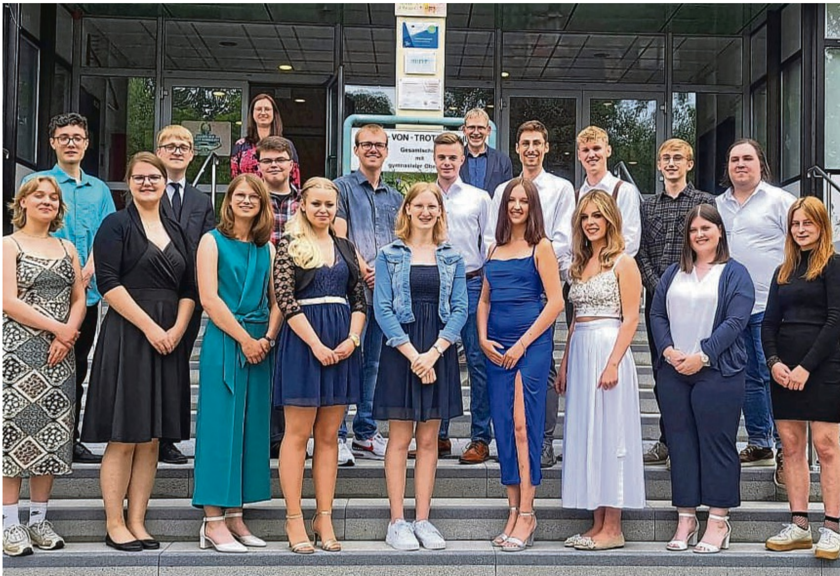
Haben allen Grund zum Strahlen: Die Abiturientinnen und Abiturienten des Jahrgangs 2023 der Adam-von-Trott-Schule in Sontra.