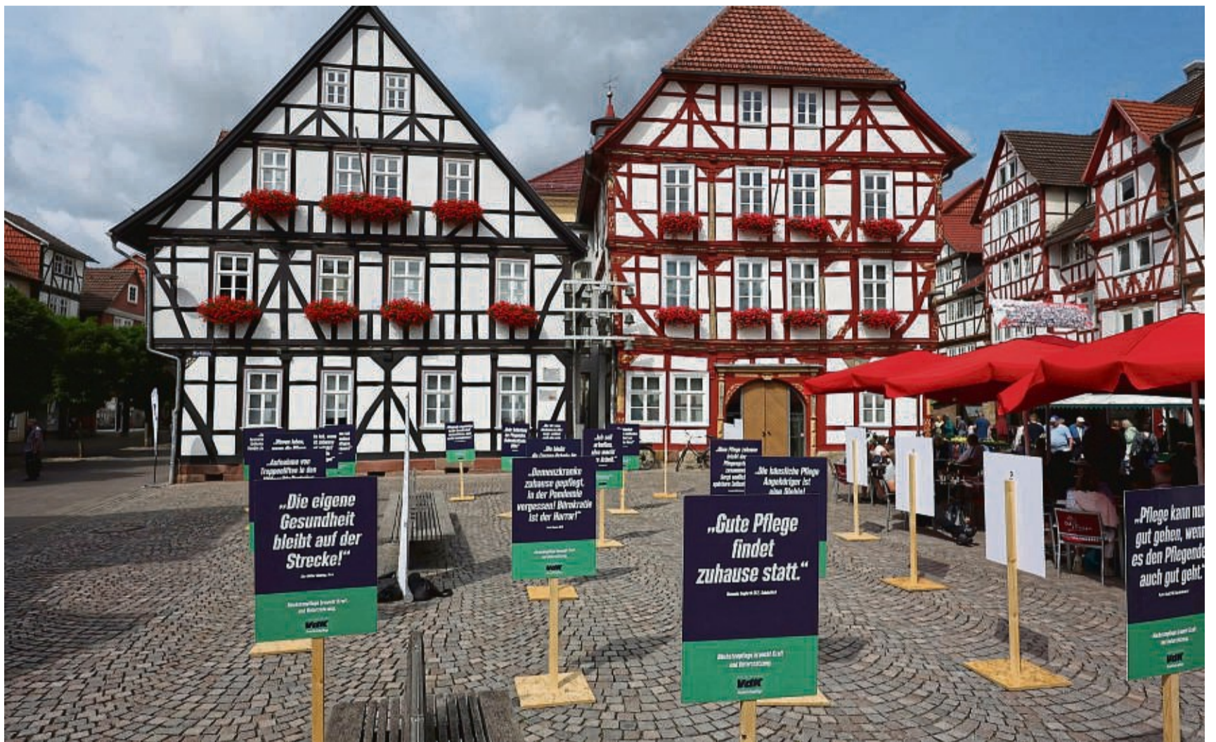
Eine Demo ohne Menschen hatte der VdK in der Eschweger Innenstadt veranstaltet. Damit wollten der Sozialverband und pflegende Angehörige auf die prekäre Lage in der Pflege aufmerksam machen und die Unabkömmlichkeit der Betroffenen betonen.