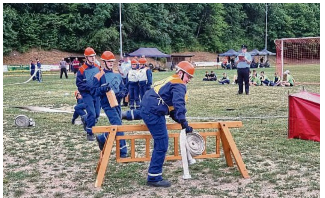
An der Hürde: Unter den Augen der Wertungsrichter haben sich die Jugendlichen im Heinrich-Schneider-Stadion gemessen.

Kreisentscheid des Bundeswettbewerbs der deutschen Jugendfeuerwehren