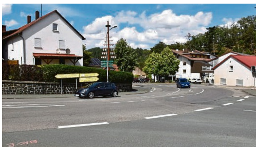
Die Bundesstraße 253 in Löhlbach wird ab 2024 grundhaft saniert. Damit soll auch eine Verbesserung des Ortsbildes verbunden werden.

Von dort bis zum Ortsausgang in Richtung Bad Wil-