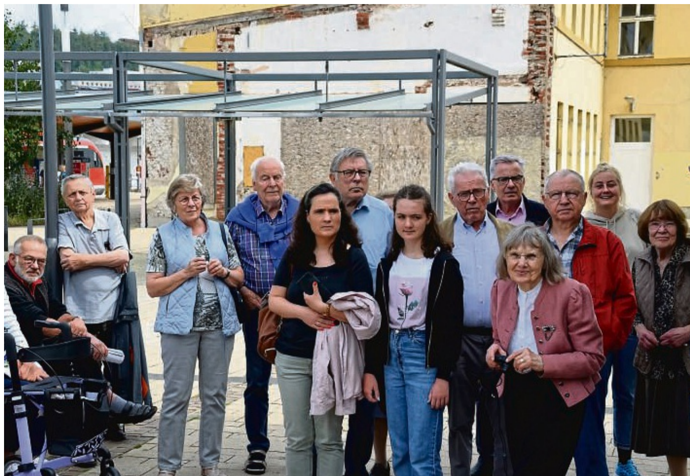
Gedenkveranstaltung: Am Bahnhof erinnerten sich die Menschen an die Ankunft der Heimatvertriebenen vor 77 Jahren in Frankenberg.