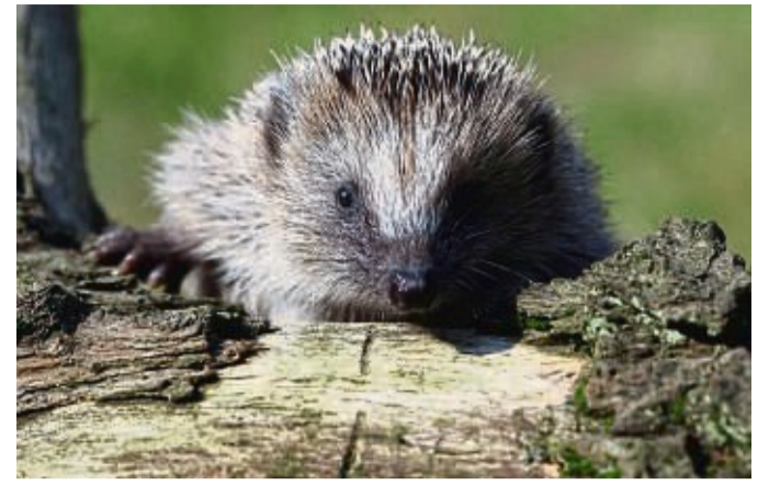
Ein Igel kann in einem Holzstapel im Garten Unterschlupf finden.