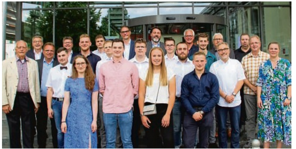
Freuen sich über die bestandene Gesellenprüfung im Tischlerhandwerk: die erfolgreichen Absolventen, Mitglieder des Prüfungsausschusses, Vertreter aus Handwerk, Politik und Wirtschaft sowie Ausbilder. Das Foto entstand vor der Kreissparkasse in Melsungen, dem Ort der Freisprechungsfeier.

Der Beruf des Tischlers habe sich in den vergangenen Jahren „in Zeiten von mehreren Krisen“ als außerordentlich krisenfest bewiesen, sagte der Obermeister, und: „Kurzarbeit, Stellenabbau, staatliche Hilfen – nicht bei uns.“ Selbst während des