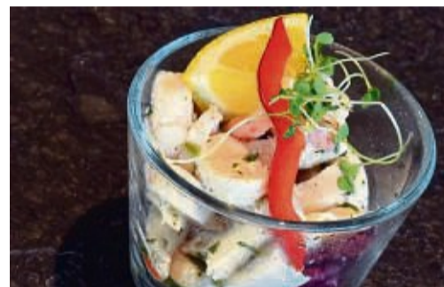
Zum Oktopussalat mit Limetten- und Zitrusnoten passt ein trockener Weißwein mit feinem Schmelz, etwa Weißburgunder.