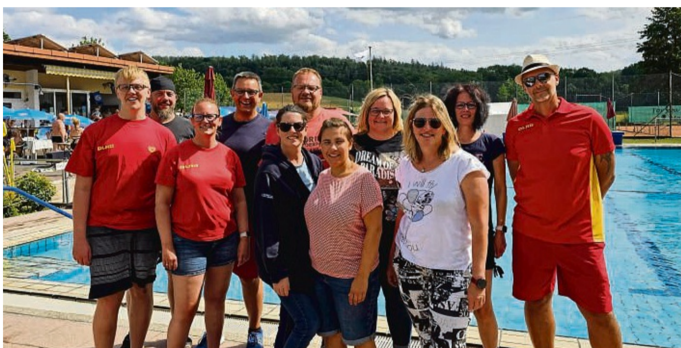
Das Organisationsteam der DLRG Niederbeisheim setzt sich für den Erhalt des Freibades ein.

Seit ihrer Gründung vor 50 Jahren habe die DLRG Niederbeisheim rund 1000 Kindern das Schwimmen beigebracht und über 300 Rettungsschwimmer aus- und fortge-