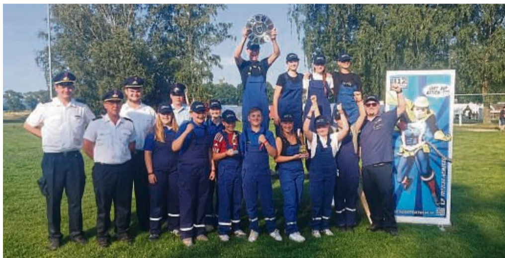
Jugendfeuerwehr feiert Doppelsieg: Das Foto zeigt die Jugendlichen beim Kreisscheid.

Diese wurde im Felsberger Stadion ausgetragen. Zwölf Mannschaften der drei Kreisverbände Melsungen, Fritzlär-Homberg und Ziegenhain nahmen teil. Mühlhausen darf nun schon zum 30. Mal