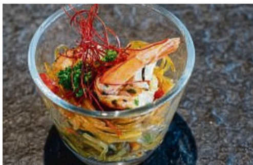
Zum asiatisch angehauchten Nudelsalat mit Garnelen passt ein Riesling Kabinett.