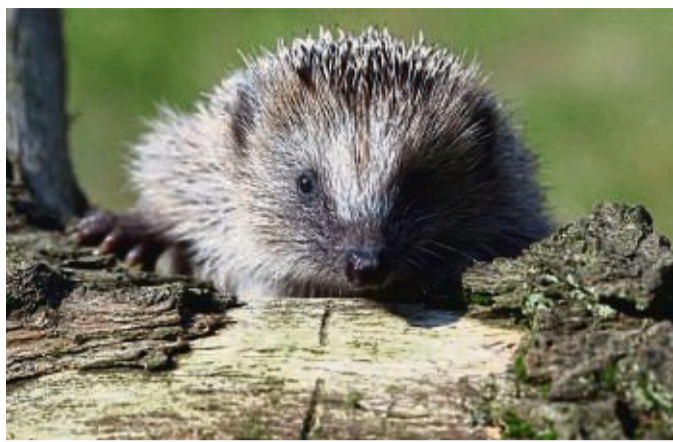
Ein Igel kann in einem Holzstapel im Garten Unterschlupf finden.