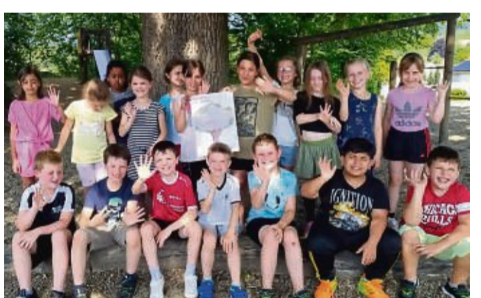
Viele Kreuze auf dem Umweltbaum: die Kinder der 2b der Schloth-Schule mit ihrem Plakat.

Deshalb hatte der Schulleiter gemeinsam mit der Schulleitung zum zwei-