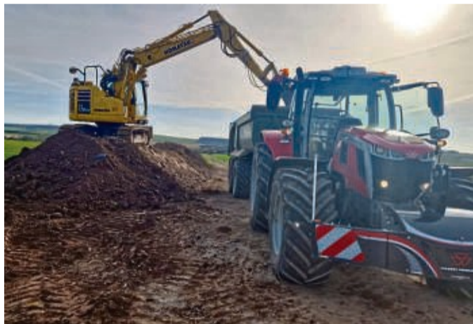
Für Großes gerüstet: Baggerarbeiten und der Transport von Schüttgut stellt im privaten, öffentlichen oder gewerblichen Bereich kein Problem dar.