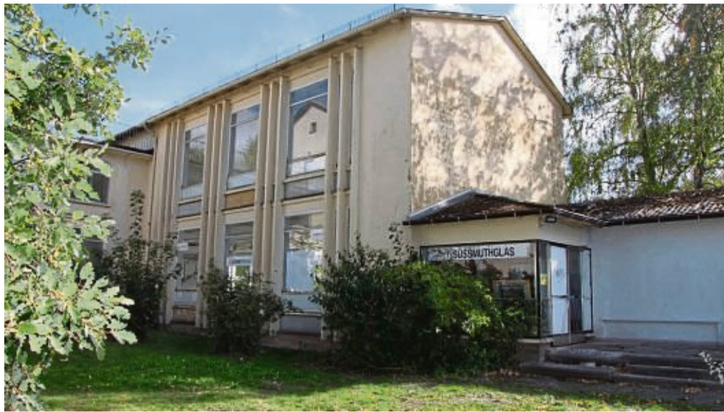
Die Süßmuth-Räume in Immenhausen: Sie wurden als Standort für das Berufsorientierungszentrum ausgewählt. Bevor dort die Arbeit starten kann, müssen die Räume allerdings erst einmal saniert werden.

Nach einer Idee der CDU wurde auf Grundlage eines Antrags von SPD, Grünen und CDU beschlossen, dass einmal im Jahr in den Ausschüssen für Bildungswesen und Kultur sowie für Wirtschaft- und Strukturpolitik ein Bericht zur Arbeit des BOZ vorgelegt werden soll.