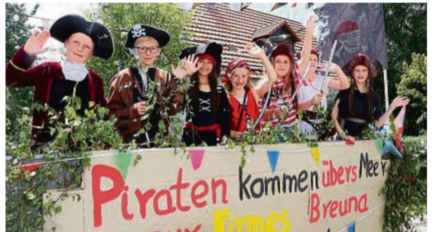
Sympathische Piraten: Eine Clique Breunaer Schulfreunde erntete im Festzug mit tollen Kostümen samt Säbeln viele bewundernde Blicke.