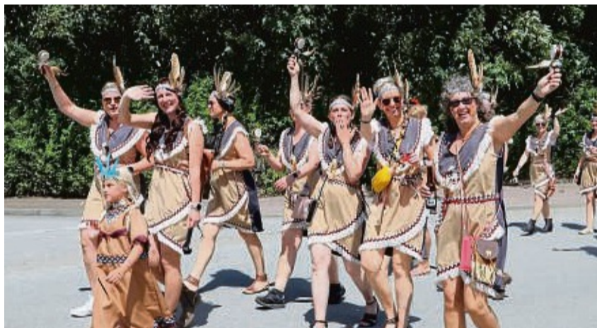
Die Prärieschnitten: Die Mädelsgruppe spielte in Gestalt von Apanachis auf die vielen Schotterflächen in Breuna nach der Glasfaserverlegung an.