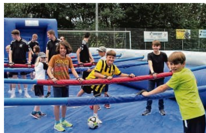
Besonders beliebt am Tag der Inklusion und Integration durch Sport in Elbenberg war der Menschen-Kicker-Kasten.