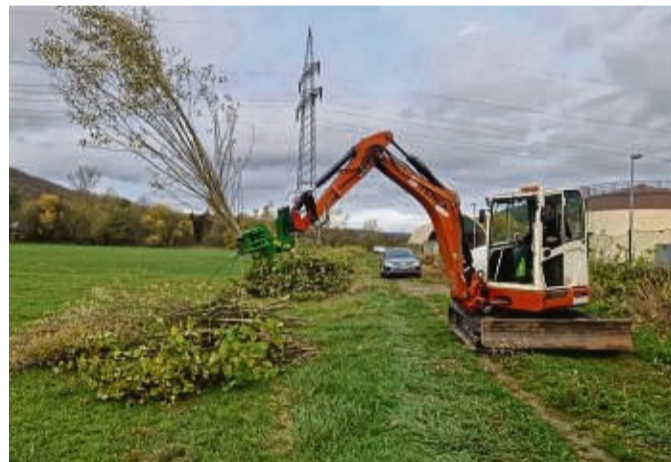
Baumfällarbeiten: Ob auf freiem Feld, im Wald oder in einer Siedlung – die Profis von Menke beschneiden oder fällen jeden Baum.