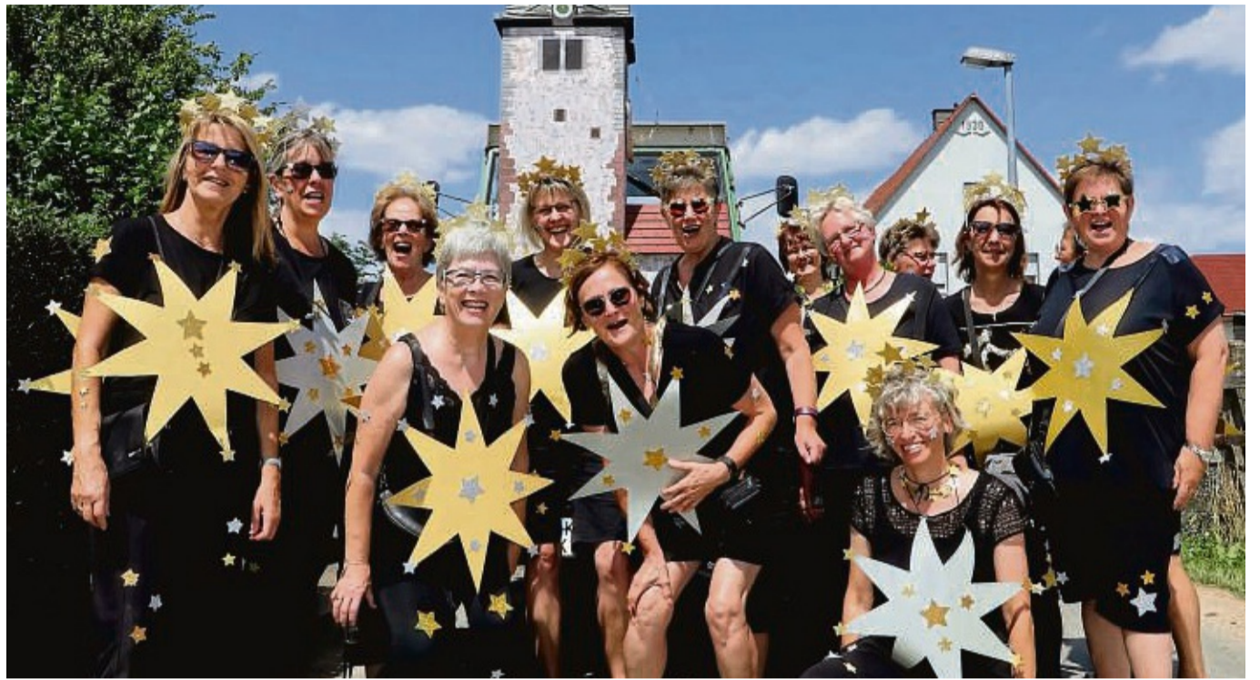
Sternenzauber: Jede Nacht strahlt seit Weihnachten der Schmuck auf der St. Margarethen-Kirche. Das nahmen die Damen vom Frauentreff Breuna-Rhöda auf die Schippe und verbreiteten mit ihrem Auftritt selbst Glanz.

So wurde in Anspielung auf die vielen Schotterstreifen nach Glasfaserverlegung von schmucken Apanachi-India-