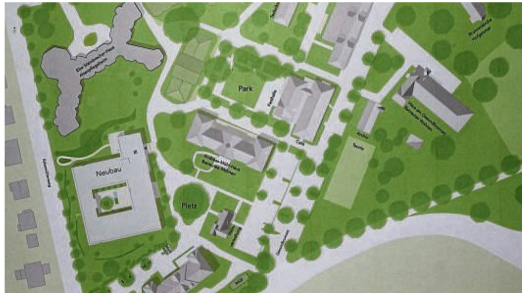
Endausbau: Der Neubau entsteht am Kabemühlenweg (unten links). Das Else-Streimbacher-Haus (darüber) wird saniert, Küche und Neues Brunnenhaus abgerissen.

ge Menschen dazu zu bringen, eine grundständige Ausbildung zu beginnen. tty