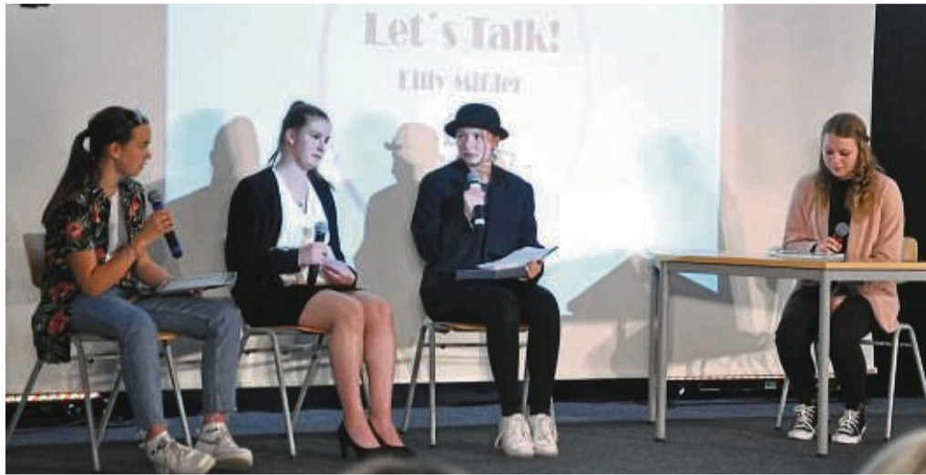
Gestalteten ein abwechslungsreiches Programm: Die 10. Jahrgangsstufe der Adam-von-Trott-Schule Sontra.

Zwei Schüler schlafen im Unterricht ein und begeben sich auf eine abwechslungsreiche Traumreise mit vielen unterschiedlichen Stationen. Da begegnen sich Peter Fox und Faust in einer Talkshow und diskutieren über die heutige Gesellschaft, Jugendliche zeigen ihren Lebensraum Profisportler zu werden, eine Frau aus den 50er Jahren und eine aus der heutigen Zeit tauschen sich über ihre Wünsche und Perspektiven aus. Die Schülerinnen und Schüler spielten Bauarbeiter, die Sprüche über das harte Leben klopfen und sich den Feier-