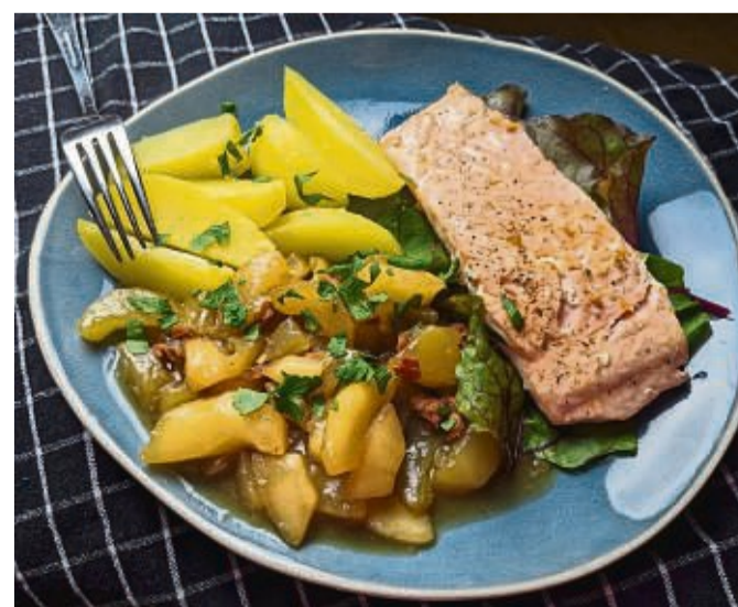
Zu den Schmorgurken mit Zwiebeln und Schinkenwürfeln passen Salzkartoffeln und Lachs.