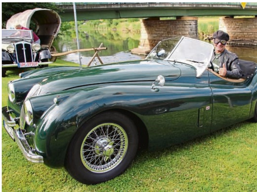
Ein echter Hingucker: Dieser Oldtimer war bei den Wanfrieder Hafen-Classics im Jahr 2017 zu bestaunen.