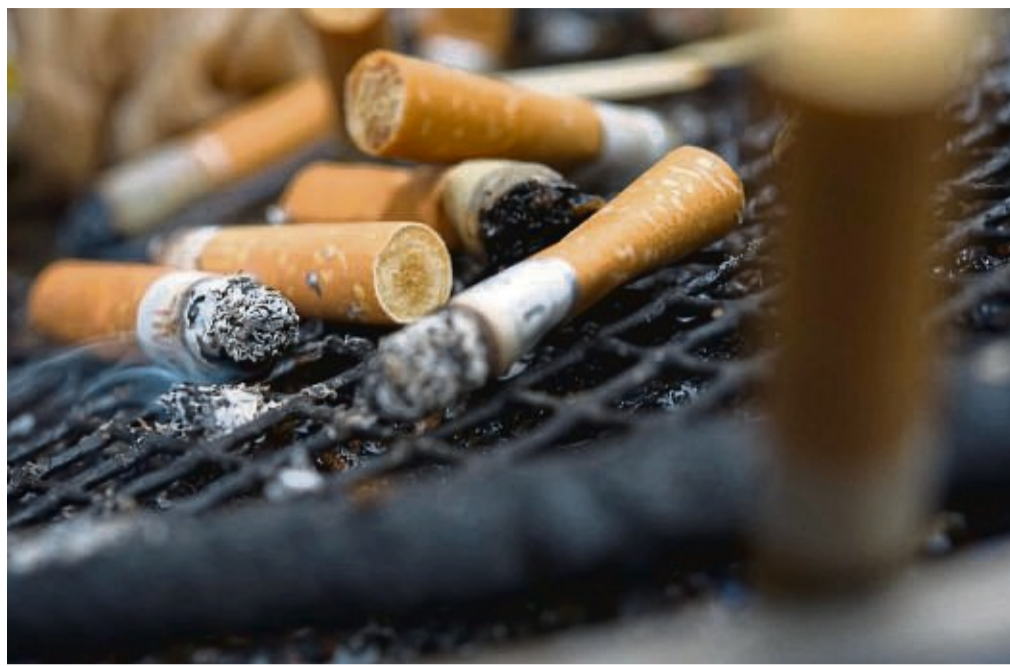
Damit die allerletzte Zigarette auch die allerletzte Zigarette bleibt, ist große Disziplin gefragt.

(Ausgabe 1/2023) hat wissenschaftliche Studien zur Wirksamkeit von 12 Nikotinersatzprodukten ausgewertet und kommt zur Einschätzung: Die Produkte erhöhen die Chance, dass man tatsächlich von der Zigarette loskommt.