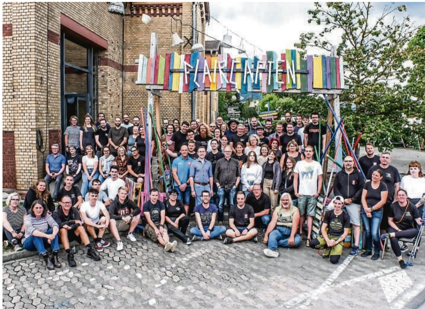
Tragen zum Gelingen des Festivals bei: Die Crewleiter haben sich im E-Werk getroffen, um letzte Absprachen zu treffen.

Open Flair: Crewleiter organisieren den Einsatz der Freiwilligen