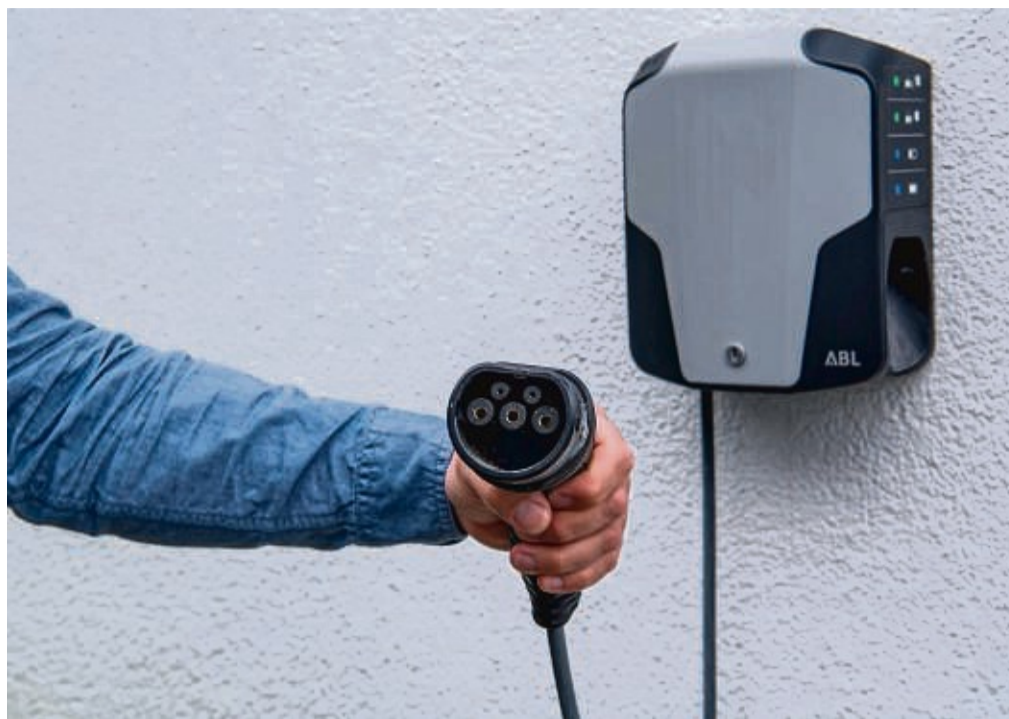
Dreiphasige Anschlüsse zur Wallbox sind für 11 oder bis zu 22 kW Ladeleistung gedacht.

Zudem sollte der Abstand zwischen Auto und Wallbox nicht zu groß sein. „Lange Kabel und Adapter, die längere Distanzen überbrücken, sind immer Gefahrenquellen“, sagt Ralf Petri vom Verband der Elektrotechnik Elektronik Informationstechnik (VDE). Und die Carport-Wand sollte stark genug sein, um dort eine Wallbox aufzuhängen.