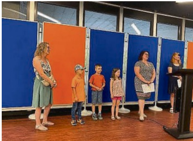
Konnten mit ihrem Müllprojekt überzeugen: Kindertagesstätte „Bunte Welt“ aus Wichmannshausen.