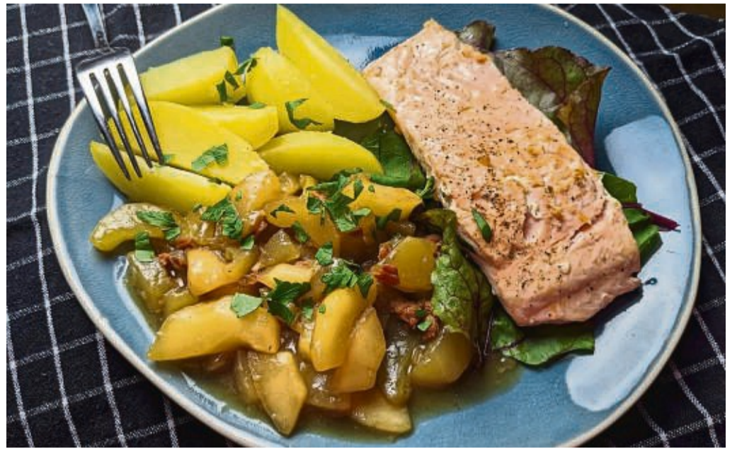
Zu den Schmorgurken mit Zwiebeln und Schinkenwürfeln passen Salzkartoffeln und Lachs.

4. Dann die Stärke mit ein wenig kaltem Wasser anrühren und zur Soße geben, um