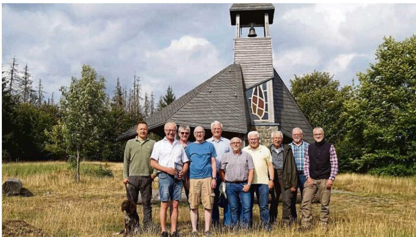
Der Vorstand der Freunde der Quernst plant für 24. September einen musikalischen Festgottesdienst zum 20-jährigen Vereinsbestehen.

Frankenau – 20 Jahre Freunde der Quernst: Das will der Verein, dessen Mitglieder sich seit 2003 für die Quernst-Kapelle engagieren und vielfältig einsetzen, gebührend feiern. Der Verein lädt daher für Sonntag, 24. September, zu einem Festgottesdienst auf der Quernst ein. Beginn ist um 11 Uhr.