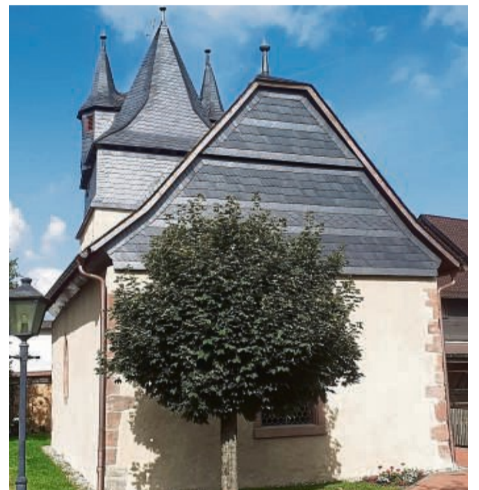
Ansicht der renovierten Kirche aus Westen.