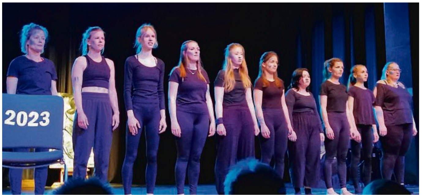
Preisträger des Kreiskulturpreises bei der Jugend: Die Musicalgruppe „Strong Together“ des evangelischen Kirchenkreises Eder, hier beim Auftritt im Rahmen der Theaterwoche Korbach.