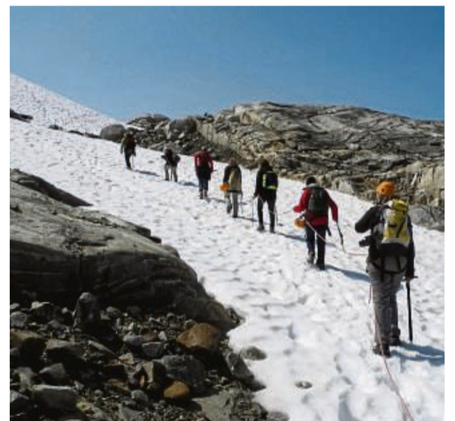
Im Team: Über den Gletscher geht es in der Regel am besten als Gruppe in einer Seilschaft.

Für erste Touren im Hochgebirge ist es unbedingt rat-