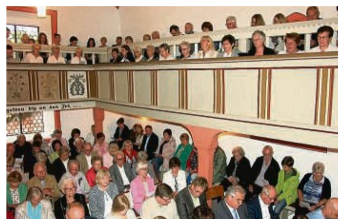
Das alte Gotteshaus war zum Festgottesdienst mit 150 Besuchern voll besetzt.