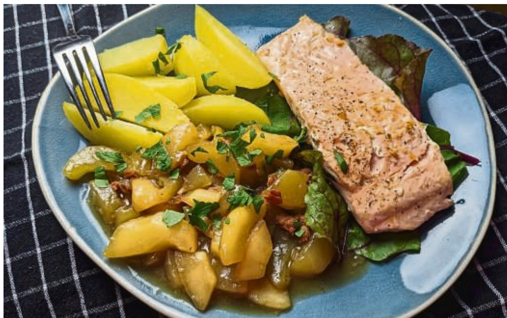
Zu den Schmorgurken mit Zwiebeln und Schinkenwürfeln passen Salzkartoffeln und Lachs.

4. Dann die Stärke mit ein wenig kaltem Wasser anrühren und zur Soße geben, um