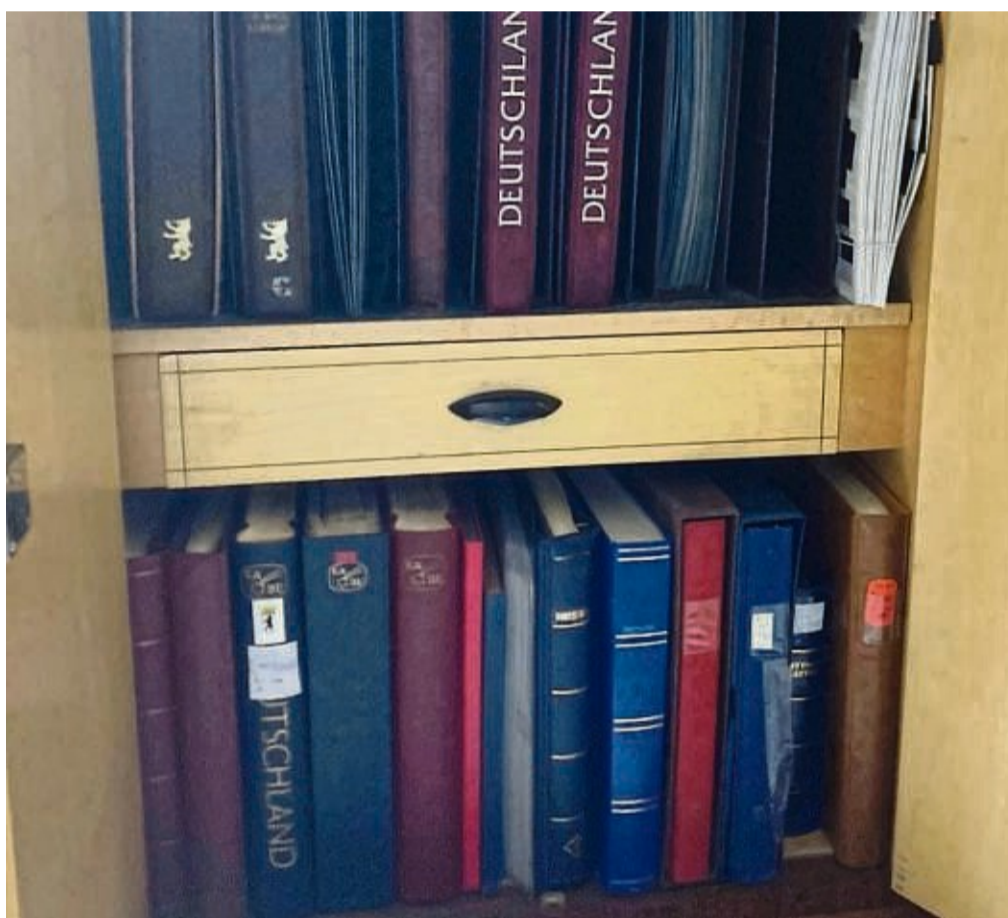
Typisches Bild: Alben bis unters Dach. Manche Sammler hinterlassen Unmengen an Marken, von denen keiner der Angehörigen weiß, ob sie etwas wert sind. Hier sind Experten gefragt.