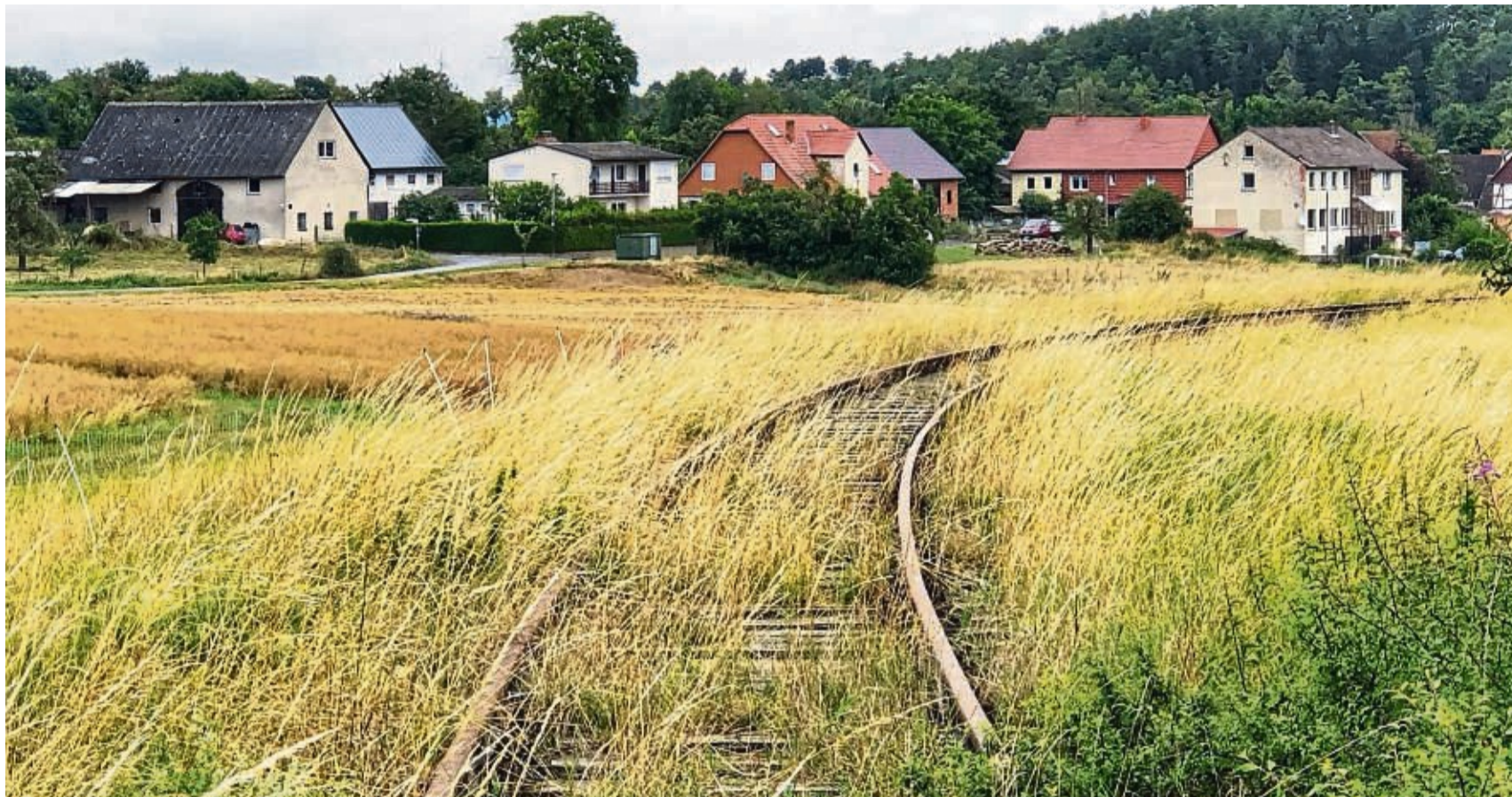
Landschaftlich reizvoll: Auf der stillgelegten Bahnstrecke zwischen Wolfhagen und Gasterfeld (Foto) soll ein Radweg geschaffen werden. Die Verwaltung wird nun den Vorschlag der Grünen auf Umsetzbarkeit prüfen.

Stadtverwaltung Wolfhagen prüft, ob Umbau möglich ist