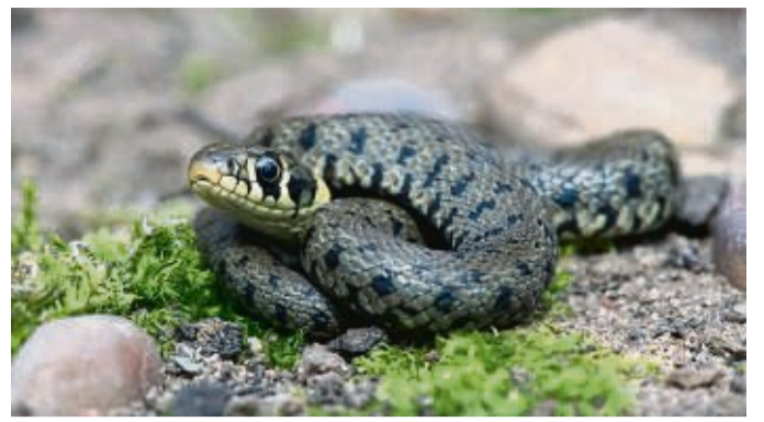
Harmloser Gartengast: Diese junge Ringelnatter ruht sich auf dem bemoosten Boden aus.

Grund zur Sorge, auch nicht, wenn man Kinder oder Haustiere im Garten hat“, beruhigt Maik Sommerhage. Meist bekommen die Gartenbesitzer die Anwesenheit der Schlangen gar nicht mit, da sich die scheuen Tiere meist zurückziehen, wenn die Menschen auftauchen.