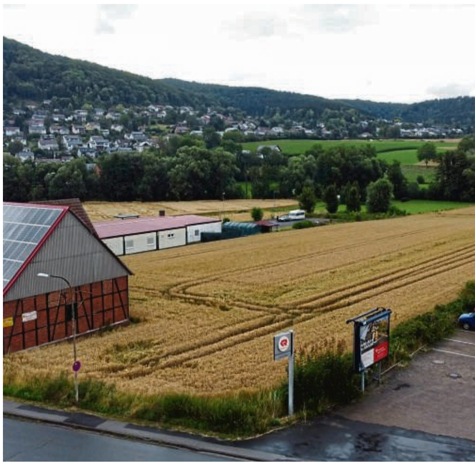
Hier soll der neue Rewe-Markt entstehen: Wo derzeit noch Ackerland ist, soll an der Kasseler Straße ein 1500 Quadratmeter großes Gebäude nach den neuesten Gestaltungsprinzipien gebaut werden.