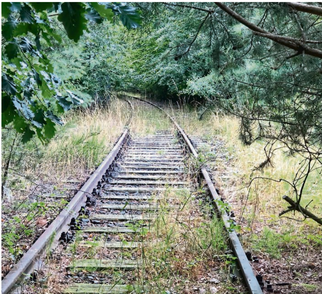
Kurz vorm Ende der gut fünf Kilometer langen Trasse rückt der Wald an die Gleise heran.