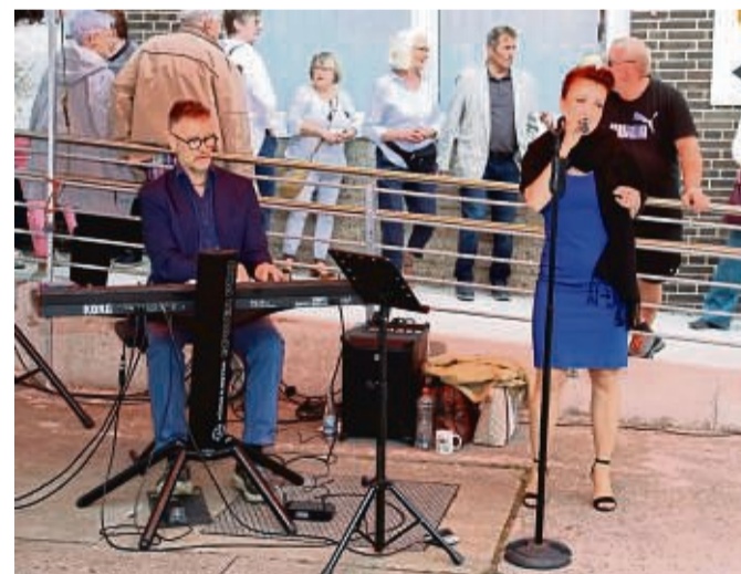
Das Duo Blue sorgte für den musikalischen Rahmen des Sommerfestes.

Wir freuen uns über den gelungenen Umbau für die Tafel Hofgeismar und bedanken uns bei allen Beteiligten für die gute Zusammenarbeit.