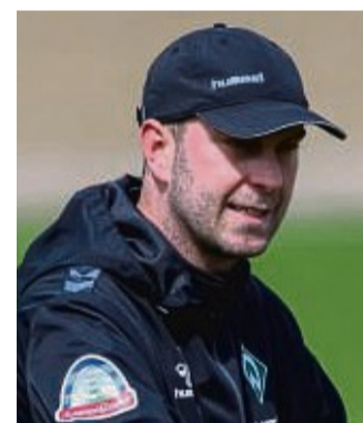
Hat seit November 2021 das Sagen beim SV Werder: Trainer Ole Werner.