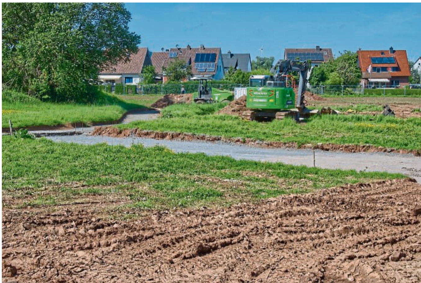
In der Laake entsteht ein neuer Spielplatz, außerdem wird eine Retentionsfläche angelegt.

Ziel ist, den historischen Charakter des Totenhagens zu erhalten und die historischen Grabflächen hervorzuheben. Die Eingangsbereiche an der Schulstraße und der Lengfelder Straße werden umgestaltet. Unter dem Motto „Friedhöfe erzählen Ge-