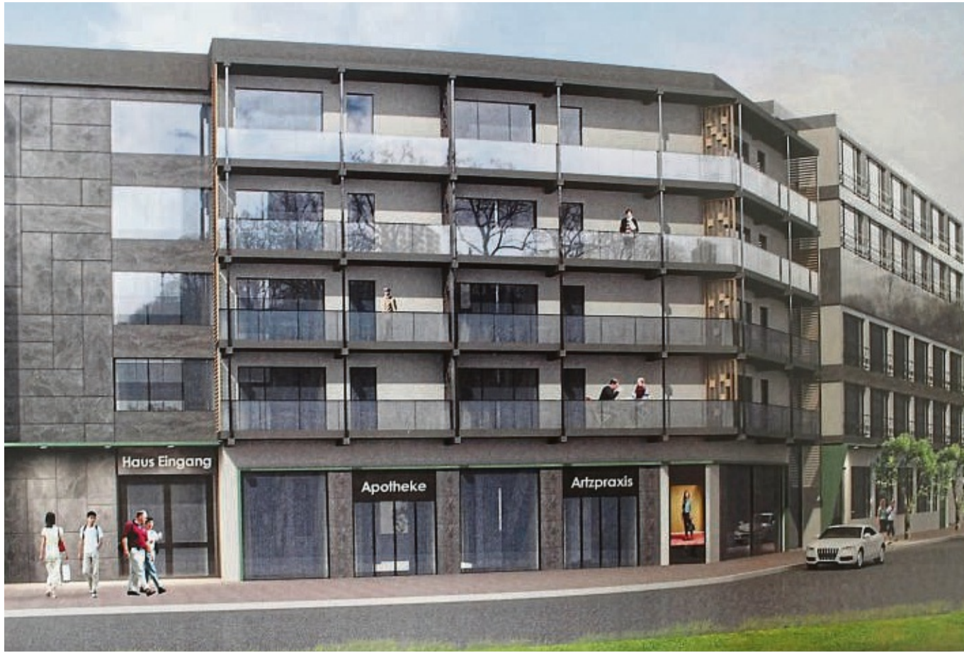
So könnte die „Parkhöhe“ nach einer Sanierung aussehen.

2018 hatte er die Kreditzusage seitens seiner beiden Hausbanken nach eigenen Angaben in der Tasche. Rund 1,3 Prozent Zinsen standen in