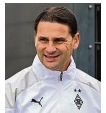
Trainer Gerardo Seoane hat die Fohlen in Gladbach übernommen.