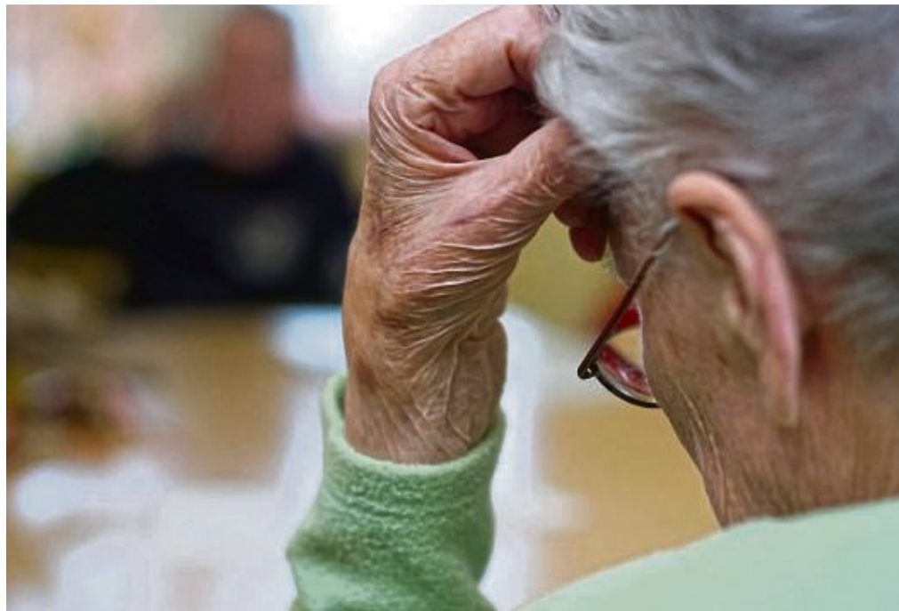
Bloß gestellt und lächerlich gemacht: Demenzkranke sind im „Haus Victorquelle“ in Bad Wildungen gefilmt worden. Die Videos wurden später in Kreisen der Beschäftigten geteilt.

Welches genaue Ausmaß die Aktionen der drei Pflegekräfte haben, ist ein Gegenstand der Ermittlungen. Ihr Ex-Arbeitgeber weiß von zwei Filmen, auf denen zwei Demenzkranke zu sehen sind und von etwa einem halben Dutzend Mitarbeitern der „Victorquelle“, mit denen die Aufnahmen geteilt wurden. Gibt es weitere Filme? Wurden Videos möglicherweise über Mitarbeiterkreise hinaus Außenstehenden zugeleitet? Kommt es zu einem