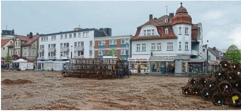
Die Baustelle auf dem ehemaligen Woolworth-Gelände in Korbach ruht: Das große Bohrgerät soll Ende des Monats wieder anrücken.