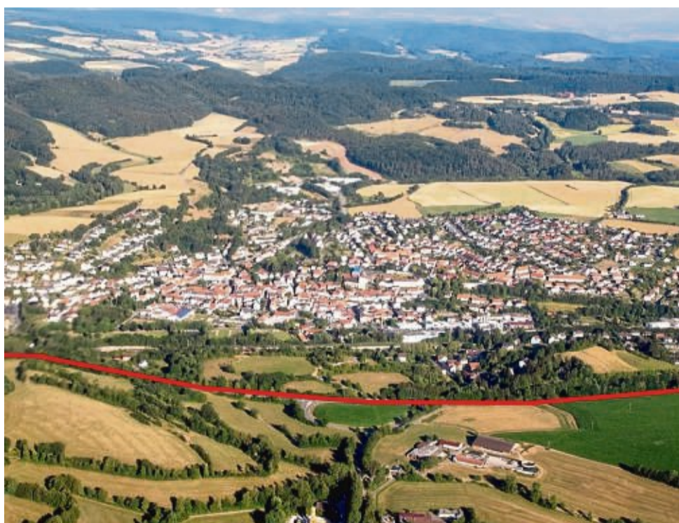
Die Bundesstraße 27 bei Sontra (rote Linie) wird auf einer Länge von etwa 2,1 Kilometern erneuert. Autofahrer müssen sich in den nächsten Wochen in Richtung Bad Hersfeld auf Behinderungen einstellen.

Alle Arbeiten der B27 erfolgen unter halbseitiger Sperrung für den Verkehr, der per Ampelschaltung geregelt wird. Da unmittelbar an den Zu-/Abfahrten Sontra-Nord und Mitte zur B27 gebaut wird, müssen diese während der Arbeiten voll gesperrt werden, damit die Sicherheit der Beschäftigten der Baustelle sowie der Verkehrsteilnehmer gewährleistet ist, teilt Hessen Mobil mit. Die Einmündung zum Autohaus Lindemann ist ab Baubeginn bis voraussichtlich zum Ende der Sommerferien voll gesperrt, da in diesem Bereich nicht nur der Asphalt erneuert wird, sondern auch die Verkehrsinseln. Die Umleitung ist ausgeschildert und führt für