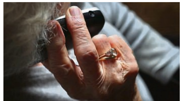
Die Polizei warnt davor, unbekanntem Anrufern persönliche Informationen durchzugeben.