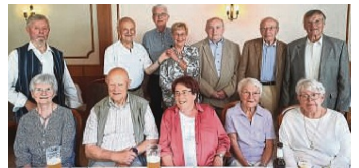
Elf Abiturienten und Ehemalige des Abiturjahrgangs 1960 trafen sich im Hotel Link Sontra.

Kleidung um 8 Uhr erscheinen. Keiner wusste, in welchem Fach er wann und von welchem Lehrer geprüft wurde. Das war vorher in einer Konferenz ausgehandelt worden. Da der gesamte Stoff gelernt werden musste, gab es natürlich Schwächen in einzelnen Fächern. So war ein Einser-Abitur sehr selten, wenn überhaupt möglich – im Gegensatz zu heutigen Abschlüssen. Die Abiturklasse hieß damals „Oberprima“. Die Versorgung der Abiturienten und der Lehrer mit Brötchen und Getränken während der Prüfung erfolgte durch die Schüler des nächsten Jahrgangs, der Unterprima. Das „Endergebnis“ dieses Abiturjahrgangs 1960 in Sontra: Ein Reihe qualifizierter Pädagogen und Ingenieure, sechs Doktoren und zwei Professoren. Die Schule war damals eine städtische Einrichtung. So saß auch der Bürgermeister mit in der Prüfungskommission. red/esp