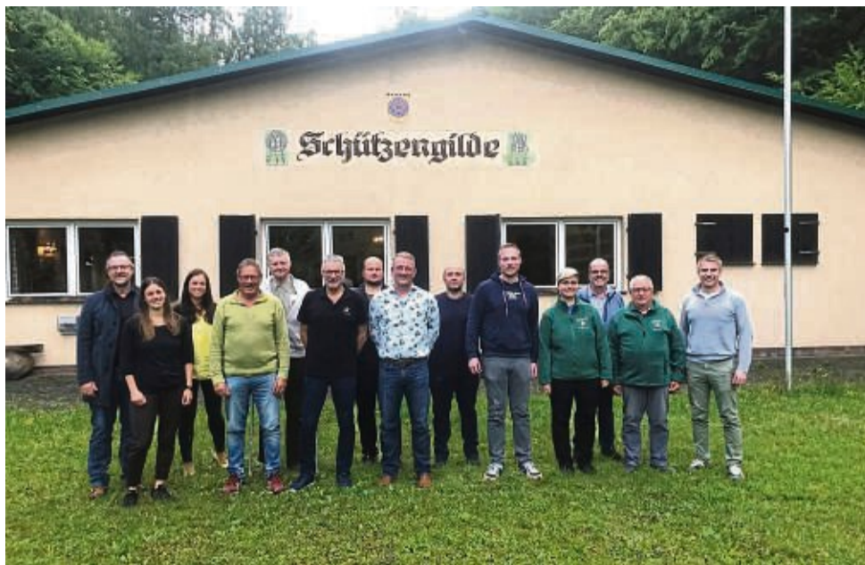
Zu einem ganz besonderen Familienfest lädt der Arbeitskreis Breitwiesn in Sontra, der sich Vorab schon zur Planung traf.

Das Fest sei der Stadt Sontra und dem Arbeitskreis „eine Herzensangelegenheit“, erklärte Bürgermeister Thomas Eckardt. Immerhin haben die Sontraer etwas nachzuholen, denn der Familientag war während der Breitwiesn in diesem Jahr ausgefallen. Am 10. September soll dann aber alles ganz anders sein. Dann stehen Familien und Kinder