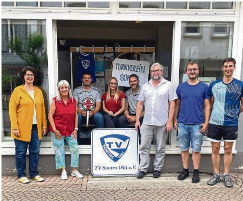
Der Vorstand des Turnvereins Sontra steht großen Herausforderungen gegenüber: Der aktuellen Hallensituation sowie dem Bedarf an Übungsleitern.

Ein Problem aber bedroht das vielfältige Angebot des TV Sontra, nämlich die aktuelle Hallensituation in Sontra. Dem Verein steht ab Herbst vielleicht nur noch die Großsporthalle zur Verfügung, die im Winterhalbjahr natürlich auch von den Vereinen genutzt wird, die im Sommer auf den Sportplätzen aktiv sind. Schon seit einiger Zeit laufen intensive