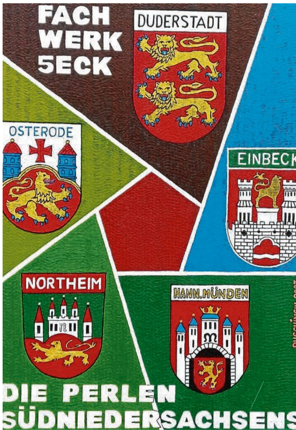
Die Wappen der fünf Städte des „Fachwerk5Ecks“.

Ruschinskis Werke hängen in seinem Haus an der Dransfelder Gerlandstraße, aber auch in zahlreichen Rathäusern der Region. Auch dem Krankenhaus im Göttinger Stadtteil Weende hat er ein Bild geschenkt, als Dank für eine Operation.