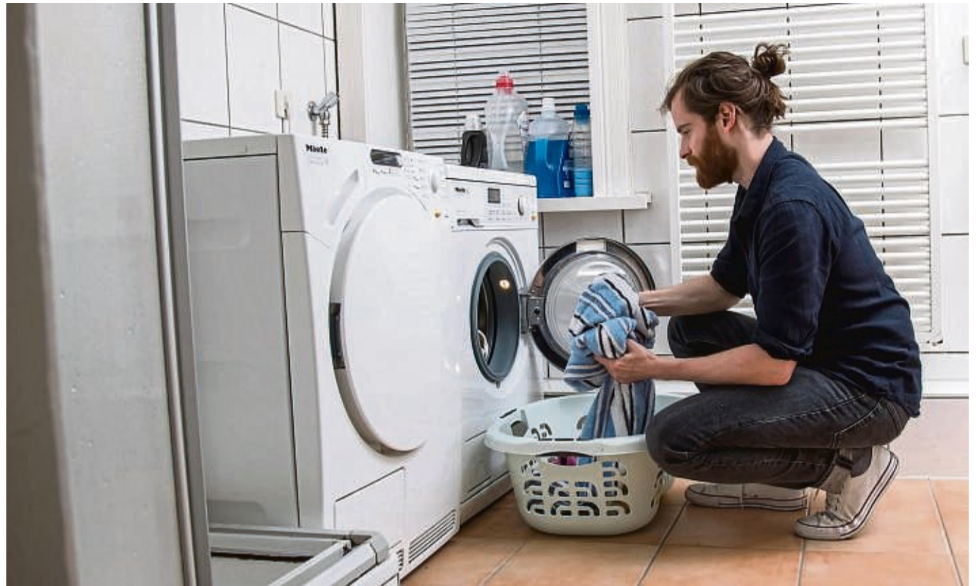
Brauchen wir wirklich so viel? Laut Experten reichen zumeist die Generalisten unter den Reinigungsmitteln für die Wäsche.

Für besonders empfindli- che Stücke aus Wolle emp- fiehlt Bernd Glassl auch ein Spezialwaschmittel für Wol- le, in den meisten Fällen sei es auch für Naturseide geeig- net.