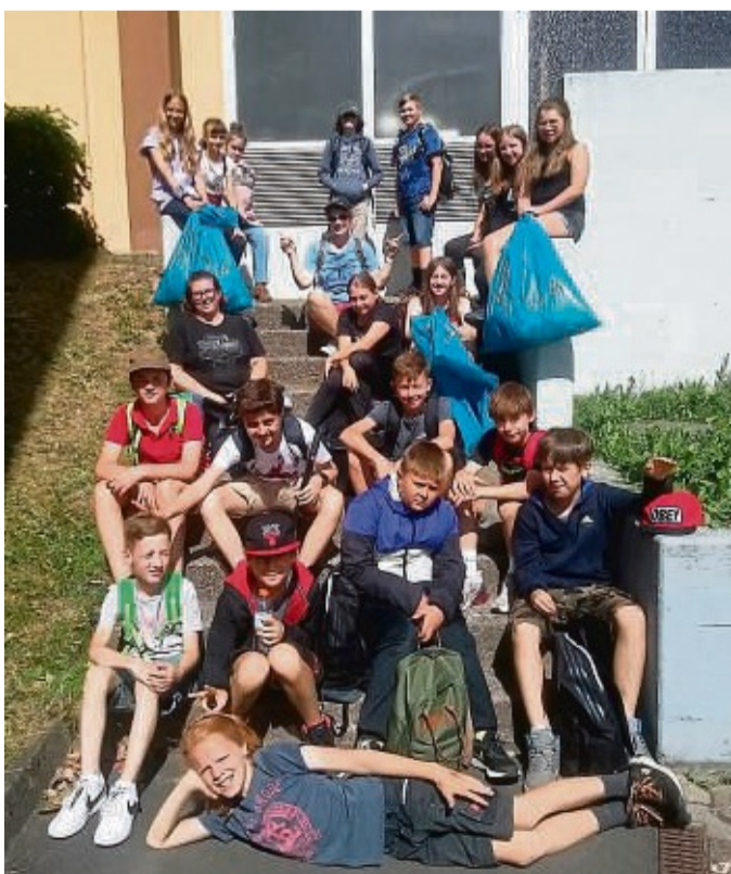
Auch diese Schüler der Valentin-Traudt-Schule Großalmerode beteiligten sich an der Aktion „Saubere Schulwege 2023“.

Auch manche Kuriositäten wurden der Pressemitteilung der Schule zufolge gefunden und der Mülltrennung zugeführt, sodass am Ende dieses zum Teil auch gemeinschaftsfördernden und erheiternden Schultages die Feststellung stand: So müsste Schule öfter sein, nämlich dass man nach einer Arbeit auch sichtbare Erfolge sieht. sff