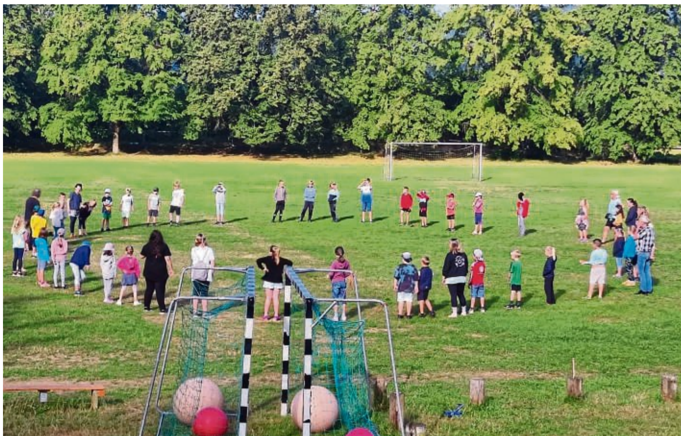
Bei dem Sommerferien camp konnten sich die Jugendlichen bei Veranstaltungen im Freien austoben.

Die Rettungssanitäter des ASB zeigten den Kindern, wie Verbände angelegt werden und erklärten die Instrumente im Rettungswagen. Beim Polizei-