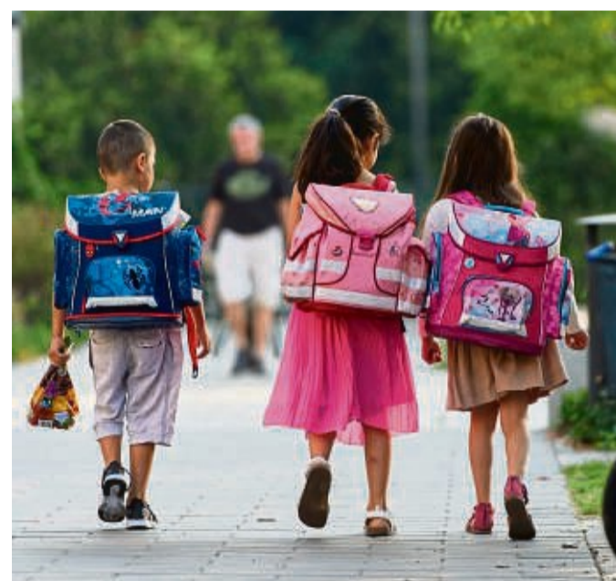
Bevor das Kind erstmals allein zur Schule gehen kann, steht viel Übung auf dem Programm.