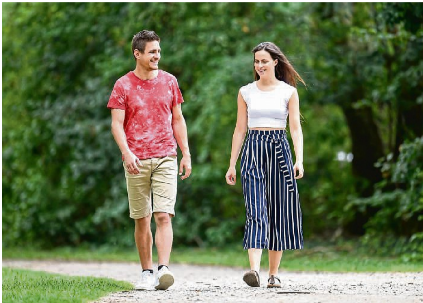
Zu zweit geht's oft noch besser: Jeder Spaziergang fördert die Gesundheit.

„An sich nicht, weil es auch Analysen gibt, dass das Ziel 10 000 Schritte ein wichtiger Prädiktor (das heißt eine Vorhersagevariable) für Erfolg ist, in dem Fall Blutdruck- und BMI-Senkung“, so Joisten. Die Studie zeige aber,