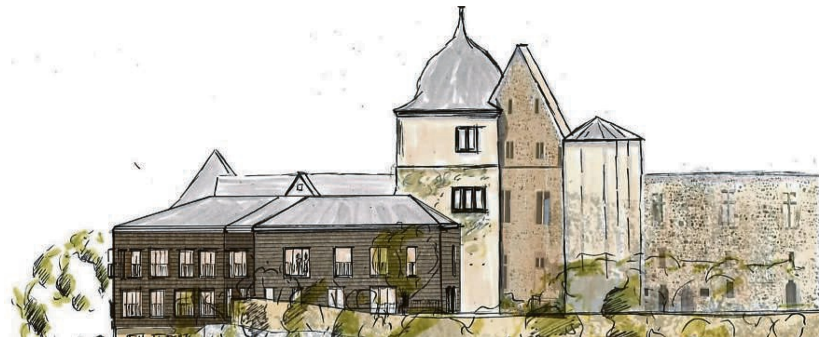
Wird teuer: Der bevorstehende Anbau an der Sababurg (hier eine Architektenansicht) entsteht aus Holz statt aus Beton und wird viel moderne Energietechnik enthalten.

Seit 2018 seien die Planungen vorangetrieben und vertieft worden, wobei sich Aspekte und Notwendigkeiten ergaben, die zuvor nicht im Gesamtkonzept enthalten waren, wie Pressesprecher Alexander Hoffmann-Glassneck erläutert. Dies waren im Wesentlichen die folgenden: