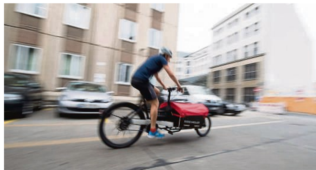
Stundenweise jobben in der Elternzeit? Das geht sogar bei einem anderen Arbeitgeber als dem bisherigen.

Dass 10 000 Schritte pro Tag gut für die Gesundheit seien, kam erstmals 1964 auf, als ein japanisches Unternehmen einen Schrittzähler auf den Markt brachte und den Launch mit einer Marketingkampagne rund um diesen Wert begleitete. Wissenschaftlich fundiert war er nicht, er ist aber auch nicht falsch. Denn auch wenn viel weniger Schritte reichen: Da geht noch mehr. tmn