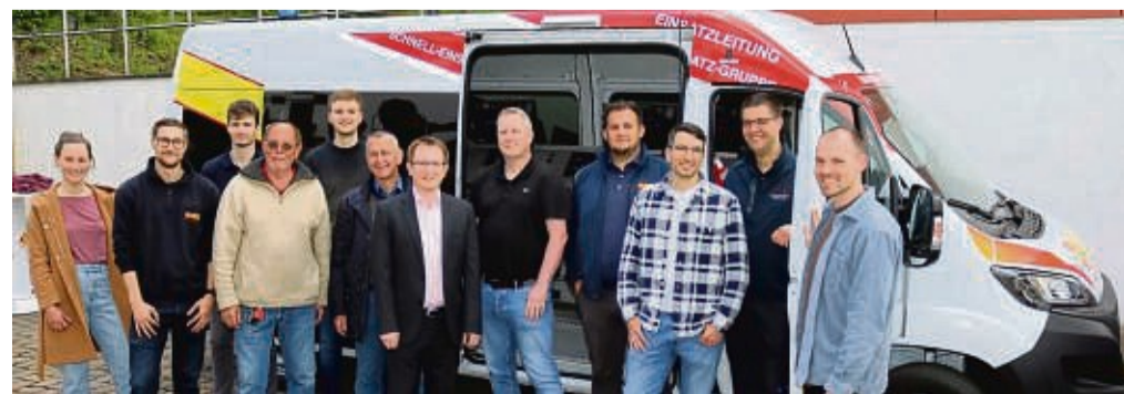
Fahrzeugübergabe beim ASB in Hann. Münden: Ehrenamtliche des ASB, Vorstandsmitglieder und die Geschäftsführung sowie Vertreter vom Land und Landkreis freuen sich über den neuen Einsatzleitwagen.

Land Niedersachsen fördert Fahrzeug für den Katastrophenschutz – Ausgestattet mit neuester Technik