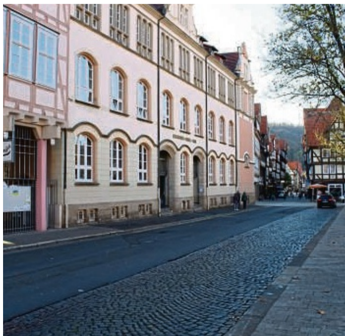
Der Bund hat angekündigt, Förderungen für das Mehrgenerationenhaus zu kürzen.

„Corona hat leider viel kaputt gemacht“, erklärte Görtler. Insbesondere bei Kindern und Jugendlichen merke man, dass diese teils eine wichtige Lebenssituation aufgrund der coronabedingten Einschränkungen verpasst hätten. Michael Lühmann äußerte mit Blick auf das Ehrenamt die Sorge, dass wenige Freiwillige die Hauptlast der Verantwortung tragen müssten. „Wir dürfen uns nicht nur auf das Ehrenamt allein verlassen. Es braucht auch staatliche Strukturen, die das unterstützen. Ehrenamt braucht Hauptamt“, betonte Lühmann. tsz