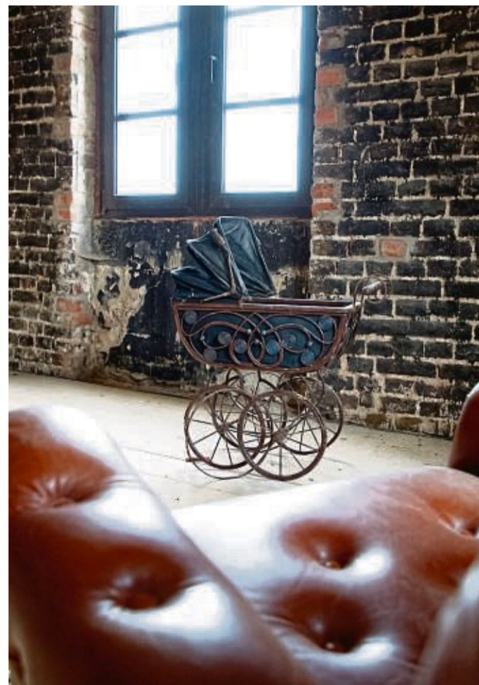
Gilt heute schon wieder als modern: dunkle Ziegel in Verbindung mit Metall und Leder.