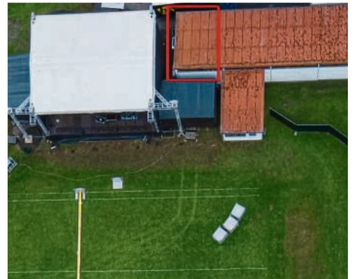
Dieser Teil des Bootshauses soll zurückgebaut werden, um eine größere Bühne zu ermöglichen.