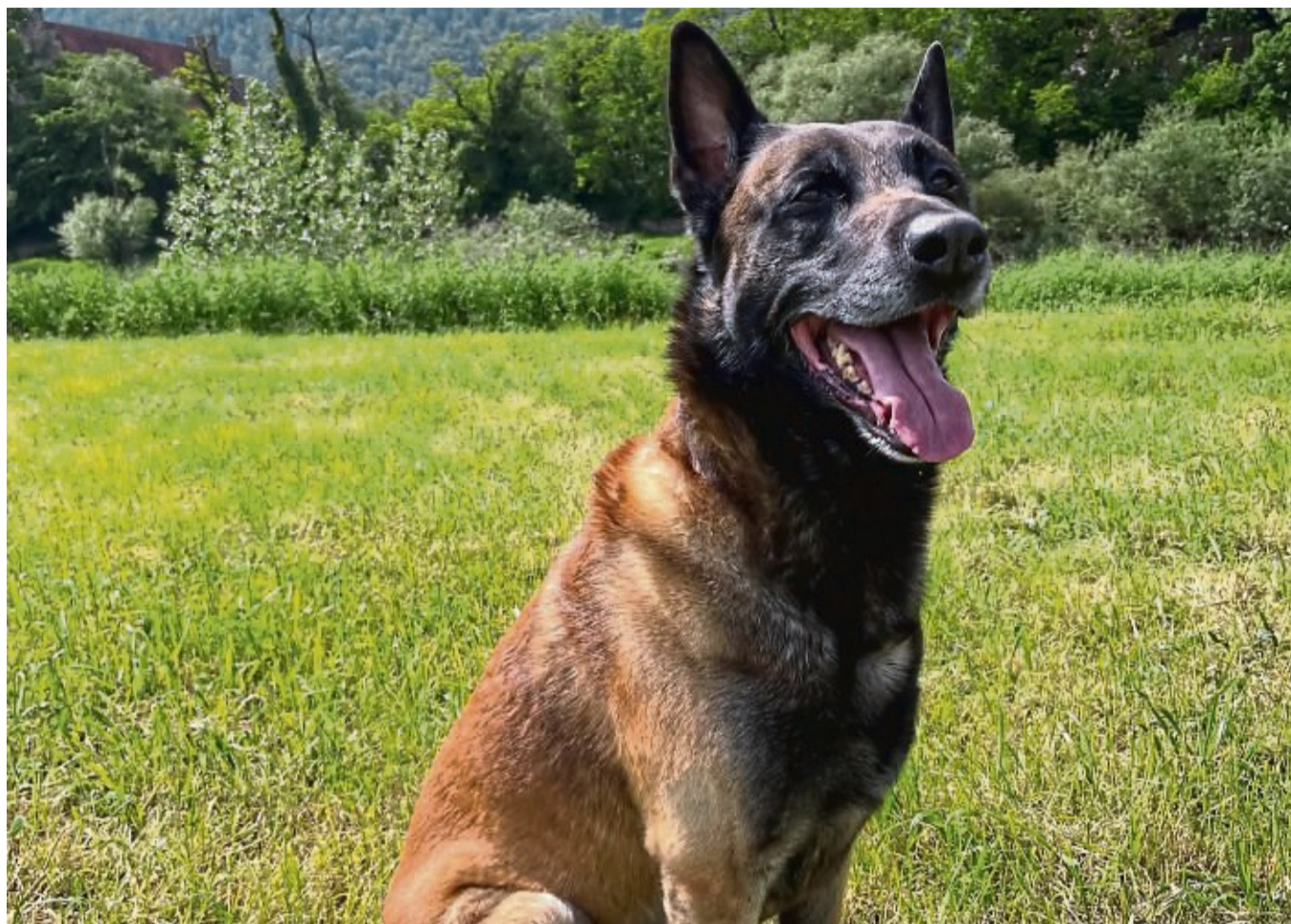
Ordnungsgemäß angemeldet: Hund Jasco auf einem Spaziergang im Umland von Gimte. Die Stadt Hann. Münden berichtet, dass momentan 1837 Hunde im Bereich Hann. Münden und den Ortsteilen angemeldet sind.

Im gleichen Zeitraum seien allerdings auch 24 Hunde wieder abgemeldet worden. Insgesamt seien derzeit 1837 Tiere in der Stadt zur Hundesteuer angemeldet. Im Jahr