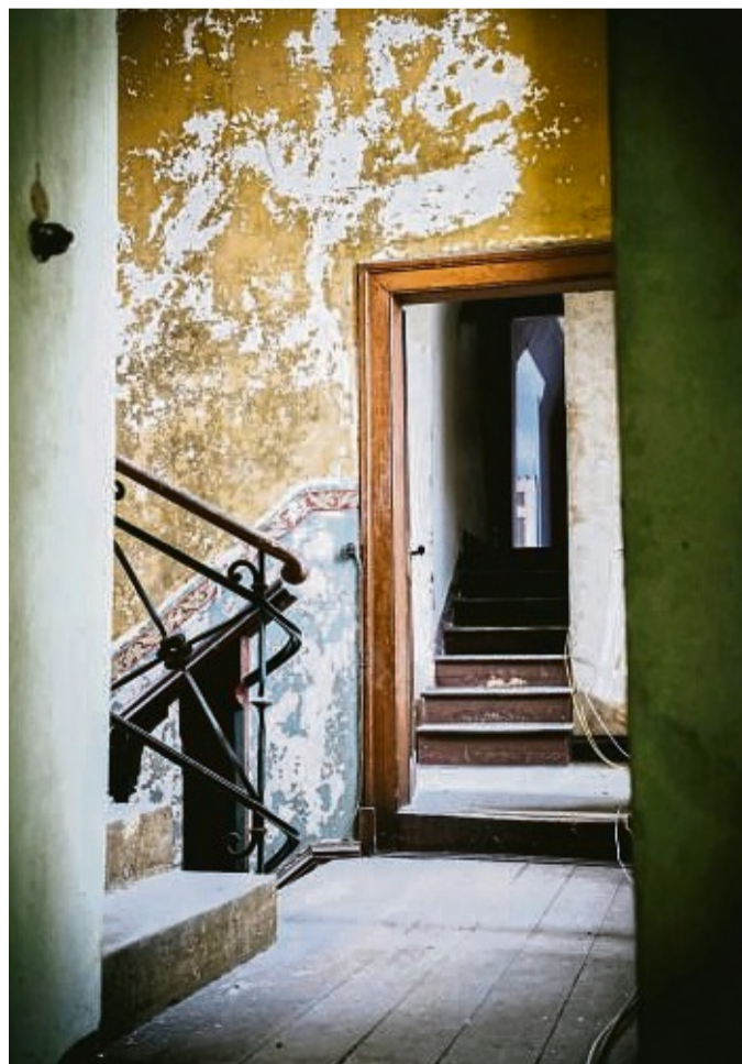
Typisch: Die Schmuckbänder ziehen sich durch Räume und auch Treppenhäuser von Schloss Rothstein.