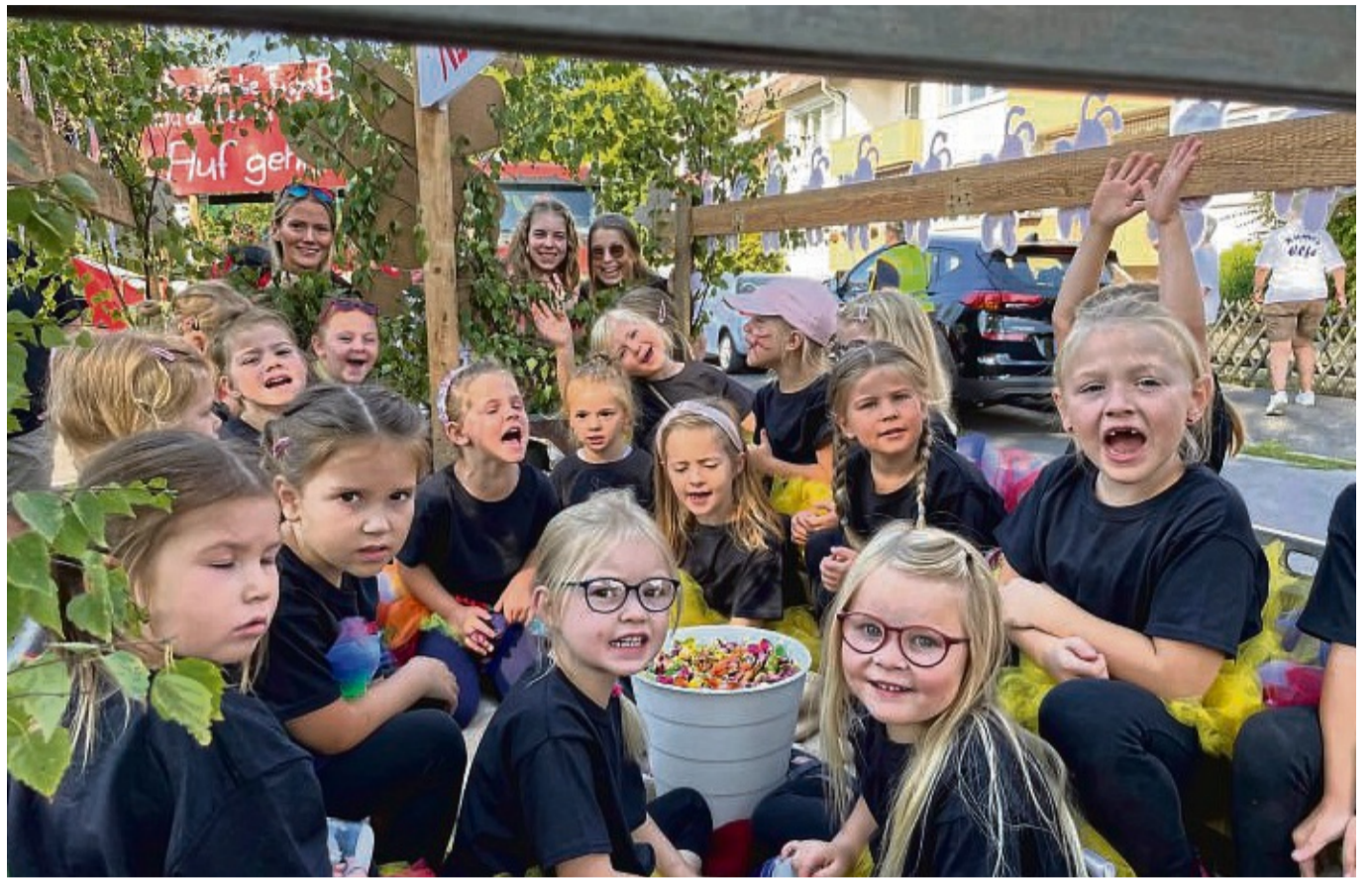
Spaß hatten die Kinder der Garden des Tuspo beim Umzug im Vorjahr.

.Eintrittspreise: Disco (Freitag): 10 Euro (inklusive einem Freigetränk von 2,50 Euro); Samstag: 12 Euro; Frühschoppen: 15 Euro; Superkarte (an allen Tagen gültig): 30 Euro. Im Weserkiosk Kaja Pfaff kann die Superkarte im Vorverkauf erworben werden. zpy