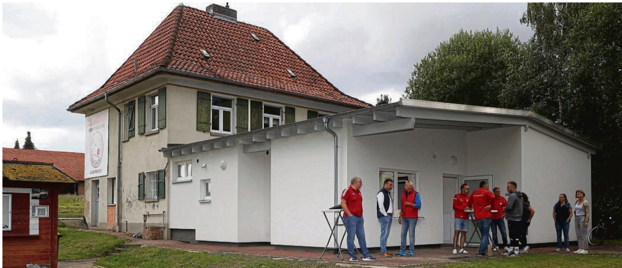
Erweitert: Am etwa 100 Jahre alten Umkleidegebäude des früheren Bundeswehrsportplatzes wurde ein moderner Anbau errichtet, der die Platzverhältnisse deutlich entspannt und eine sinnvolle Nutzung ermöglicht. Ein Verkaufsstand (bald mit Küche) ist nun integriert.

Schlüssel für Anbau am Jahnsportplatzgebäude an Fußballer und Volleyballer übergeben