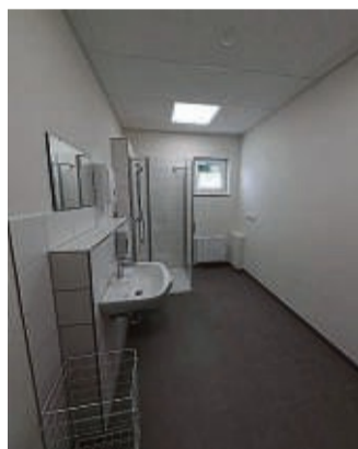
Neu: Schiedsrichterraum, auch noch ohne Möbel

Die für den Herbst 2022 geplante Fertigstellung verzögerte sich durch die schwierige Lage der Baufirmen. Etlliche Arbeiten wurden auch durch den Stadtbauhof erledigt, sodass der Kostenrahmen von 446 000 Euro eingehalten wurde. 50 000 Euro steuerte das Land Hessen bei. Sowohl im sanierten Erdgeschoss als auch im neuen Anbau befinden sich nun moderne Umkleide- und Sanitärräume, die von den Volleyballern des VC Blockfrei und vor allem den Jugendfußballern der TSG Hofgeismar genutzt werden. Das Äußere des Altbaus einschließlich Dach wird demnächst auch noch saniert. Das Obergeschoss wird weiter von Hofgeismarer Pfadfindern genutzt. Keine Diskussion gab es mehr darüber, dass bei der TSG wegen des damals schwächelnden Fußballbereiches zunächst sogar infrage stand, ob man den Neubau überhaupt noch brauche. Stefanie Wiegand vom VC