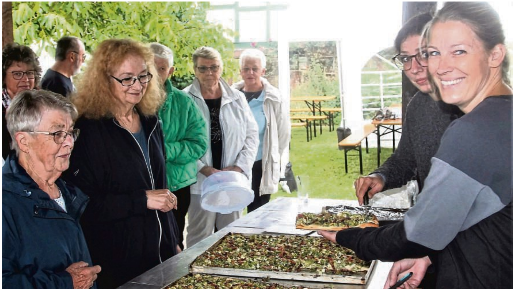
Ansturm auf die leckeren Speisen: Über Mangel an Kundschaft brauchte sich der SV Riede nicht zu beklagen. Der Grüne Kuchen ging weg wie warme Semmeln.

Neben dem Grünen Kuchen ist eine weitere Spezialität des Rieder Backhausfestes das Original Rieder Landbrot. Nicht nur als Laib zum Kauf angeboten, sondern auch in Scheiben geschnitten, mit Grieben- oder Zwiebel-schmalz bestrichen und mit einer sauren Gurke serviert.