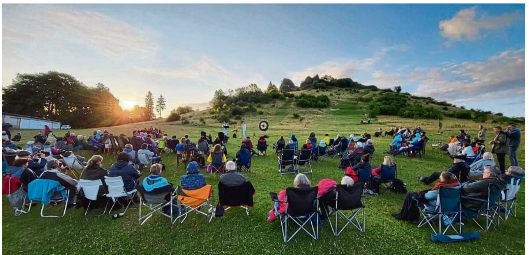
Die Besucher machten es sich am Fuße des Hohen Dörnbergs gemütlich: Vor der malerischen Kulisse fand am Sonntag ein Sonnenaufgangskonzert des Kultursommers Nordhessen statt.

Sie spielten gemeinsam Stücke von Johann Sebastian Bach und Wolfgang Amadeus Mozart. Sprangen in die fran-