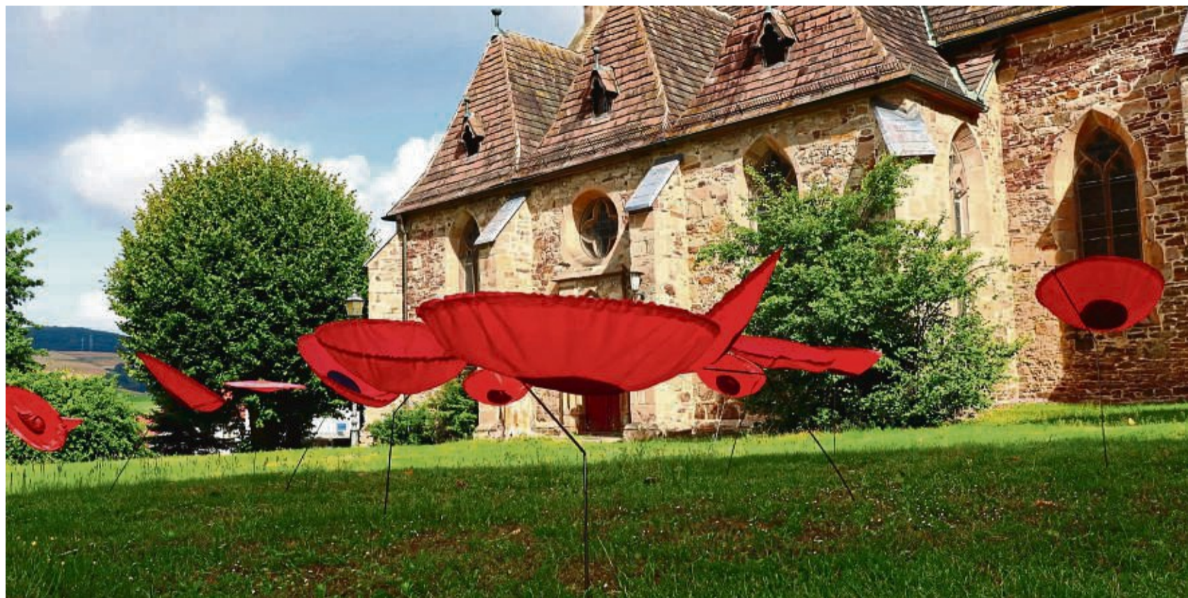
Leuchten in sattem rot: 15 Mohnblumen stehen seit kurzem auf der Wiese vor der Kirche in der Trendelburg. Das Kunstwerk mit dem Titel „Nie wieder“ stammt vom Münchner Künstler Walter Kuhn.

Denn: Die Mohnblume wuchs oft als erste auf den Soldatengräbern. Da sich auch unter dem Kirchvorplatz in Trendelburg Gräber befinden, schien dieser Standort für die 15 Mohnblumen geeignet zu sein, erzählt Goßmann. Mit ihrem kräftigen Rot passen die Mohnblumen vor allem zum Thema