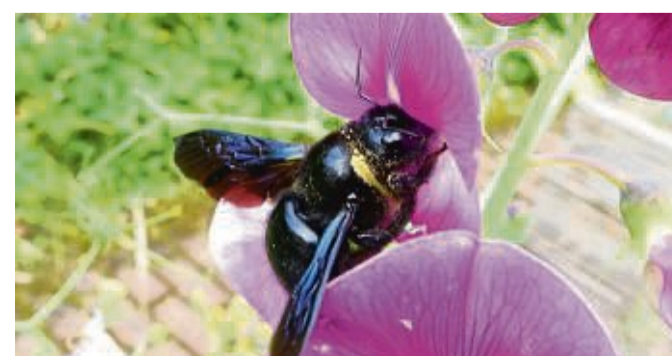
Geflügelte Gäste im Garten jetzt zählen: Blauschwarze Holzbiene an einer Wickenblüte.