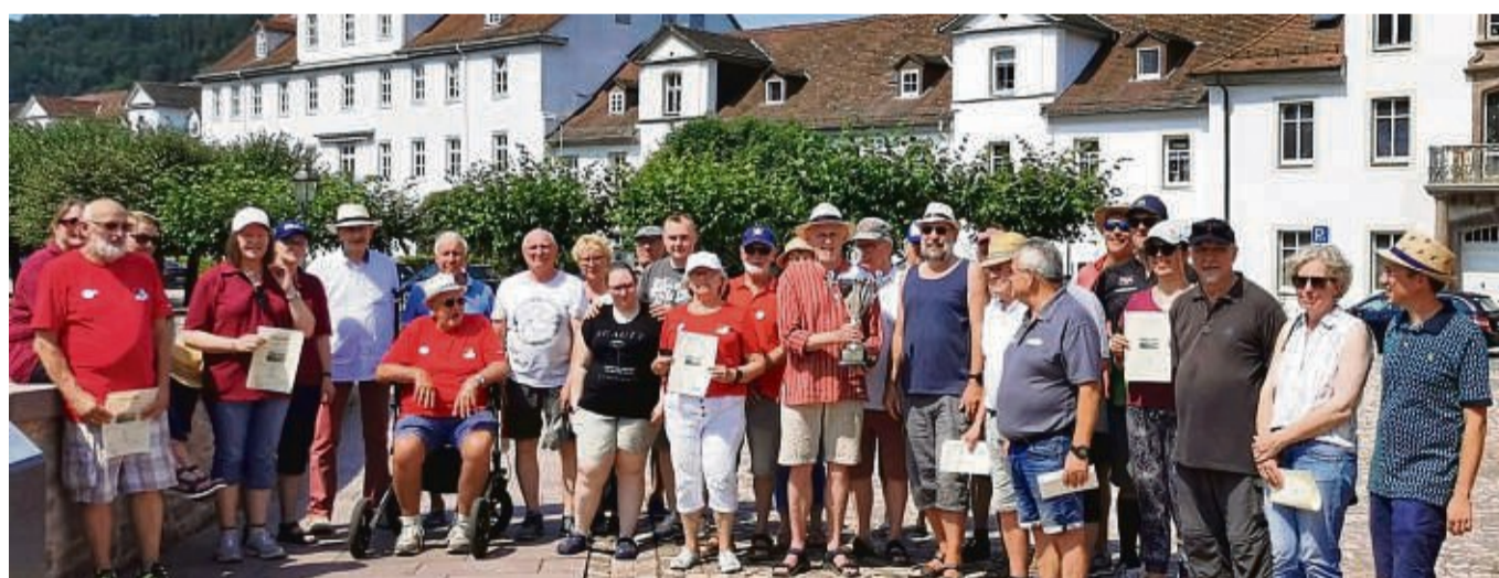
Die zweite Boulestadtsmeisterschaft in Bad Karlshafen lockte wieder viele Teilnehmer an.

Bürgerverein Karlshafen und Helmarshausen lud ein