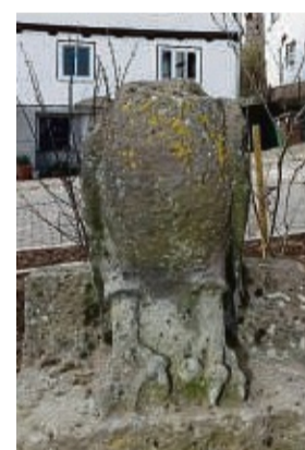
Jahrzehntelang kopflos: Der frühere Wasserspeier kurz nach der Aufstellung vor zwei Jahren.

sem Jahr in der Burgruine Grebenstein brüteten. Mit Unterbrechungen arbeitete sie etwa drei Wochen an der Fertigung des Kopfes, der aus einer sehr harten Sandsteinart besteht, die viel Maschinen- und Muskeleinsatz erforderte. Nach fast 40 Jahren