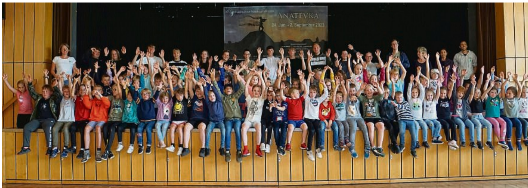
Jubelnd bei den Ferienspielen: Die Kinder hatten bei den diesjährigen Wolfhager Ferienspielen sichtlich Spaß. Auch das stellenweise schlechte Wetter konnte den Teilnehmer nicht die Stimmung vermiesen. Die Spiele wanderten dann von den Teichwiesen einfach in die Stadthalle.