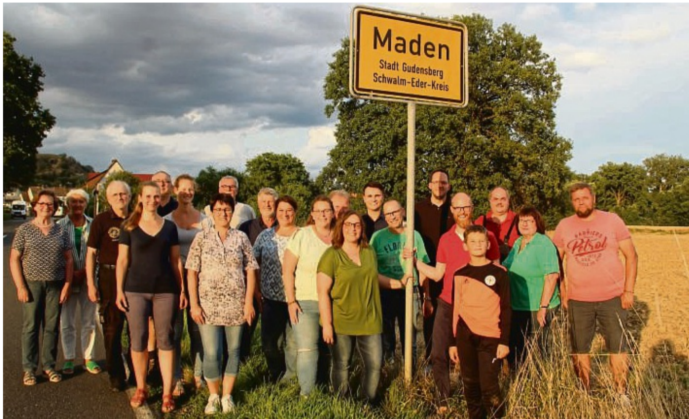
Gemeinsam für Maden: Die Gründungsmitglieder des neuen Vereins „Dorfgemeinschaft Maden“ versammelten sich für ein Gruppenbild am Ortsschild in der Nähe des neuen Dorfgemeinschaftshauses.

„Der Zweck des Vereins ist die Heimatpflege, Heimat-