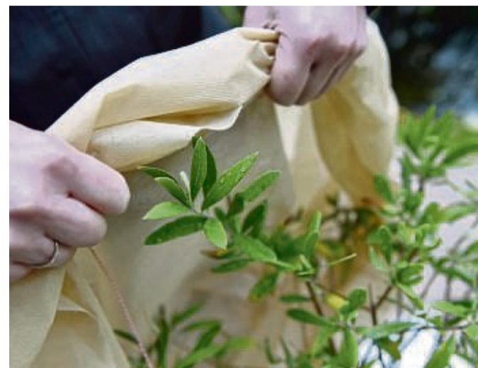
Nicht alle mediterranen Pflanzen kommen mit unserer Winterwitterung klar – man sollte sie also etwa vor Frost mit einem Vlies schützen.

Bei der Auswahl sollte man außerdem beachten, dass die exotischen und mediterranen Pflanzen einen Wasserbedarf haben, der an ihren