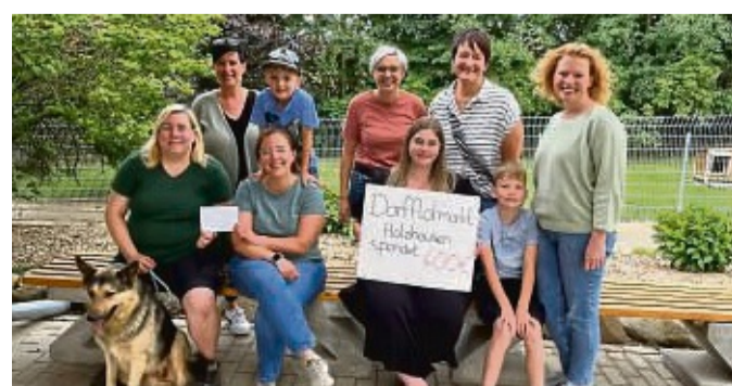
Das Flohmarktteam Holzhausen spendete 1600 Euro: 400 Euro davon gingen an das Tierheim Beuern.

zugute. Eine weitere Spende von 400 Euro ging an den Deutschen Kinderhospizverein. Zusätzlich unterstützt das Team die Freiwillige Feuerwehr Holzhausen. Diese erhielt 800 Euro für die Anschaffung eines neuen Mannschaftsbusses.