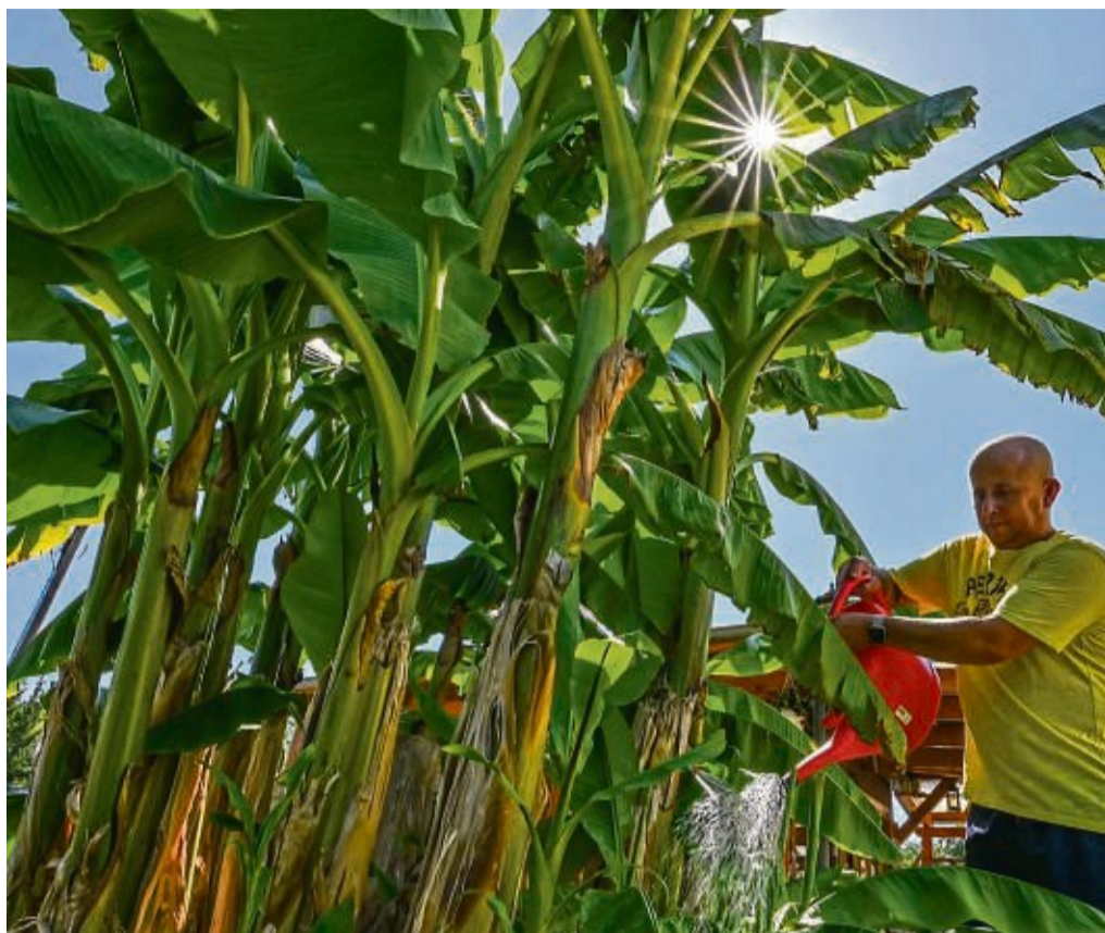
Exoten in unseren Gärten: Werden Bananenstauden hier etwa aufgrund des Klimawandels ein neues Zuhause finden?