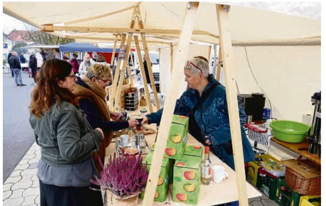
Auf dem Gudemarkt in Gudensberg konnten Kunden Produkte von regionalen Anbietern erwerben.