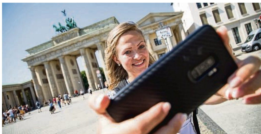
Selfie vorm Brandenburger Tor: Das Smartphone ist für viele auch die Urlaubsknipse.

So attraktiv solche Pflanzen und gegebenenfalls auch ihre Früchte sein mögen, sie sollten nur eine Ergänzung im Garten sein. „Auf keinen Fall sollten sie gegen einheimische Pflanzen ausgetauscht werden, nur weil sie besser mit Hitze und Trockenheit zurechtkommen“, sagt Sven Görlitz. „Im Gegenteil: Es ist spannend zu beobachten, wie sich alle miteinander im Garten entwickeln.“ Aber die Aussage hat auch einen ernsten Hintergrund: Viele Insekten wie Wildbienen sowie Schmetterlinge und ihre Larven sind spezialisiert auf heimische Wildpflanzen, daher hängt ihr Leben davon ab, dass diese weiterhin zahlreich in den Gärten wachsen. Als Ergänzung aber können die „zugezogenen“ Pflanzen eine Bereicherung sein. „Je größer die Vielfalt im Garten, desto besser ist es für Insekten und Schmetterlinge“, so Fink. tmn