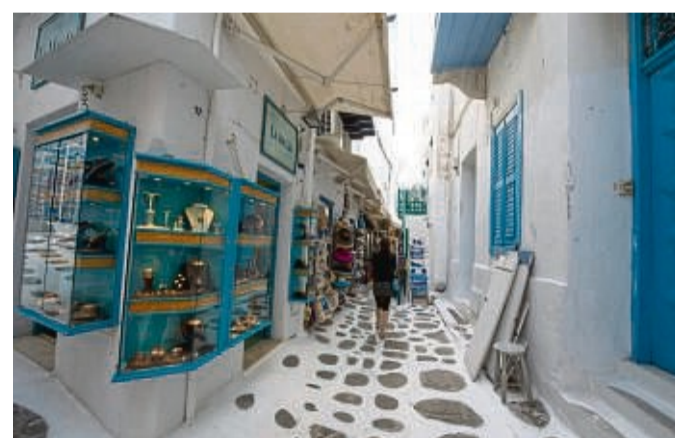
Ist das Urlaubssouvenir kaputt, können Sie reklamieren.