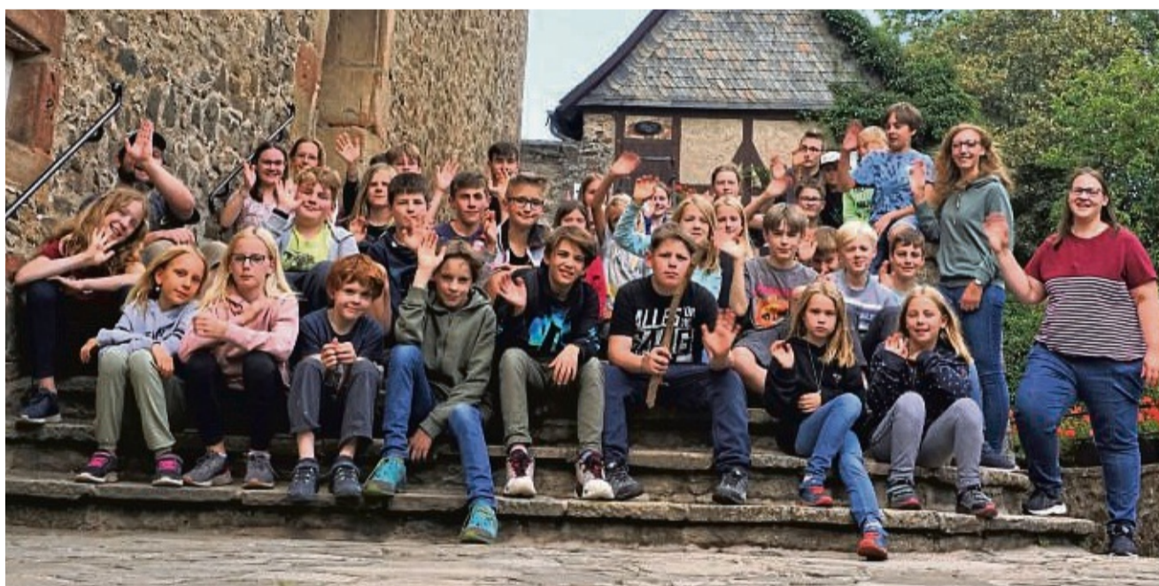
Teilnehmer des Sommerferienprogramms: 8- bis 14-Jährige aus Melsungen und Umgebung.

Nachts gingen die Fledermäuse, die in den Gemäuern schlafen, auf Beutezug. Wer