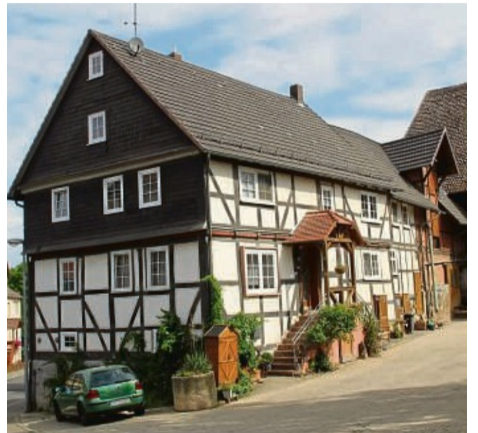
Motiv Bauernhof: Die Bewahrung des ländlich geprägten Ortsbildes ist laut Satzung eines der Ziele des neuen Vereins „Dorfgemeinschaft Maden“. Unser Foto zeigt einen schön herausgeputzten Bauernhof im Ort.

besondere verwirklicht durch Aufarbeitung und Dokumentation der Dorfgeschichte sowie der Dorfverschönerung und Bewahrung des ländlich geprägten Ortsbildes.“ Der neue Verein ist laut Satzung „selbstlos tätig und verfolgt keine eigenwirtschaftlichen Zwecke“. Vorsitzender Günther stellte den Verein als wichtige finanzielle Säule vor für die 1250-Jahr-Feier sowie für weitere Veranstaltungen über das Jahr 2025 hinaus. Durch Veranstaltungen soll die Dorfgemeinschaft gefördert werden „und das gesamte Dorf wieder enger zusammenrücken“, hieß es in der Gründungsversammlung.