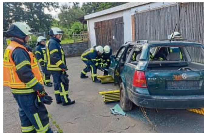
Ein Auto nach einem Unfall: Die Feuerwehrmänner mussten bei der Übung neben dem Löschen eines Brandes auch Menschen aus dem Auto retten.

Aufgrund der vielen Einsatzstellen wurde der Katastrophenschutz-Zug zur Unterstützung alarmiert. Den technischen Teil der Menschenrettung aus dem verunglückten Pkw übernahm die Feuerwehr Wernswig mit ihrem Löschgruppenfahrzeug