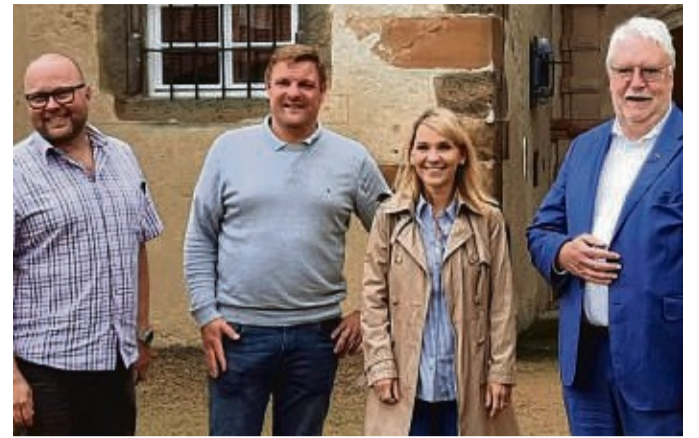
Tauschten sich aus: Bürgermeister Roland Zobel, Landkandidat Ralf-Urs Giesen, Landtagsabgeordnete Wiebke Knell und der Vizepräsident des Hessischen Landtags Jörg-Uwe Hahn.

■ 3. September: Wernswig, Altes Pfarrhaus, An der Raiffeisenkasse 3, 16 Uhr.