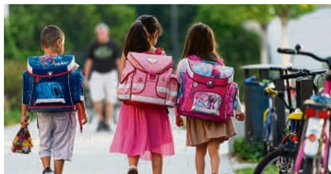
Bevor das Kind erstmals allein zur Schule gehen kann, steht viel Übung auf dem Programm.

Dass 10 000 Schritte pro Tag gut für die Gesundheit seien, kam erstmals 1964 auf, als ein japanisches Unternehmen einen Schrittzähler auf den Markt brachte und den Launch mit einer Marketingkampagne rund um diesen Wert begleitete. Wissenschaftlich fundiert war er nicht, er ist aber auch nicht falsch. Denn auch wenn viel weniger Schritte reichen: Da geht noch mehr. tmn