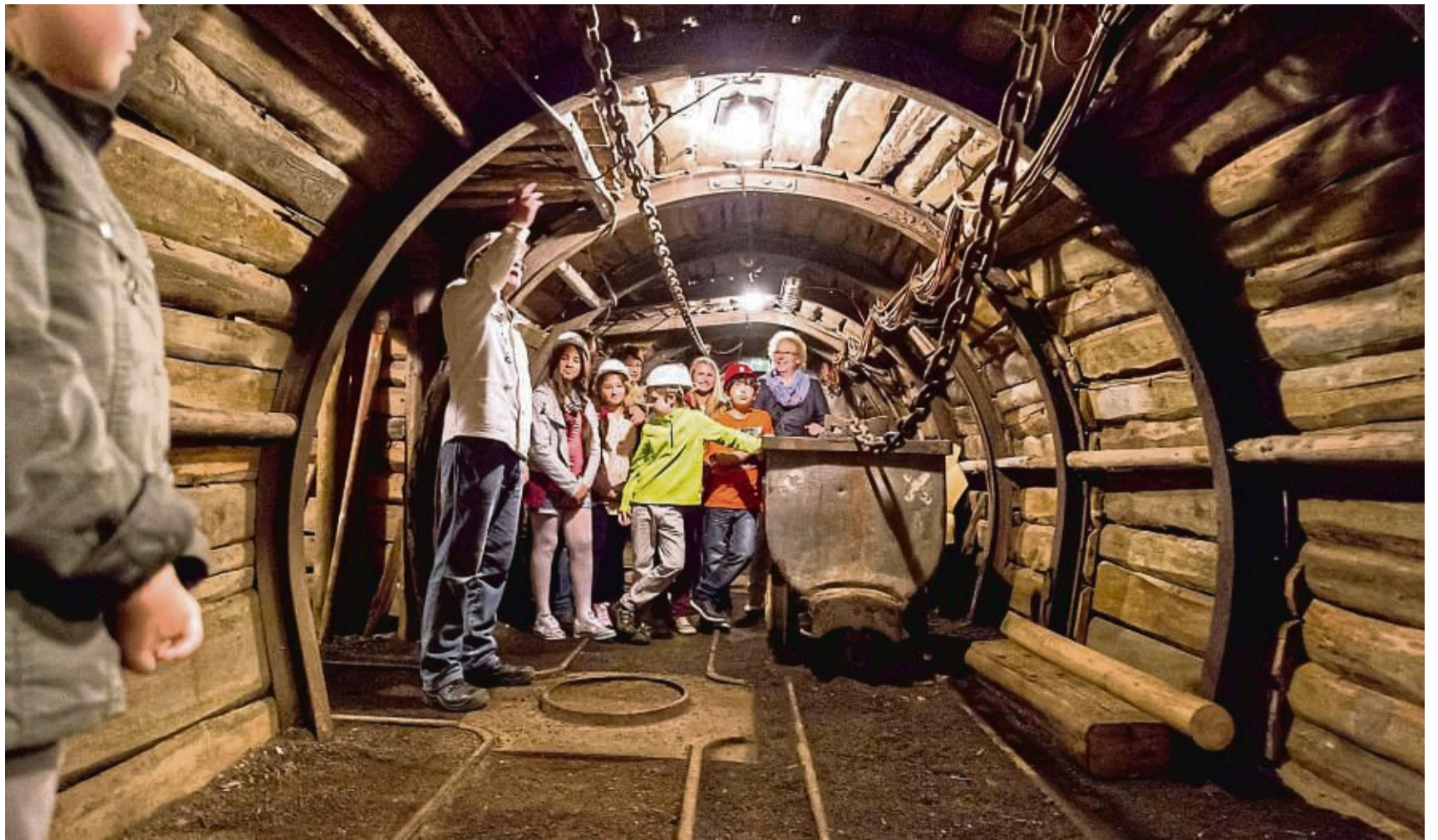
Im Hessischen Braunkohle Bergbaumuseum in Borken können Besucher eintauchen in den Bergbau unter und über Tage.

Anmeldung erforderlich: Anmeldeformular auf blauer-