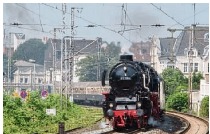
Mit der Schnellzugdampflok 01 1104 von Bebra nach Braunschweig.

ne 119 Euro, Kinder (4-14 Jahre) 89 Euro, ab Kassel-Wilhelmshöhe und Hann-Münden: Erwachsene 114 Euro, Kinder 84 Euro, ab Eichenberg, Göttingen, Northeim und Kreiensen: Erwachsene 109 Euro, Kinder 79 Euro, Aufpreis je Person für die 1. Klasse beträgt 25 Euro. Mehr Infos und Buchung auf der Internetseite eisenbahn-nostalgiefahrten-bebra.de