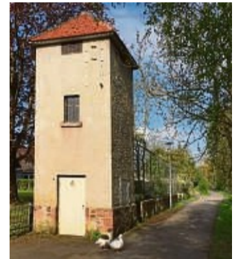
Restauriert und heute eine Ferienwohnung: das Trafohäuschen in Niederurff.