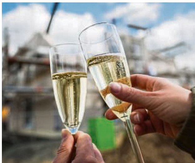
Auf die Familie! Wer ein Eigenheim im Garten der Eltern baut, spart Geld und eine manchmal endlose Suche nach Baugrund.

B augrundstücke sind rar und sie sind teuer. Wer eines sucht, ist manchmal der Verzweiflung nahe. Dabei kann die Lösung direkt vor der Haustür liegen: Warum nicht das große Grundstück der Eltern teilen und dort bauen? „Früher wurden Einfamilienhäuser häufig auf zu großen Grundstücken gebaut“, sagt Christoph Windscheif vom Bundesverband Deutscher Fertigbau. Neben dem Wohnhaus wurde häufig ein großer Garten angelegt. Doch heute genügt vielen zum Gärtnern auch eine kleinere Fläche. Ein Teil des Grundstücks abzutrennen, liegt also nahe – entweder um es den Kindern zu geben oder zu verkaufen.