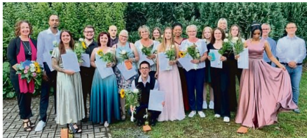
Große Freude: 16 Auszubildende bestehen ihr staatliches Examen in der Pflege.

Erfolgreicher Abschluss des ersten Generalistik Kurses am Asklepios Bildungszentrum Nordhessen