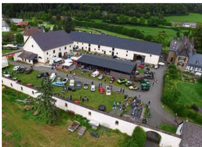
Gut Glindfeld ist der ideale Ort für die Präsentation von alten Fahrzeugen.

Medebach – Der offizielle Oldtimerclub Medebach (OCM) feiert sein 25-jähriges Bestehen am 9. September mit der Hanse Classic Rundfahrt und außerdem mit einem bunten Rahmenprogramm auf: Fachkundige Präsentation von Maschinen und Fahrzeugen; Traktor Pulling und Trial Show; Strohburg und als besondere Highlights werden eine Sonderausstellung mit Schlüter-Traktoren und eine Honda-Goldwing Bike Show geboten. Zur Stärkung gibt es für die Besucherinnen und Besucher Versorgungsstationen mit Getränken aus der Region und klassischen Grillgerichten wie auch Wildspezialitäten vom Gutshof.