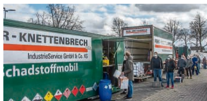
Sondermüll abgeben: Das Schadstoffmobil ist bis zum 28. September in Waldeck-Frankenberg unterwegs.

Bei Laborchemikalien, Konzentraten, Säuren und Laugen sowie PCB-haltigen Kondensatoren liegt die Gesamtannahmemenge bei maximal zehn Kilogramm beziehungsweise zehn Litern, bei Cyaniden und quecksilberhaltigen Abfällen bei einem Kilogramm beziehungsweise einem Liter. Solarthermieflüssigkeit sowie Frostschutzmittel aus Solaranlagen können in der Regel über den Installateur zurückgegeben werden; hier ist die entgeltfreie Abgabe am Schadstoffmobil für private Haushalte auf 20 Liter begrenzt. Flüssige Sonderabfälle dürfen nicht miteinander vermischt werden und sollten nach Möglichkeit im Originalbehältnis mit entsprechender Kennzeichnung am Sammelfahrzeug abgegeben werden. Sie dürfen keinesfalls über