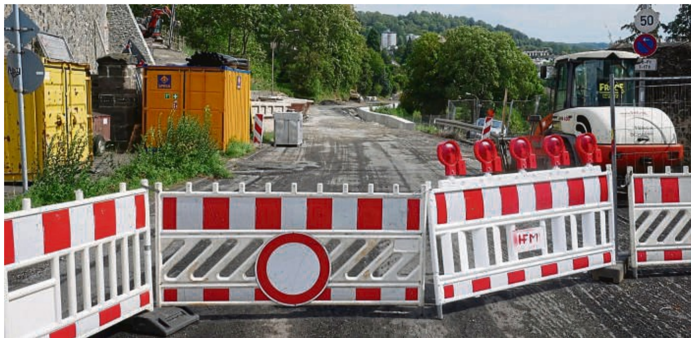
Ein großes Straßenbauprojekt in Homberg: Die Hersfelder Straße ist derzeit für den Verkehr voll gesperrt.

Eine zweite große Baustelle ist die Bundesstraße 323 zwischen Homberg und Remsfeld: Seit Juni laufen dort die Bauarbeiten. Hessen Mobil erneuert die Straße. Zurzeit wird die Strecke von Homberg kommend nach dem Abzweig zur Landesstraße 3254 bis zum Kreis bei der A7 in standgesetzt. Ab Ende Oktober bis voraussichtlich Anfang Dezember sollen sowohl der Kreis bei der Autobahn als auch der Streckenabschnitt vom Kreis zur Landesstraße 3465 saniert werden. Dabei wird der alte Asphalt abgetragen und neu aufgetragen. Die Bankette und Schutzplanken werden ebenfalls erneuert. Und die Wirtschaftswege werden an