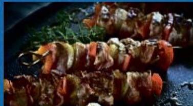
Foodtruck vom Umami Grill und andere Köstlichkeiten