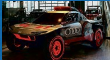
Showcar Audi RSQ e-tron Gen2 (Rallye Dakar Fahrzeug)