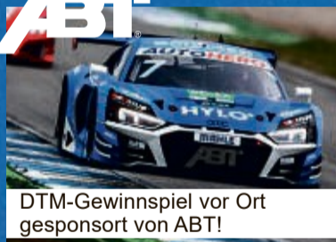
DTM-Gewinnspiel vor Ort gesponsort von ABT!