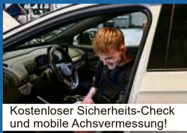
Kostenloser Sicherheits-Check und mobile Achsvermessung!