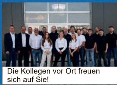
Die Kollegen vor Ort freuen sich auf Sie!

BUNGEE JUMPING aus 60 Meter Höhe Jetzt buchen auf unserer Homepage!