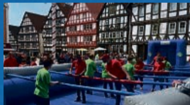
Menschenkicker-Turnier zum Mitmachen mit tollen Preisen