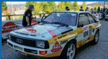
Showcar Audi S1 (Original)