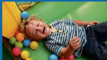
Kinderhüpfburg und andere Attraktionen für die Kleinen