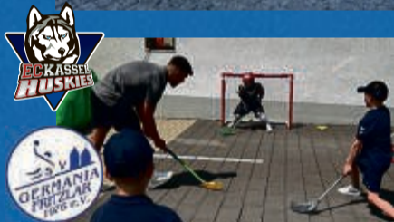
Kassel Huskies am SA und SV Germania Fritzlar am So!