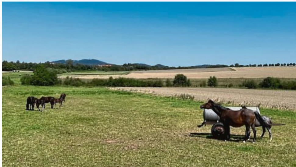
Ohne Schatten und Schutz vor Regen standen diese Pferde längere Zeit auf der Weide. Das vorhandene Angebot an Wasser und Futter wurde nicht bemängelt.

Wolfhager Land – Eine Pferdeherde auf einer Weide bei Wolfhagen hat jetzt für einen Einsatz des Kreisveterinäramtes gesorgt. Die Tiere, darunter Fohlen, waren wochenlang ohne Unterstand der Witterung ausgesetzt. Dies während der Regenperiode und den folgenden Hitzetagen. Ein Spaziergänger hatte die Situation über einen längeren Zeitraum beobachtet und schließlich die Behörde informiert. „Pferde, die ganzjährig oder über einen längeren Zeitraum Tag und Nacht