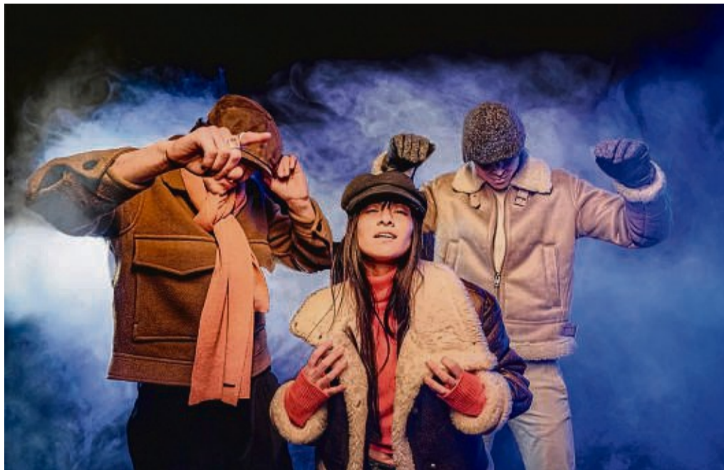
Dauerbrenner mit Schirm: Newsboy Hats, hier von Stetson (l-r: ca. 130 Euro, 99 Euro, 89 Euro).