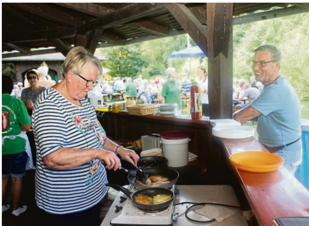
Alles frisch: Beim Kartoffelfest des Heimat- und Kulturvereins Heisebeck an der Teichanlage wurde alles vor Ort zubereitet.