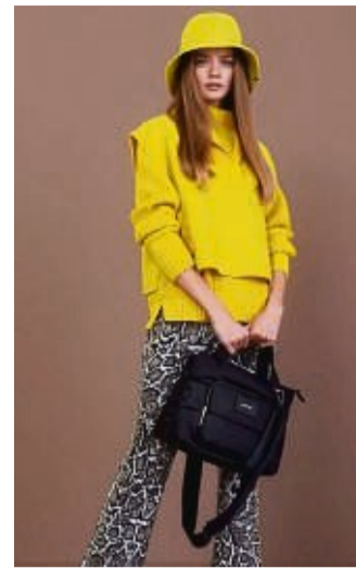
Liegen nach wie vor im Trend: Bucket Hats. Getragen werden sie im Herbst und Winter auch gerne mal in Knallfarben, wie in diesem Kombinationsbeispiel von Marc Cain.