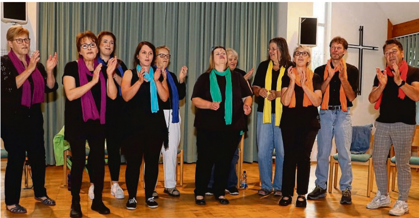
Lebendiges Ensemble: Der Wettesinger Chor „Sound of Gospel“ bereitet sich intensiv auf sein „Herbstfarbenkonzert“ im September vor.