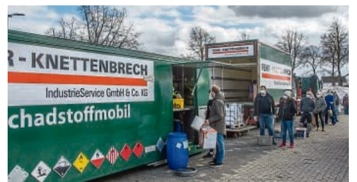
Sondermüll abgeben: Das Schadstoffmobil ist bis zum 28. September in Waldeck-Frankenberg unterwegs.

Donnerstag, 14. September: 11 bis 11.30 Uhr Hesperinghausen, DGH; 11.45 bis 12.15