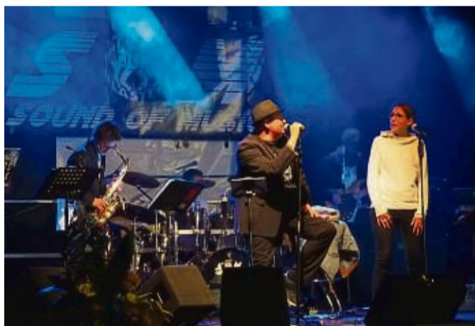
Live Musik am Samstag: Die Formation „Sound of Music“ aus Borken wird ab 18 Uhr auf der Showbühne auftreten.

Am Samstag, 16. September, ab 10 Uhr öffnet die Gewerbebeschau und der Bunte Markt seine Pforten. Die offizielle Eröffnung erfolgt um 11 Uhr an der Aktionsbühne auf dem Ausstellungsgelände. Von 12 bis 17 Uhr findet auf der Aktionsbühne ein abwechslungsreiches Rahmenprogramm statt. Bis 18 Uhr präsentieren die teilneh-