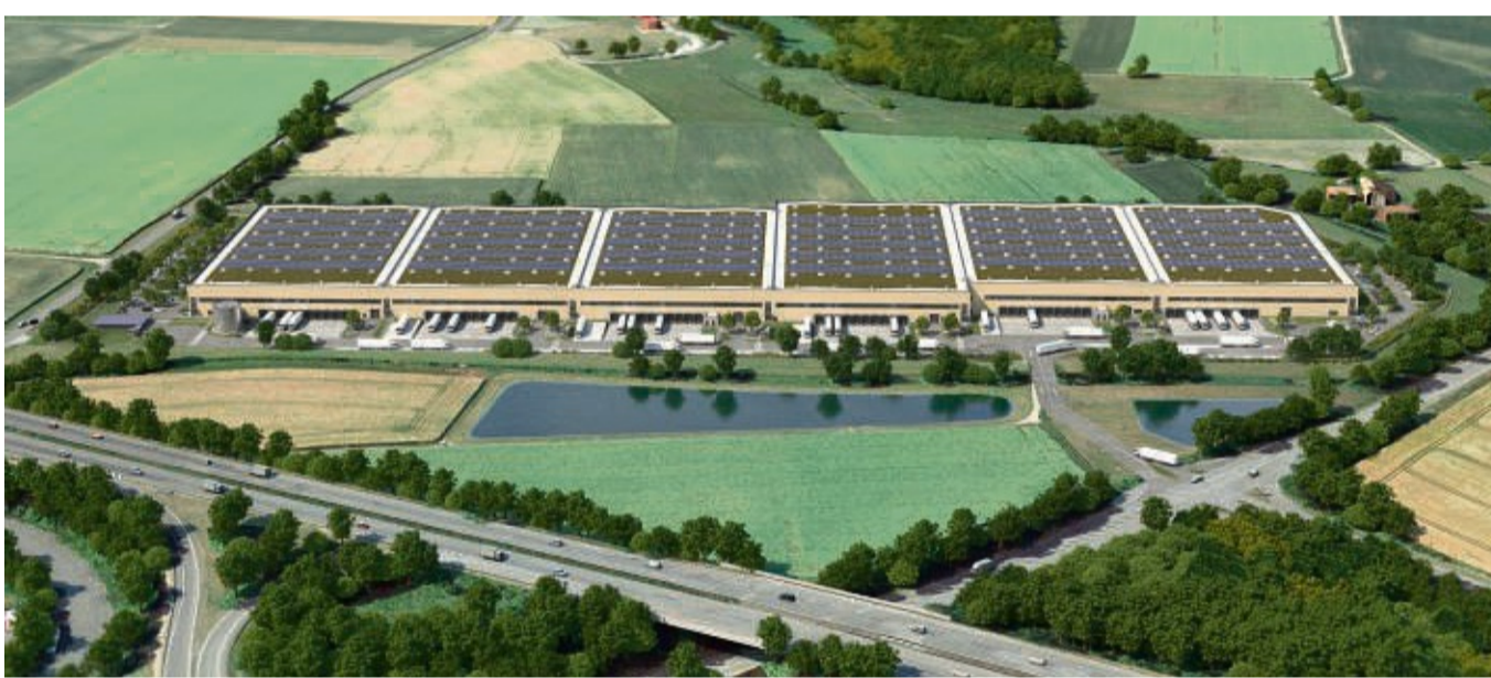
So soll der Logistik-Park Diemelstadt einmal aussehen: Sechs unabhängig von einander nutzbar Hallen werden über eine Ampelkreuzung an der Autobahnauffahrt an die B 252 angeschlossen.

„Scannell Properties wird auf dem Grundstück ein Logistikprojekt mit bis zu 68 000 Quadratmeter für potenzielle Mieter erstellen. Der Standort Diemelstadt ist hervorragend an die Wirtschafts-