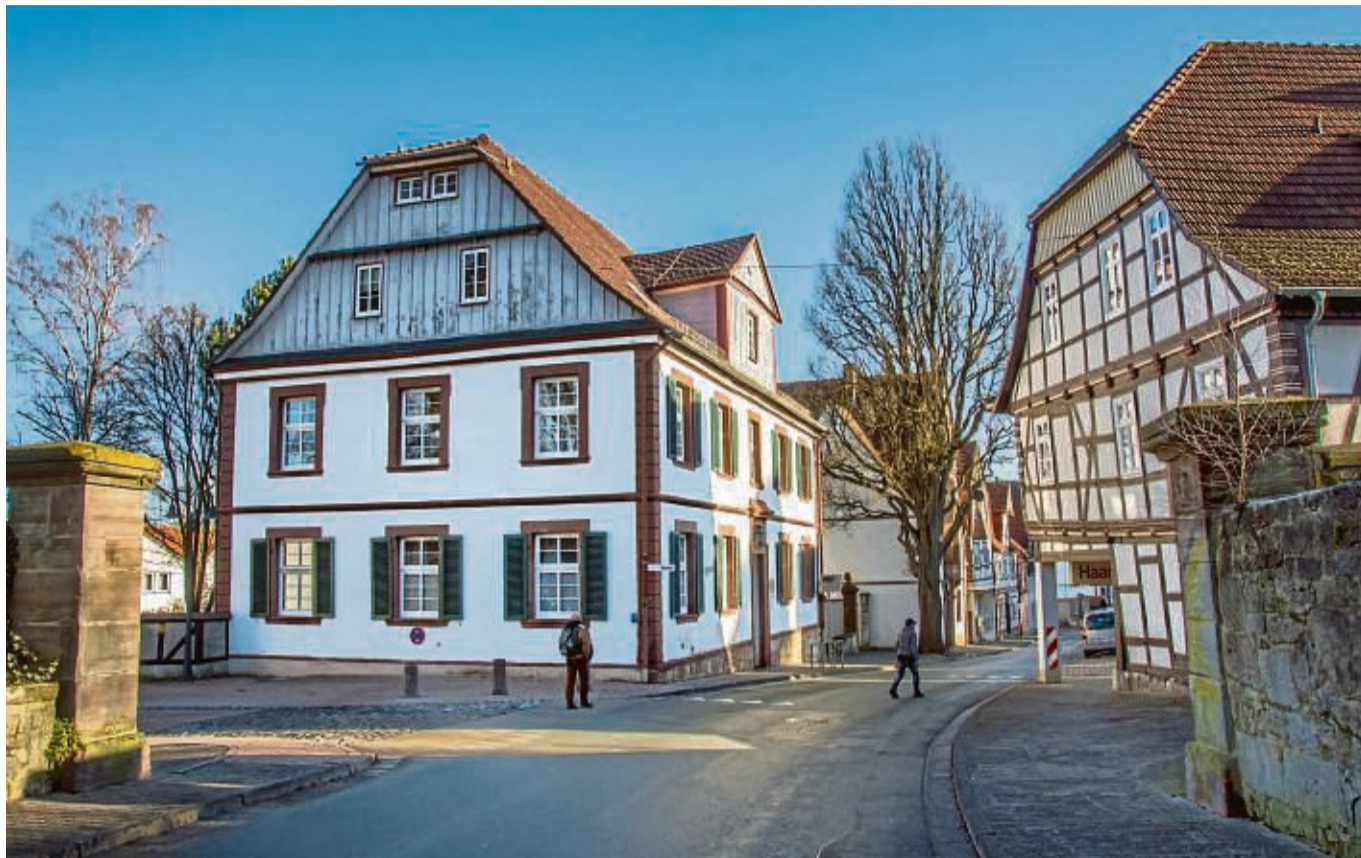
Haus der Musik: Dort, aber zum Beispiel auch in Kitas, bietet die Korbacher Musikschule verschiedene Kurse an. Anmeldungen für das neue Schuljahr sind ab sofort möglich.

■ Früherziehung: Das Angebot der musikalischen Früherziehung richtet sich an Kinder im Alter von vier bis sechs Jahren. In einem zweijährigen Kurs singen und musizieren die Kinder auf elementaren Instrumenten (Triangel, Klanghölzer, Stabspielen usw.).