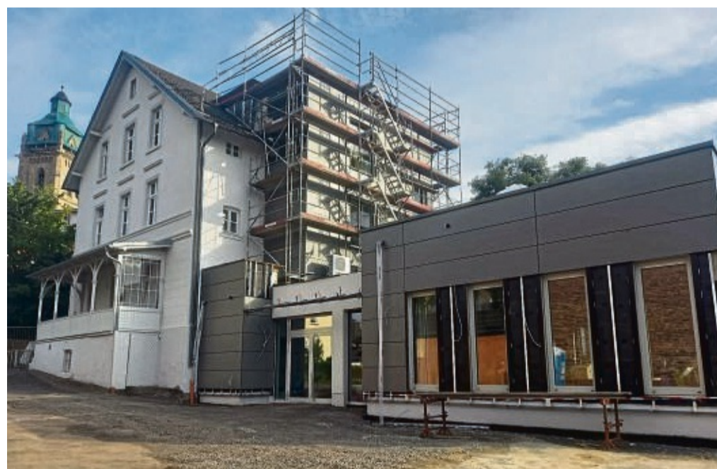
Die Sanierung ist abgeschlossen: Im Musikschulhaus in der Poststraße beginnt in der kommenden Woche wieder der Musikschulunterricht.

Samstag, 7. Oktober: Um 19 Uhr gibt der Gitarrist und Dozent der Kasseler Musikakademie, Boris Tesic, ein Gitarrenkonzert mit dem Titel „Vi-