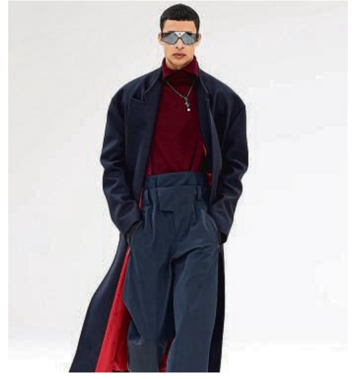
Jetzt häufig als Farbtupfer in Looks zu sehen, die ansonsten in dunklen Tönen gehalten sind: Rot. Hier ein Beispiel von Ferrari (Mantel ca. 2300 Euro, Rolli ca. 590 Euro, Hose ca. 1150 Euro, Brille ca. 1150 Euro).