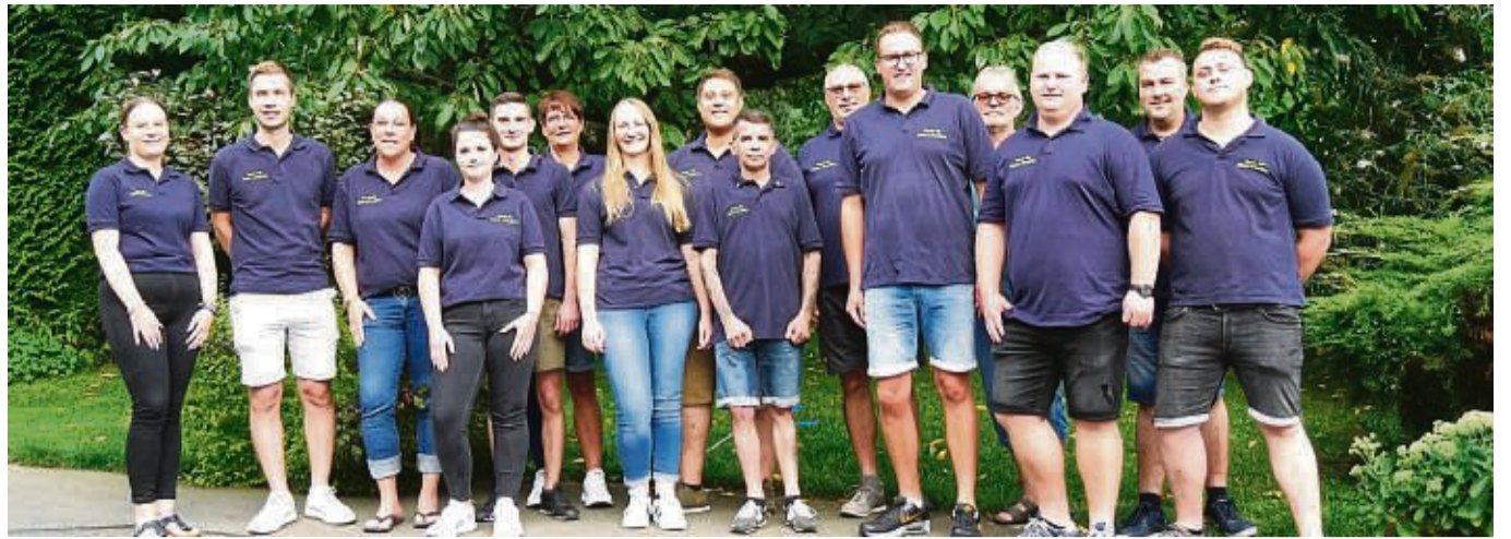
Voller Vorfreude auf das Fest: die Aktiven des Vereins für Kultur und Tradition, die das Heimatfest in Grebendorf ausrichten.

AWO Essen auf Rädern Täglich heiß geliefert!* *im Liefergebiet Jetzt bestellen! ☎ 0800 3403440