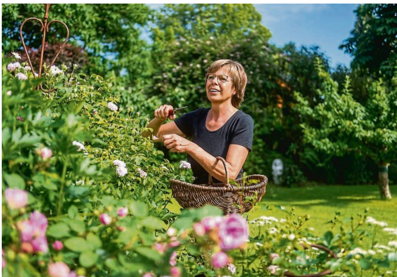
Gut geschnitten ist halb gepflanzt: Mit Stecklingen können Hobbygärtnerinnen und -gärtner auch nach der Wachstumsperiode noch Nachwuchs generieren.

Je nach Pflanzenart sind Stecklinge daher unterschiedlich lang, bei sogenannten wüchsigen Pflanzen sind etwa länger als die von langsam wachsenden.