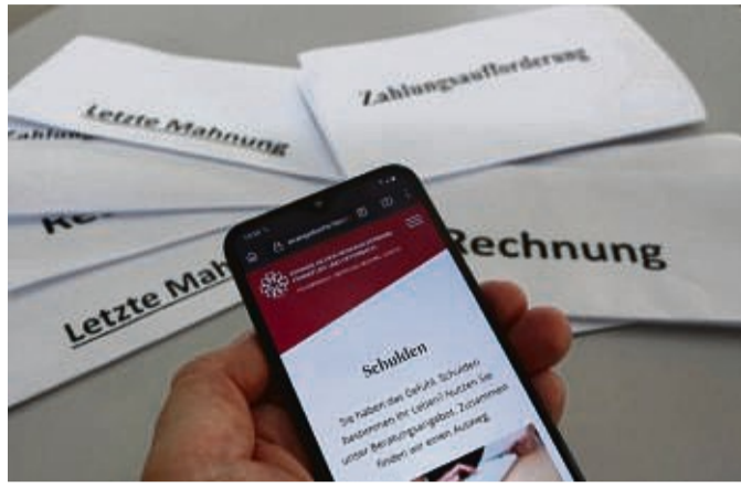
Die AWO-Schuldnerberatung bietet eine monatliche Sprechstunde an.

Zur besseren Koordination sind Terminvereinbarungen unter der Telefonnummer 0 56 51/30 76 25 oder 0 56 51/30 76 26 wünschenswert. Die Sprechstunden des laufenden Jahres finden an folgenden Terminen statt: 11. Septem-