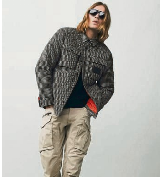
Taschen auf der Hose, Taschen auf der Brust: Workwear-Elemente spielen derzeit eine große Rolle. Hier ein Kombinationsbeispiel von Replay (Hose ca. 109 Euro, Jacke ca. 269 Euro, Sweatshirt ca. 149 Euro).