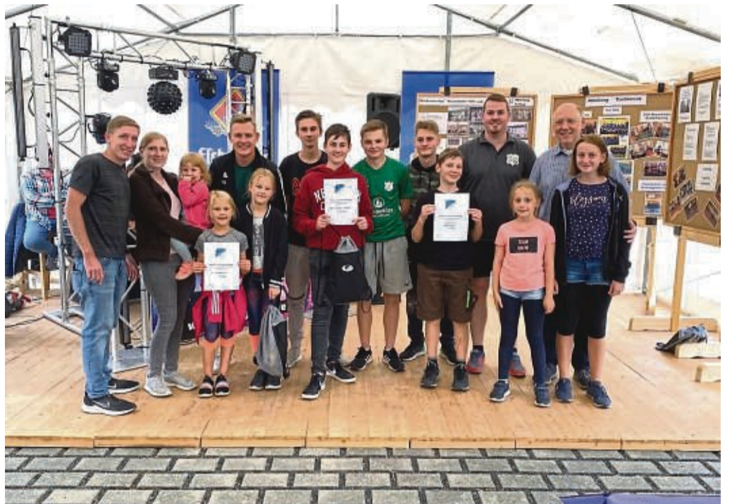
Aus dem Archiv: Unser Bild zeigt die Siegerehrung der Freizeit-Olympiade in Nesselröden im Jahr 2022.

Am Samstag, 9. September, beginnt der Tag um 13 Uhr mit der Freizeit-Olympiade für jedermann. Dabei treten verschiedene Teams in unterschiedlichen Spielen – zum Beispiel Kartenlauf, Zielschießen und Hockey-Slalom – gegeneinander an und stellen ihre Geschicklichkeit, Cleverness und Ausdauer unter Beweis. Wie es der Name schon sagt, ist für jeden etwas dabei und ganz wichtig sind natürlich diejenigen, die anfeuern, mitfiebern und im Anschluss mit den Teams gemeinsam feiern. So findet um 18 Uhr die Siegerehrung und eine Mini-Disco statt.