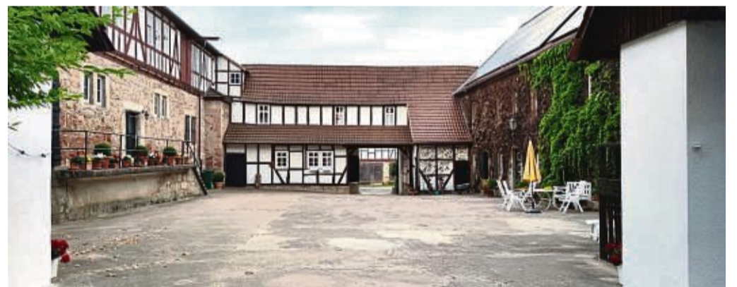
Im Innenhof des Landgrafenschlosses wird das Open-Air-Kino aufgebaut.