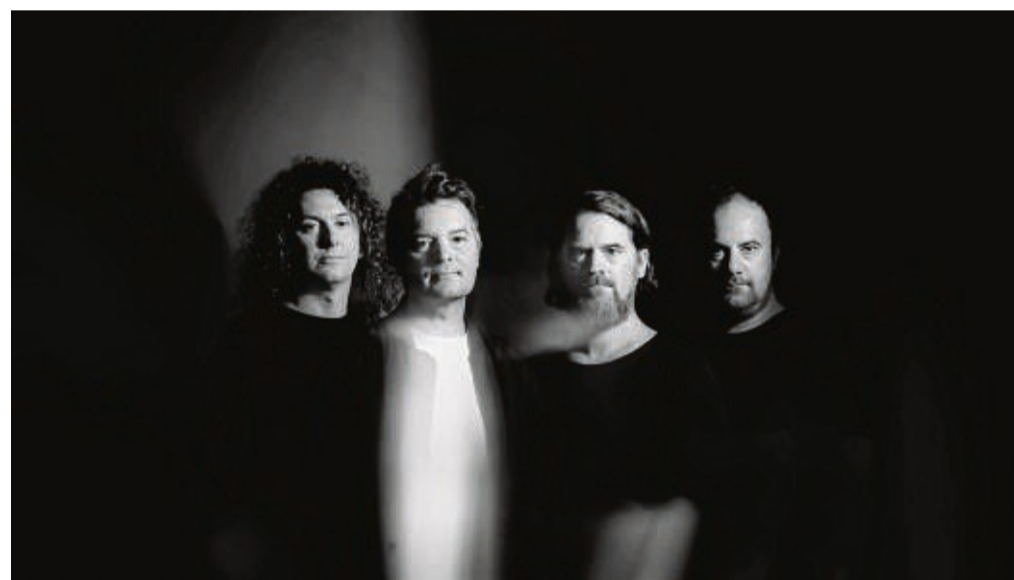
Spielen beim Open Flair 2024: Die Hip-Hop-Band Deichkind (links) aus Hamburg und die Indie-Rock-Band Madsen aus Prießbeck im Wendland. Sie werden beim 40. Jubiläum des Eschweger Kult-Festivals neben anderen Bands das Werdchen und die Seebühne rocken.