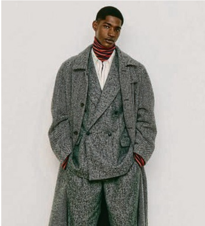
Der Zweireiher feiert derzeit ein Comeback. Hier ein Kombinationsbeispiel von Gant (Wollmantel ca. 750 Euro, Rollkragen-Shirt ca. 90 Euro, Hemd ca. 150 Euro, Oversized-Blazer ca. 500 Euro, Hose ca. 300 Euro).