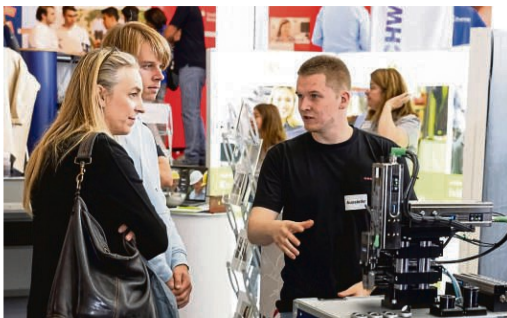
An den Ständen können die Besucher mit Auszubildenden ins Gespräch kommen und aus erster Hand erfahren, worauf es ankommt.

Die Ausbildungsbörse Schwalm-Eder findet am Samstag, 16. September, von 9 bis 15 Uhr im Hotel am Stadtpark in Borken (Hessen) statt. nh