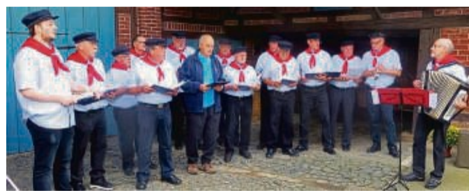
Der Shantychor „Luv und Lee“ aus Römersberg war einer der beiden Chöre, die den Gästen einen Einblick in ihr Können gaben.