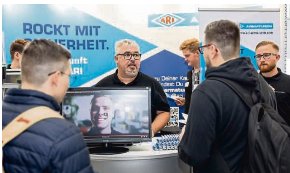
Mehr als 100 Ausstellende aus der Region präsentieren sich auf der Ausbildungsbörse Schwalm-Eder.