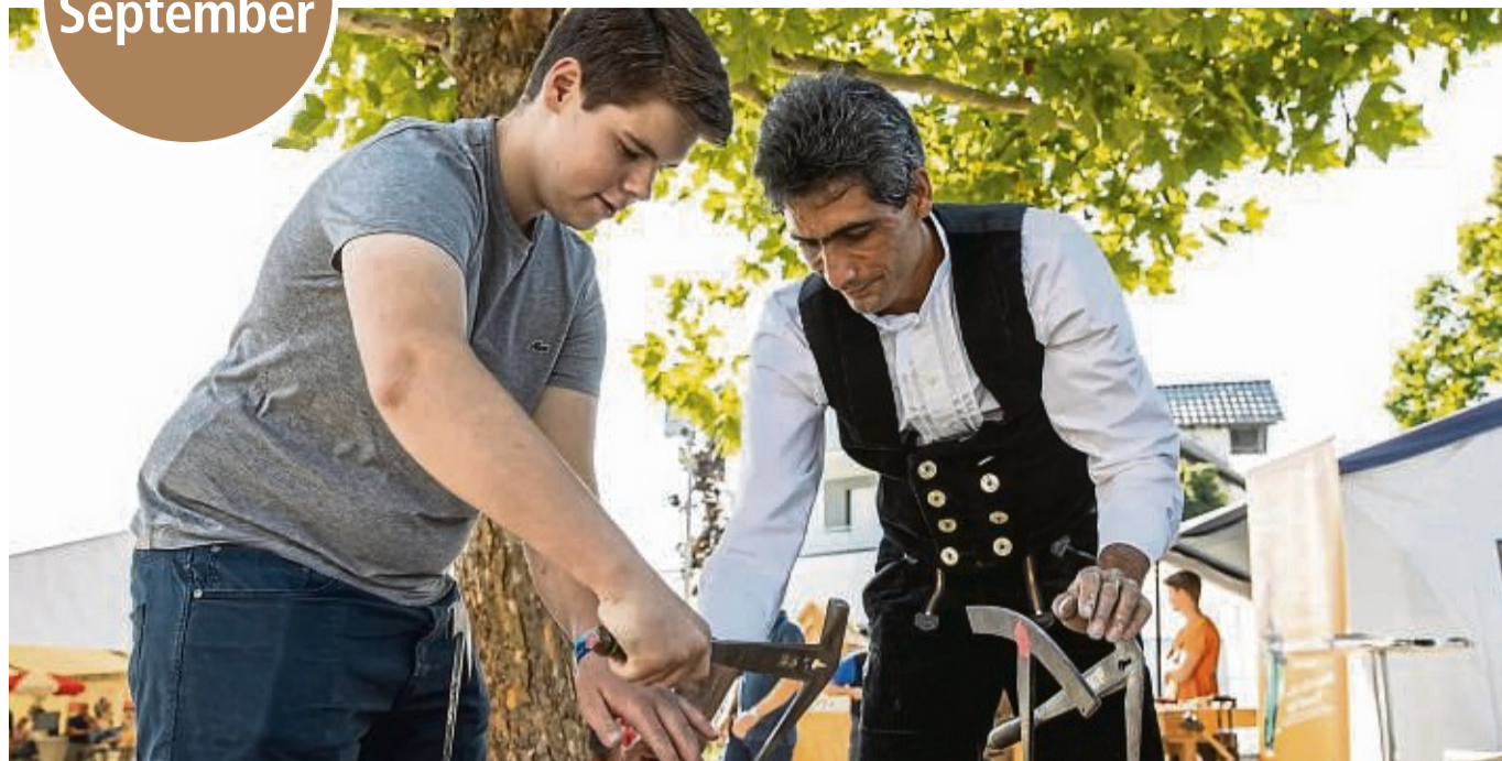
Auf der Ausbildungsbörse Schwalm-Eder kann man Ausbildungsberufe hautnah erleben.