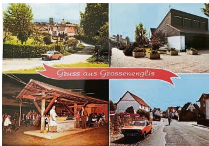
Zierte eine Postkarte in den 1980er-Jahren: die 1977 errichtete Grillhütte (unten links).