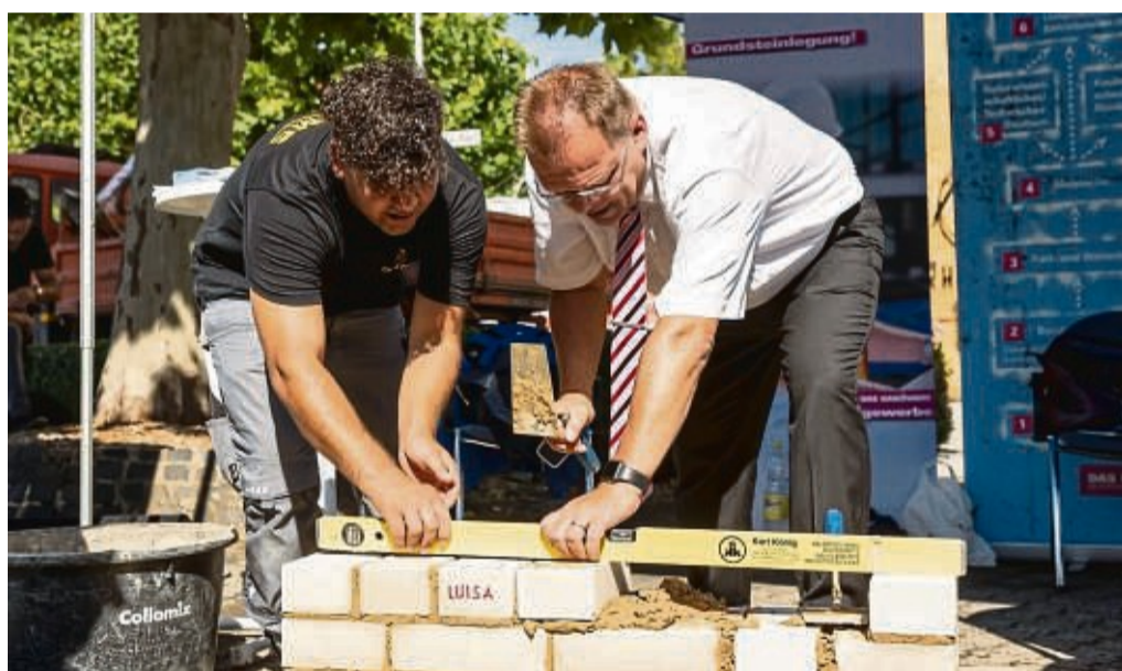
Anpacken und ausprobieren: Die Ausbildungsbörse Schwalm-Eder bietet nicht nur Informationen, sondern vor allem die Gelegenheit für persönliche Kontakte und individuelle Beratung.