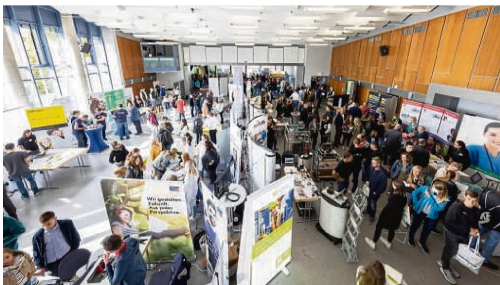
An den zahlreichen Ständen kann man sich über das Ausbildungsangebot in der Region informieren, Fragen stellen und erste Kontakte knüpfen.

Ein wichtiger Teil der Ausbildungsbörse sind aber auch die vielen Beratungsangebote. Agentur für Arbeit, Jobcenter, Industrie- und Handelskammer, Kreishandwerkerschaft, verschiedene Bildungsträger oder die Einstellungs- und Karriereberatung großer Arbeitgeber – sie alle bieten viel mehr als Ausbildungsstellen.