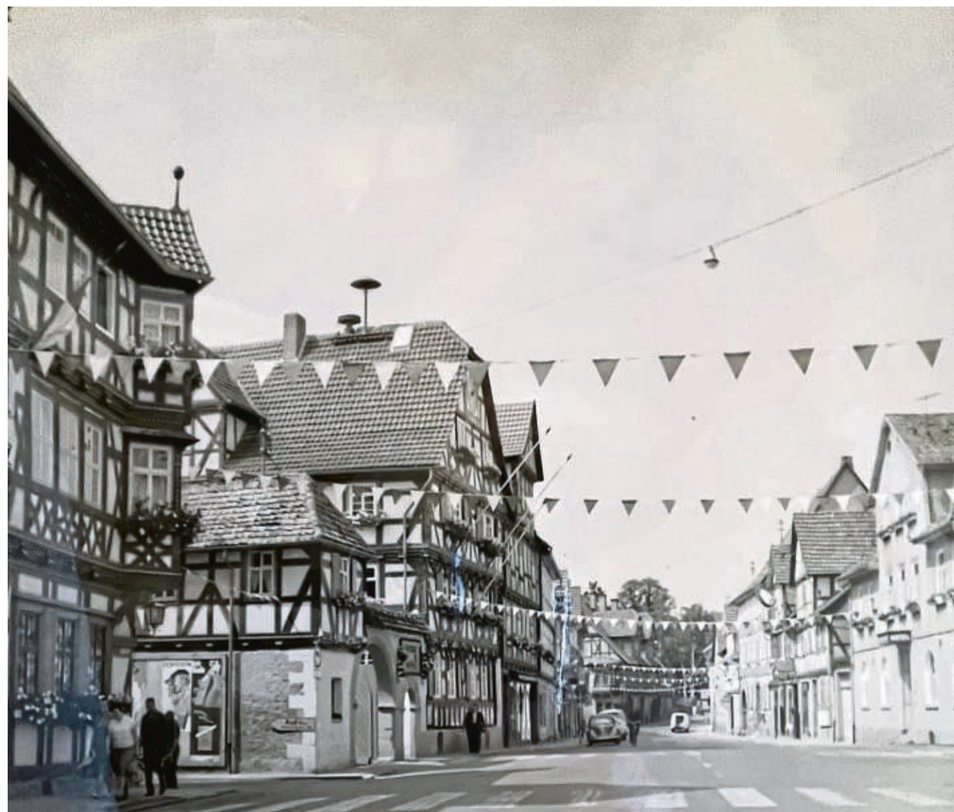
Historische Bilder wie dieses werden für die Fotoausstellung gesucht. Von Interesse sind auch neuere Bilder. „Alles ist erlaubt, was die Marktstraße zeigt“.