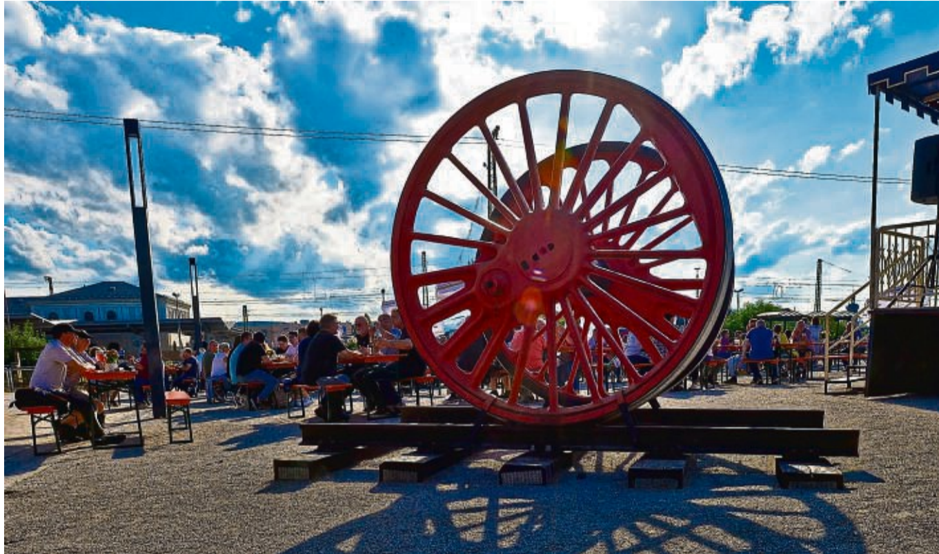
Der Biergarten am Lokschuppen wird am Tag der Schiene während des Bahnhof-Jubiläums in Bebra sicher wieder viele Gäste anziehen.