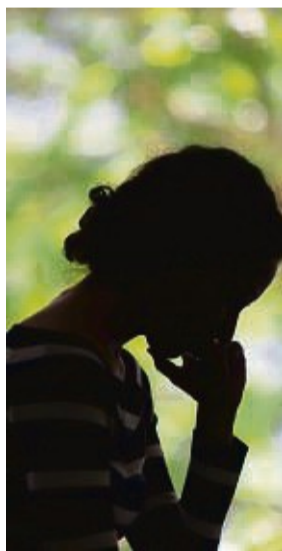
Wenn ein geliebter Mensch stirbt, müssen die Angehörigen einige Formalitäten erledigen.

Setzen Sie sich mit einem Bestattungsinstitut Ihrer Wahl in Verbindung und melden Sie den Todesfall. Wer sich der Kirche ver-