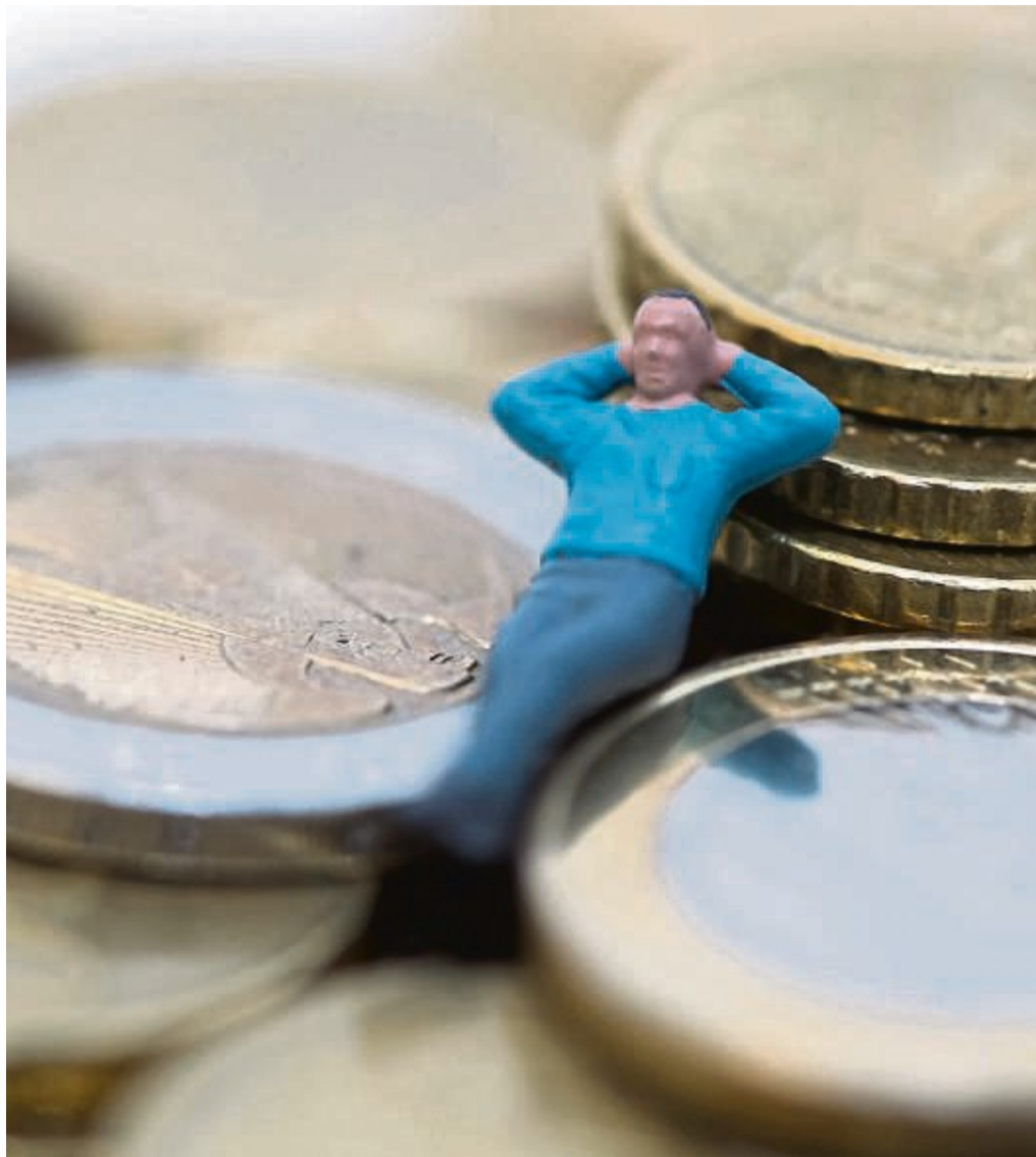
Fühlen Sie sich umgeben von Geld wohl? Dann haben Sie vermutlich ein positives Money Mindset.

Ein erster Schritt kann sein, das Negative gedanklich ins Positive umzuwandeln. Dann könnte es etwa heißen: „Ja, ich werde reich, wenn ich es clever angehe und Ausdauer habe.“ Oder: „Hey, Geld