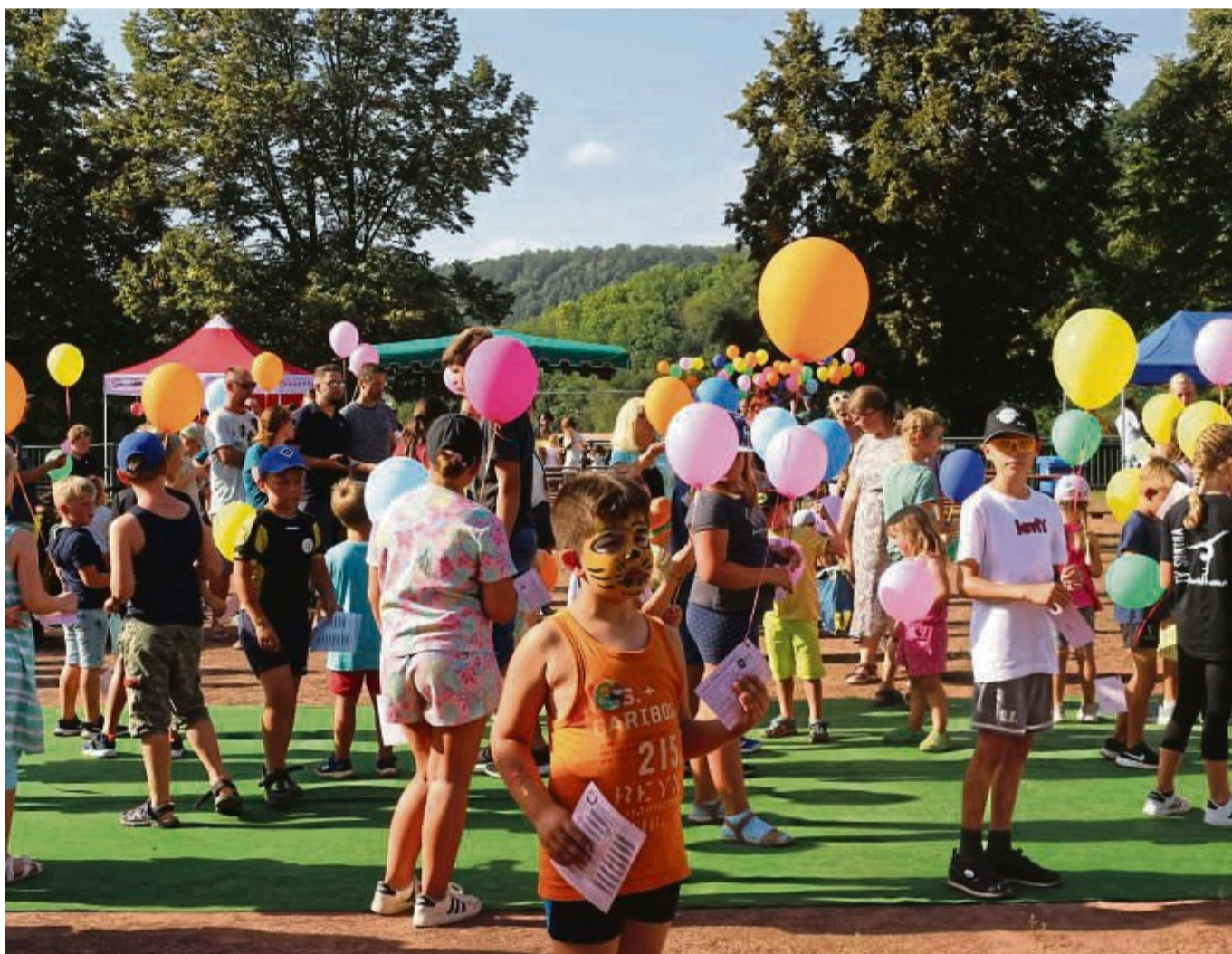
Höhepunkt des Familientags: Beim Luftballonwettbewerb ließen alle Kinder bunte Ballons in den Sontraer Himmel steigen.

Die Kinder der Kindertagesstätte „Wiesenwichtel“ aus Ulfen sorgten nach einem musikalischen Auftritt auch gleichzeitig für eine angenehme Abkühlung, als sie mit Wasserspritzern ihre Eltern nassmachen durften. Bei der Tanzvorführung des TV Sontra wurde es schweißtreibend, denn die Tänzerinnen zeigten eine beeindruckende Choreografie. Die Evangelische Kindertagesstätte lud zum Mitsingen von Kinderliedern ein, und die Nachwuchsgruppe der Tanzgarde Heyrode tanzte wie „Cowboys und Indianer“. Bekannte Mitmach-Songs präsentierte Patricia bei der Kinderdisco. Als Höhepunkt ließen alle Kinder beim Luftballonwettbewerb