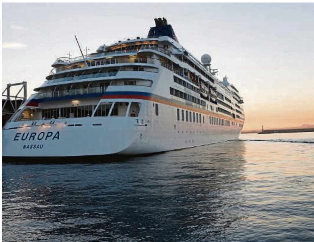
Wer sich auf einem Kreuzfahrtschiff total daneben benimmt, wird womöglich am nächsten Hafen von Bord verwiesen.

Grundsätzlich sind Regelverstöße ein Problem: Das Rauchen in der Kabine zum Beispiel, was bei allen Reedereien verboten ist. Das führt nicht sofort zum Rauswurf. Aber wenn ich nach der dritten Ermahnung weiter rauche, dürfte mich die Reederei