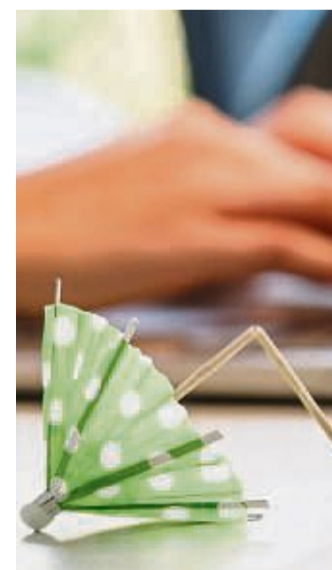
Wenn der Urlaub ins Wasser fällt: Schlechtes Wetter am Zielort ist kein Grund für eine Preisminderung bei Pauschalreisen.

Die Kläger erhielten so nur 800 Euro erstattet, weil unter anderem ein Tagesausflug entfallen war und es in einem Hotel kein warmes Wasser gab. Das hatte bereits das Landgericht entschieden. tmn