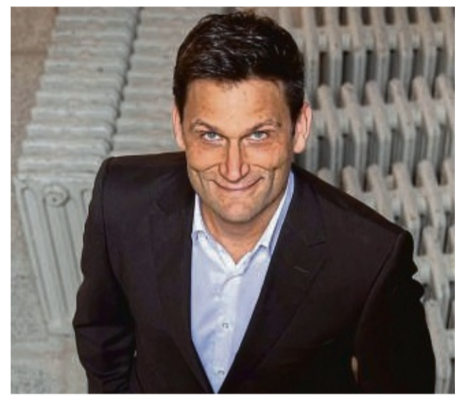
Satire: Christian Ehring tritt mit seinem Soloprogramm auf.